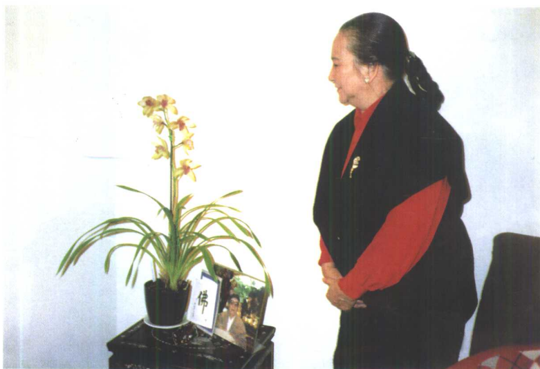
夏伊乔与君子兰相看两不厌