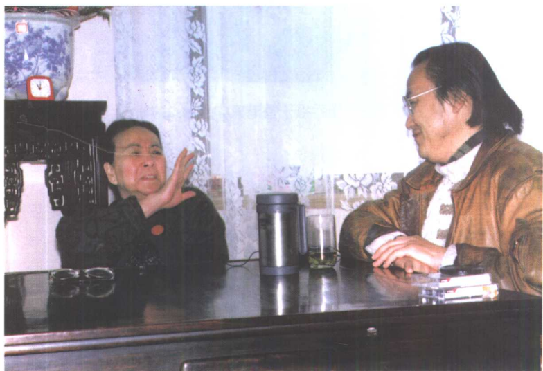
简繁访问师母夏伊乔