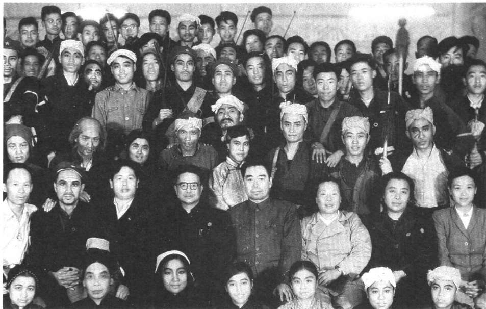
陪同周恩来观看歌剧《王贵与李香香》后与演职员合影。二排右三为李伯钊。（1950年）