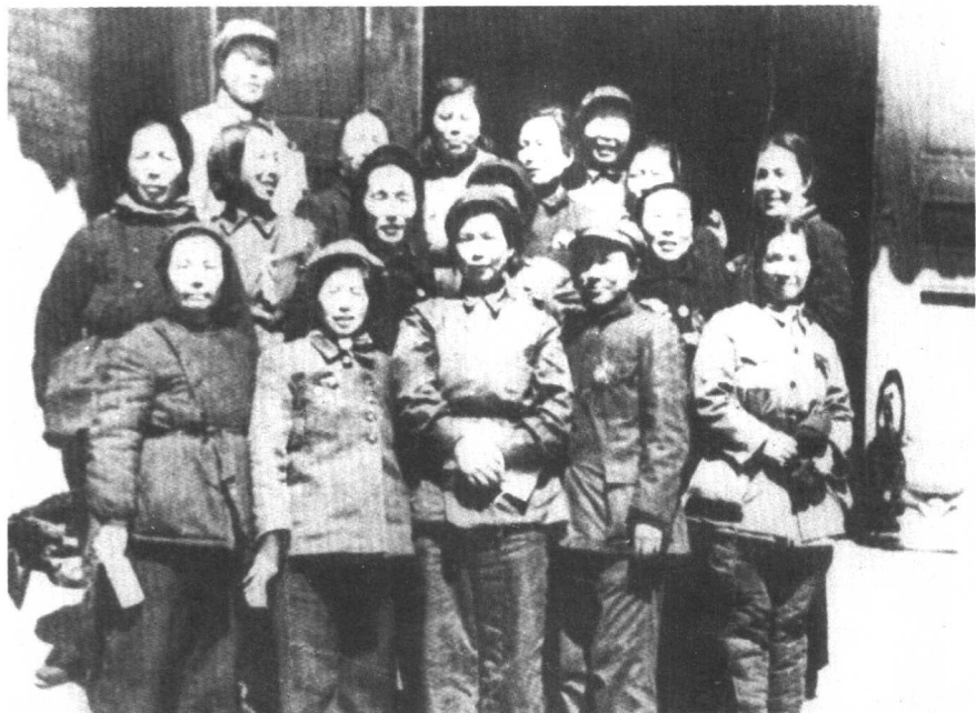
在第一届全国妇女代表大会上，部分参加过长征的女同志在中南海怀仁堂前合影。（1949年）李伯钊（二排右一）、蔡畅（三排右一）、康克清（三排右五）。