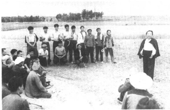
麦收劳动间歇， 为社员和师生唱歌。 （1959年）