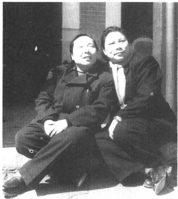
五十年代的李伯 钊与康克清。