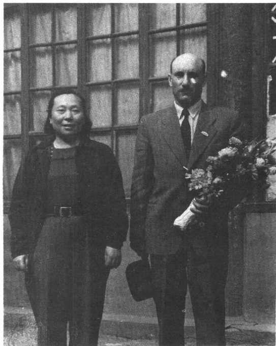
与苏联著名电影导演格拉西莫夫合影。（1950年）