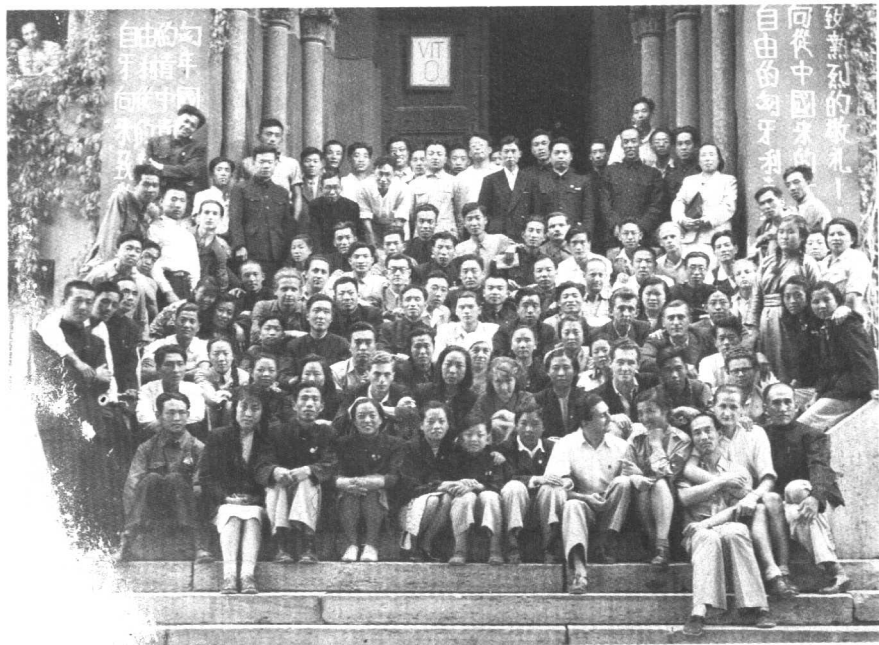
率中国青年文工团参加在匈牙利布达佩斯举行的第二届世界青年 联欢节。（1949年夏）