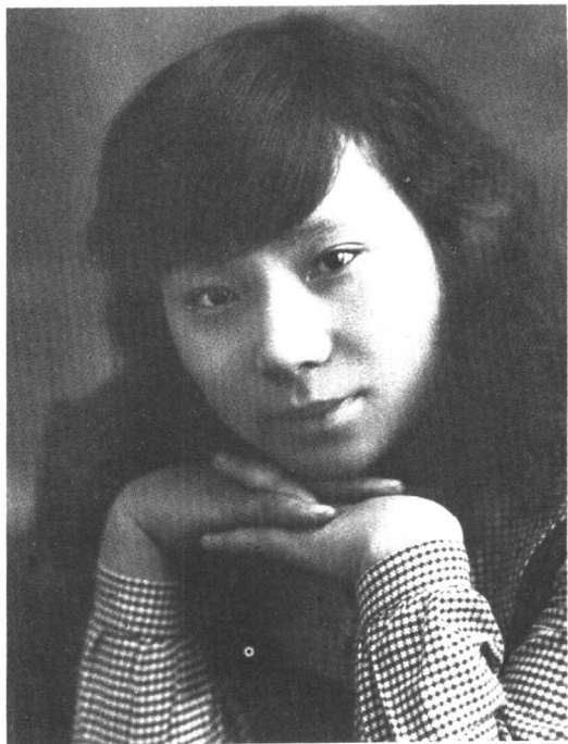
十九岁时的李伯钊 摄于莫斯科。