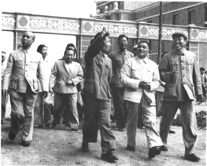
随邓小平、李富春视察黑龙江省富拉尔基重型机械厂。 (1959年) (邓小平右二、李富春右六、李伯钊右后五)