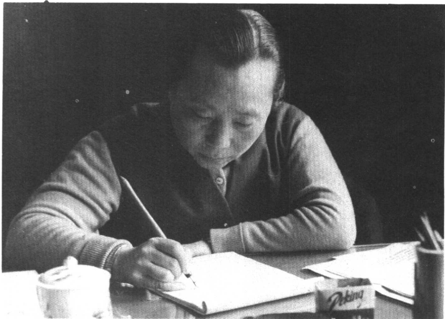
“文化大革命”前在写作。