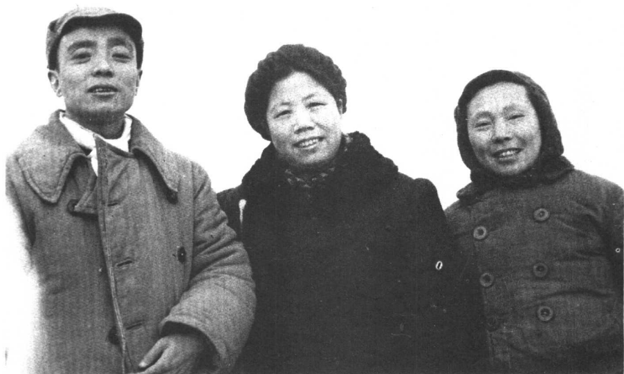
抗日战争时期，与杨尚昆、邓颖超摄于延安。