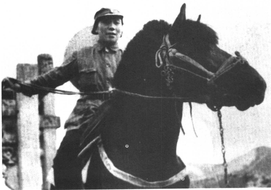
抗日战争时期在延安。（1939年）