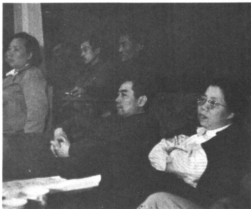
陪同周恩来、邓颖超观看歌剧《长征》的排练。 （1950年）