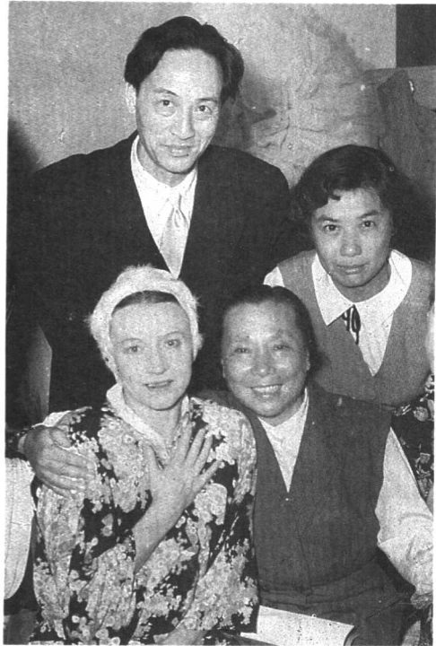
与苏联芭蕾舞大师 乌兰诺娃摄于首都剧场 后台。（1959年）