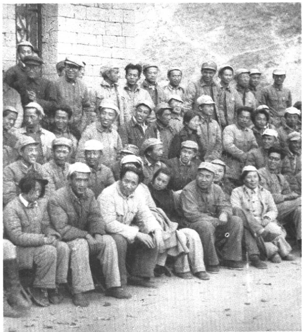
李伯钊（前排 右二）出席延安文 艺座谈会。（1942 年5月）