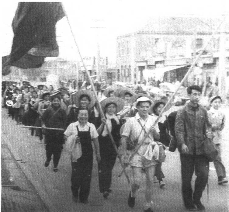
率领中央戏剧学院 师生赴十三陵水库工地 劳动。（1958年）