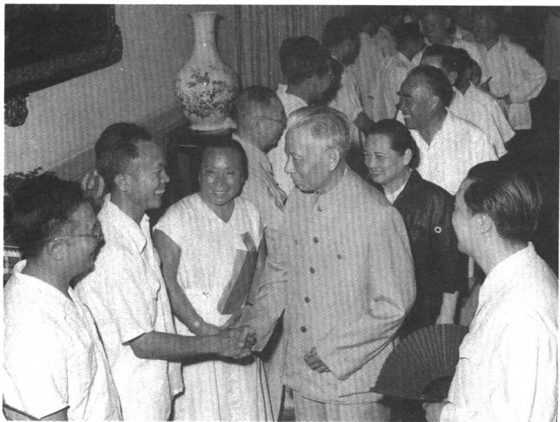
刘少奇、宋庆龄、朱德等接见第三次文代会主席团成员，左三为李伯钊。(1960年)