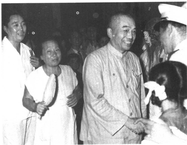
陪同彭德怀观 看中央戏剧学院演 出。（1958年）