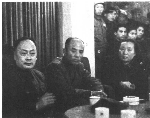
陪同陈毅、吕正操观看歌剧《长征》的排练。 （1950年）