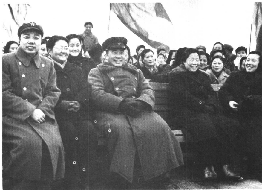
在我国第一批女航空兵飞行典礼上。（1952年三八节） 前排右起：李伯钊、邓颖超、朱德、李德全、肖华。