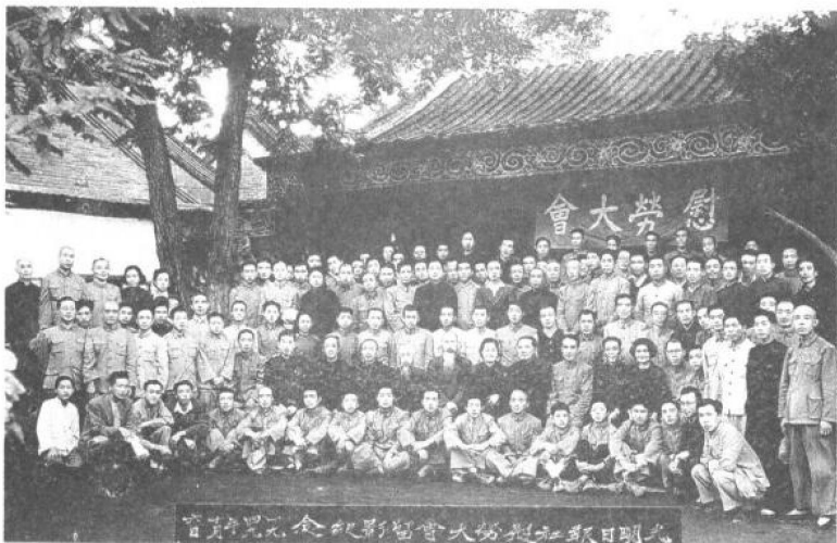
1949年10月，民盟领导人慰劳本报职工合 影。中排坐着（从左至右）为马连壁、萨空了、 胡愈之、周新民、沈钧儒、张澜、史良、章伯钧、 林仲易、费振东、冯晔、高璋卿。