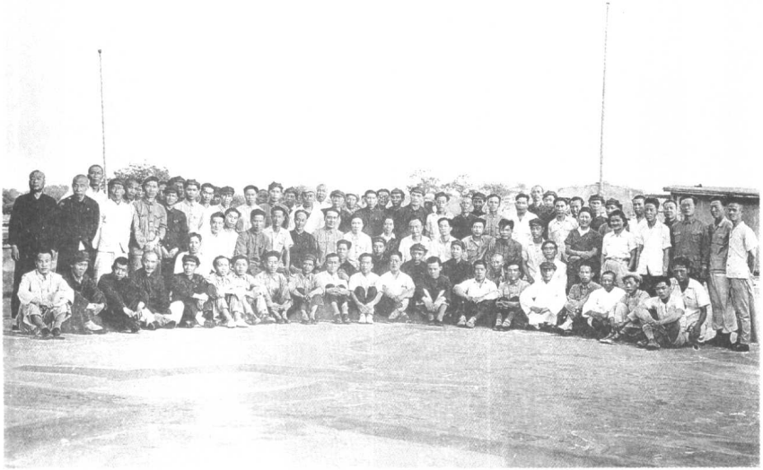
1950年7月7日，本報職工業餘學校開學合影