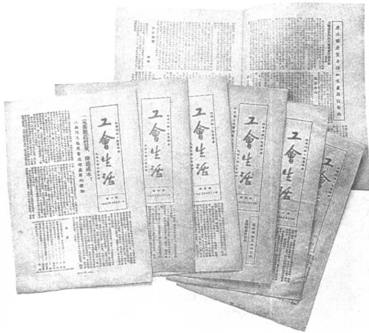
本報創辦初期工會出版的小報