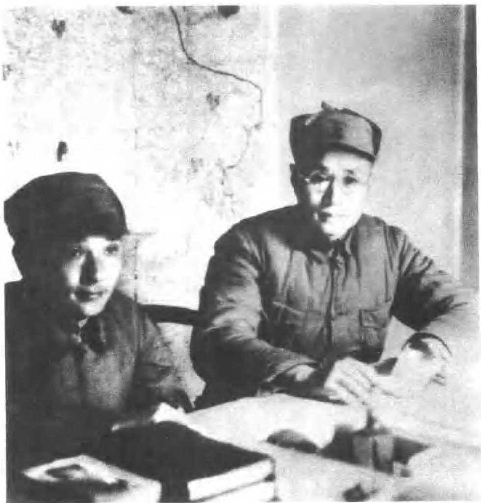
刘伯承与邓小平在战争年代