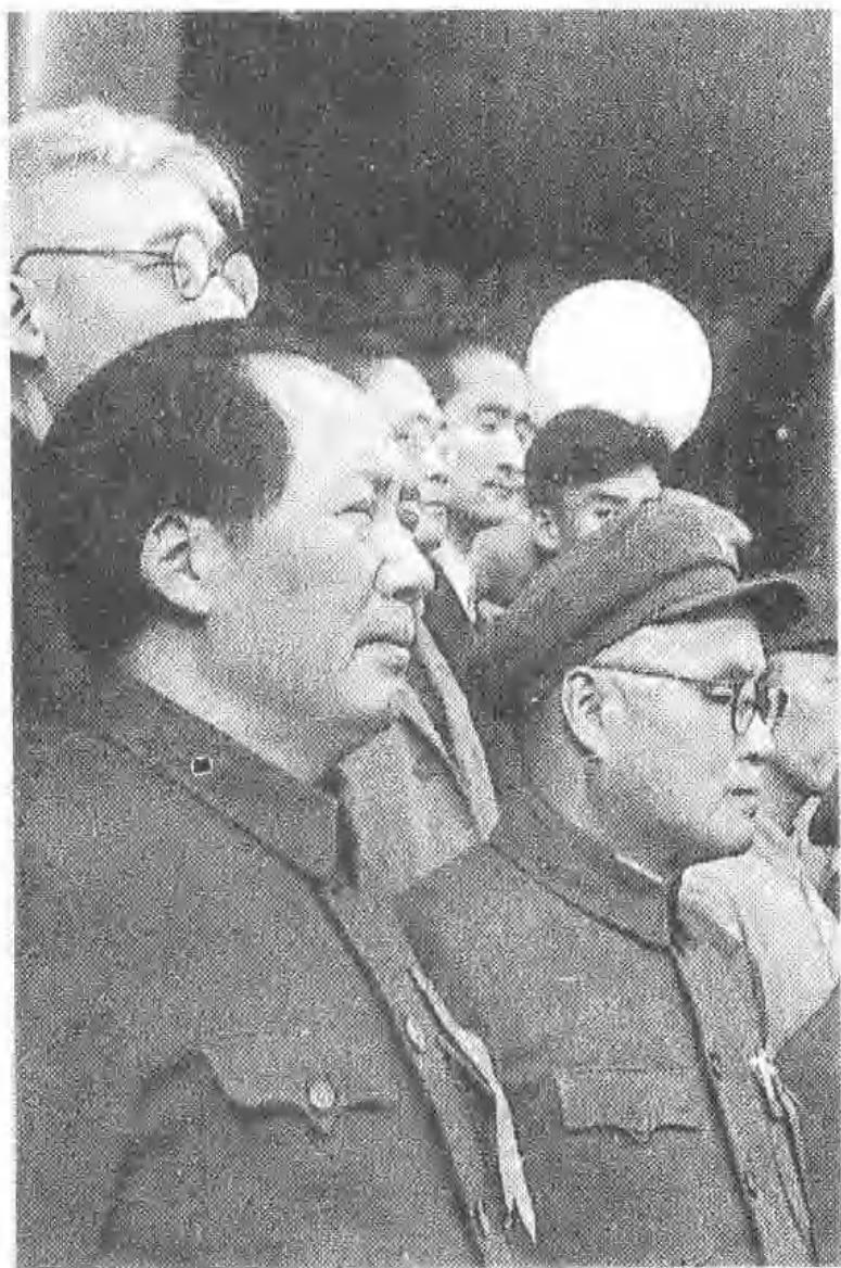
毛泽东与刘伯承在天安门城楼上