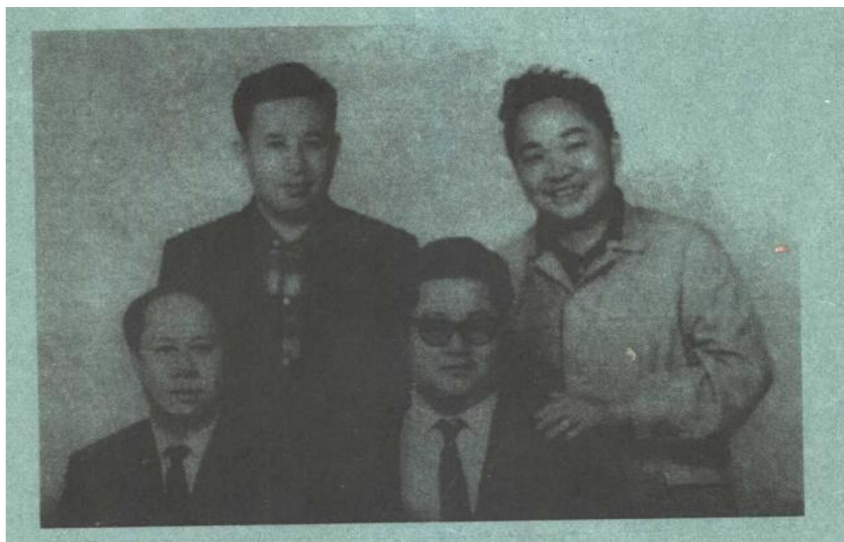
左一 卧龙生,左三 诸葛青云,右一 古龙。