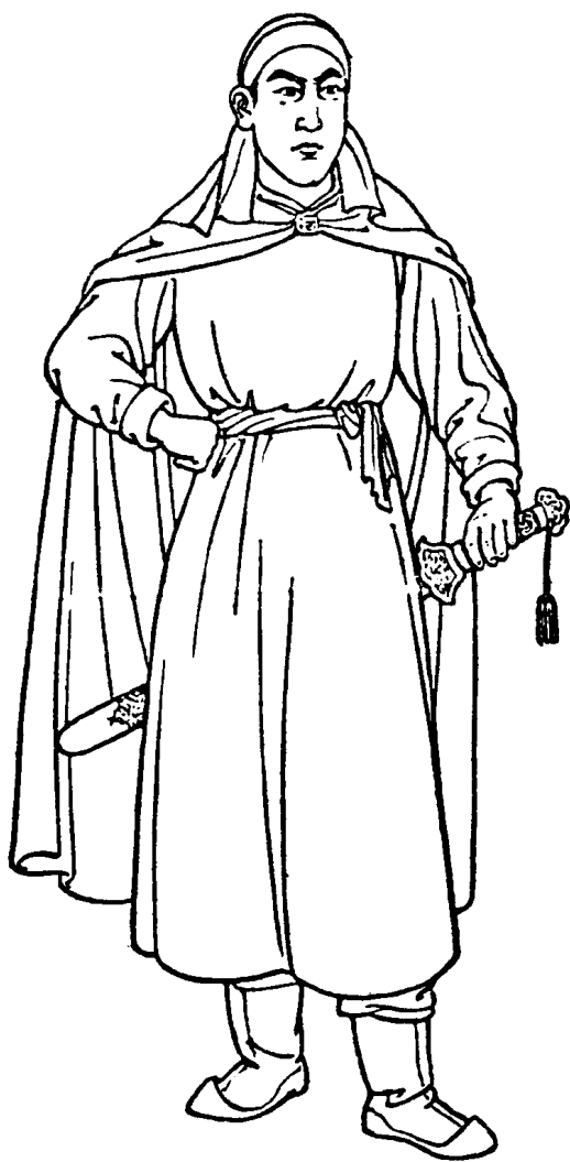
太平天国英王陈玉成像