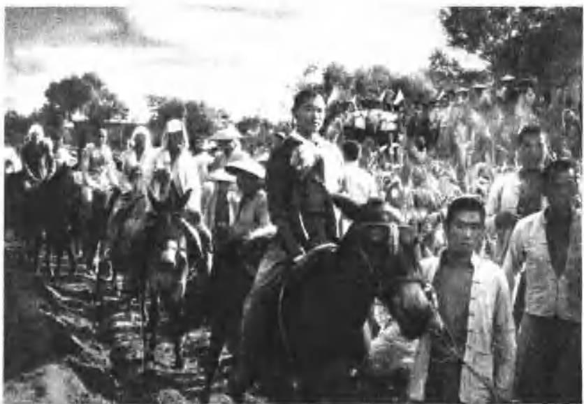
为保家保田，推翻蒋家王朝，民兵带头参加人民解放军。