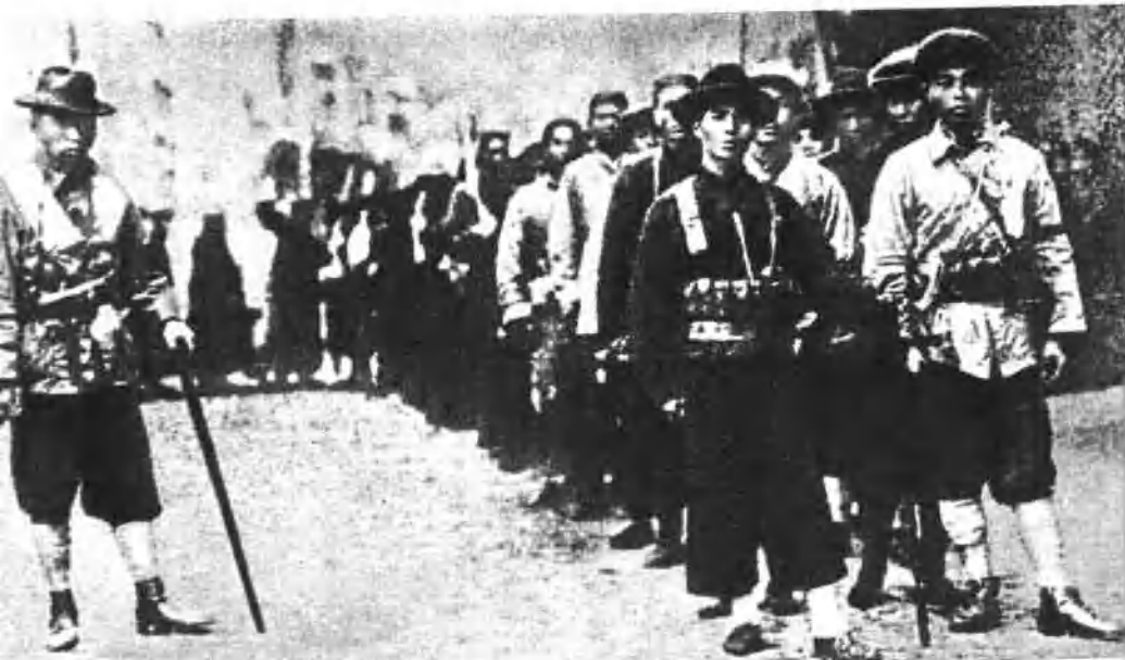
1927年3月上海工人第三次武装起义中工人纠察队一部。