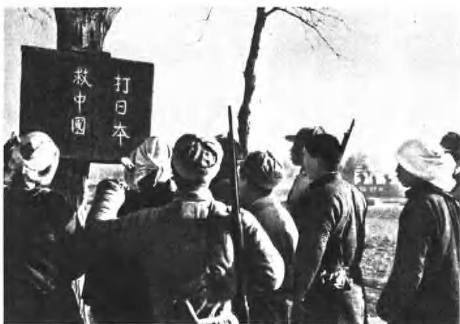
抗日战争爆发后，我军深入敌后，向民兵宣传打日本救中国的道理。