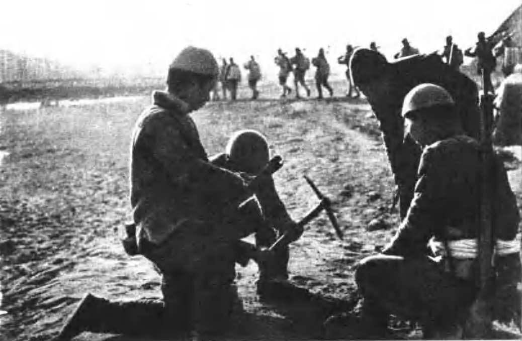
开展地雷战的民兵。