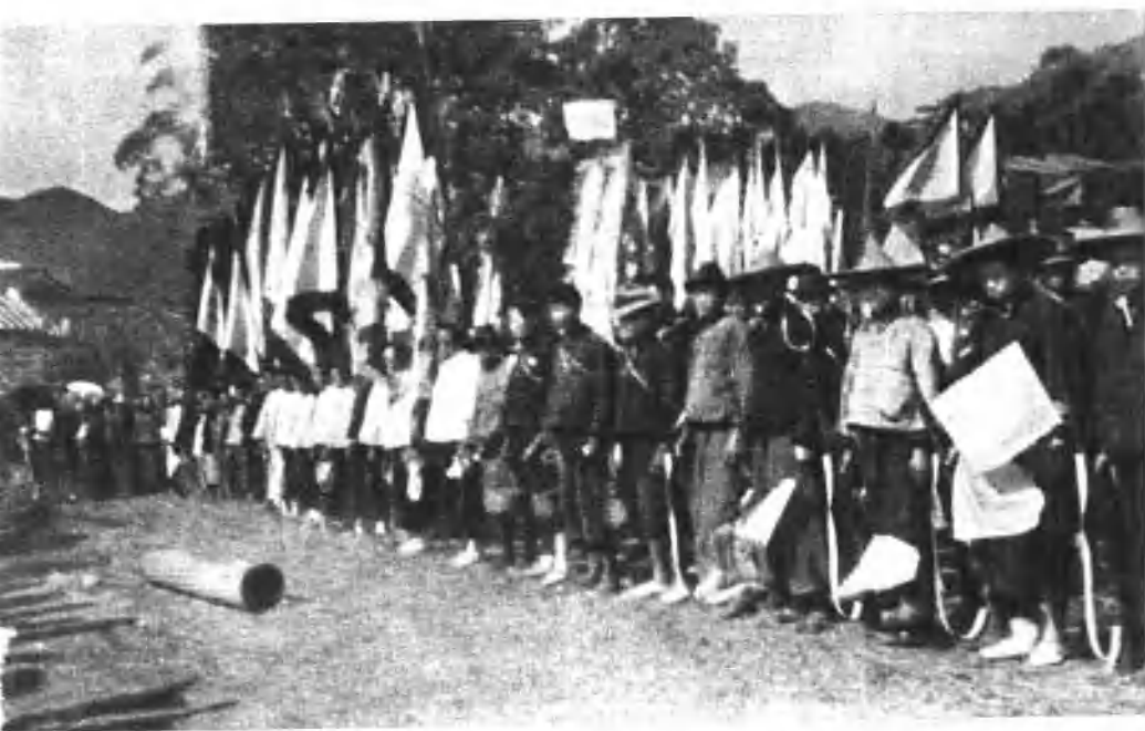
1931年中央革命根据地的群众武装——赤卫队。