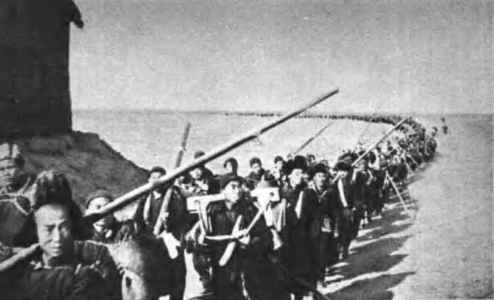
浩浩荡荡的民兵远征担架队南下支援大军。