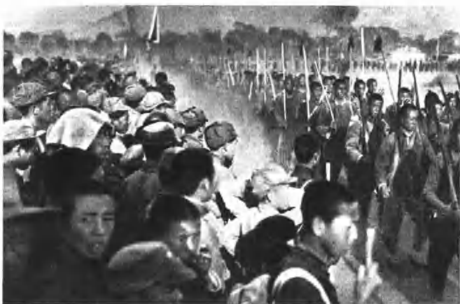
我抗日根据地中之威武雄壮的民兵和自卫军。