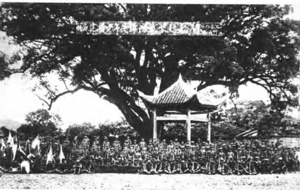
1932年福建省少年先锋队武装总检阅后的合影。