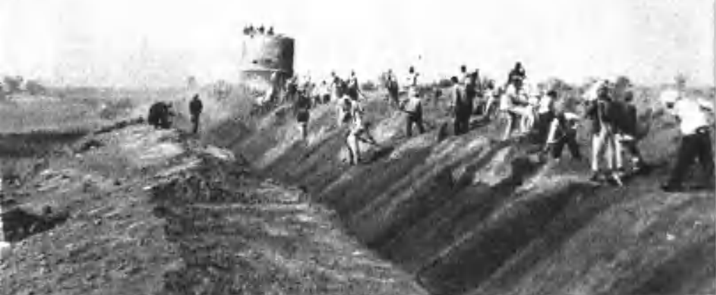
拆除敌人的封锁沟墙，为大兵团作战扫清障碍。