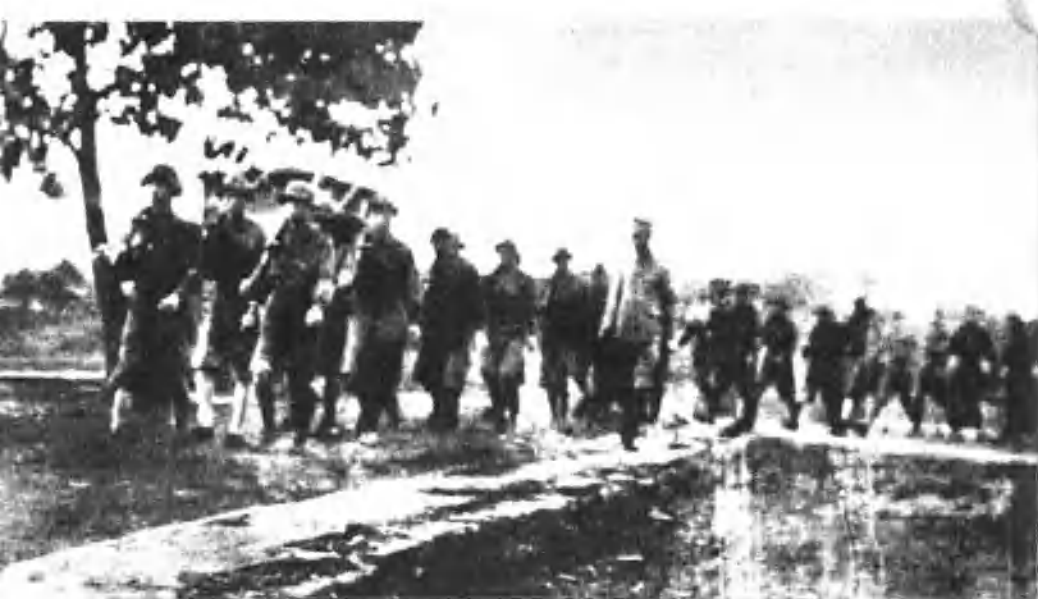
1924—1926年，党和毛泽东同志举办了农民运动讲习所。这是广州农民运动讲习所的学员在受军事训练。