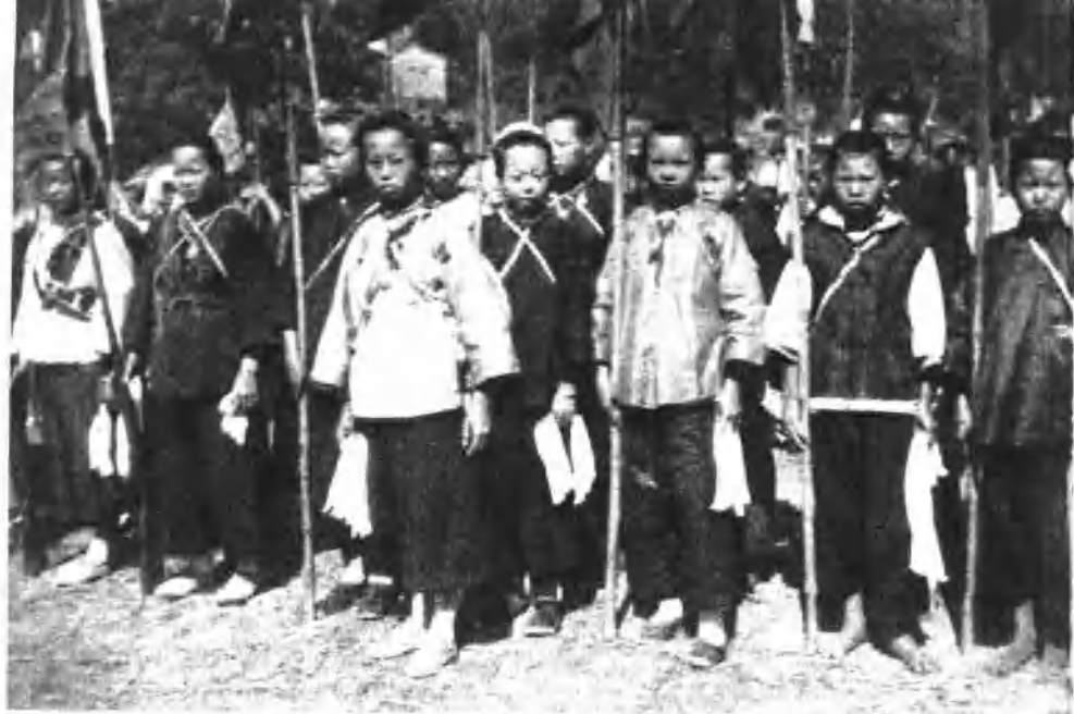
1931年粤东妇女赤卫队之一部。