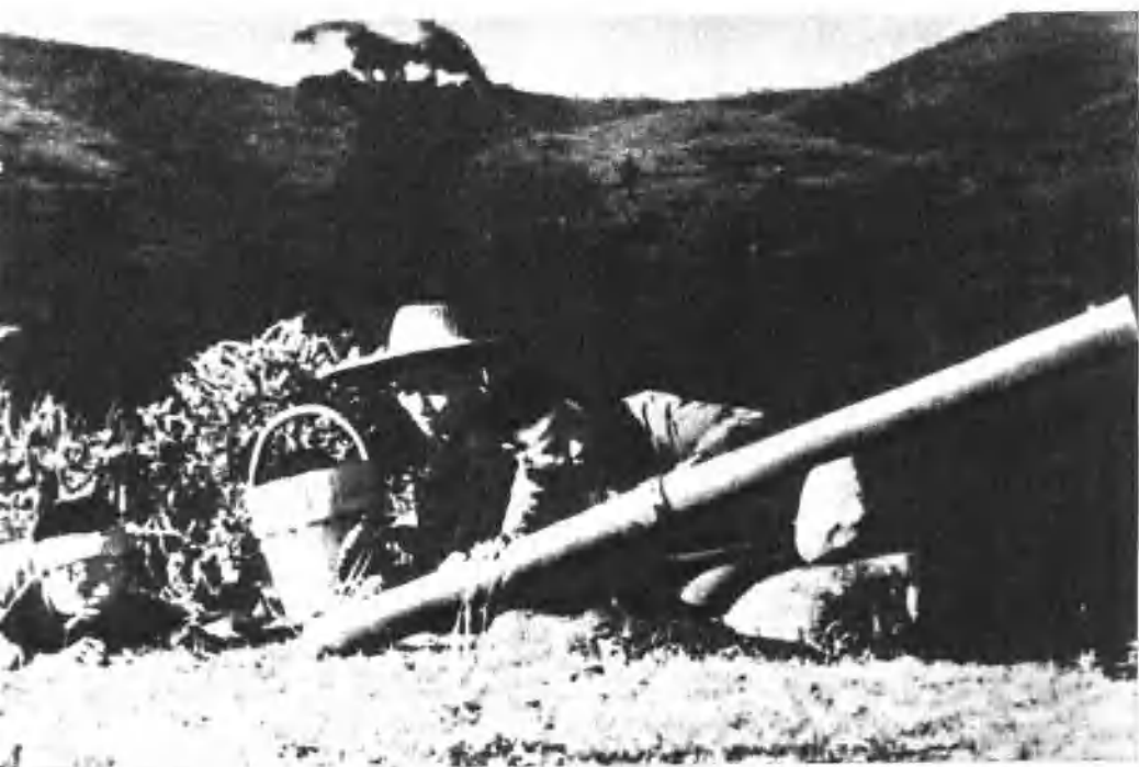
广东赤卫队员用土 炮向敌人射击。