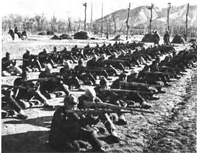
民兵苦练杀敌本领。