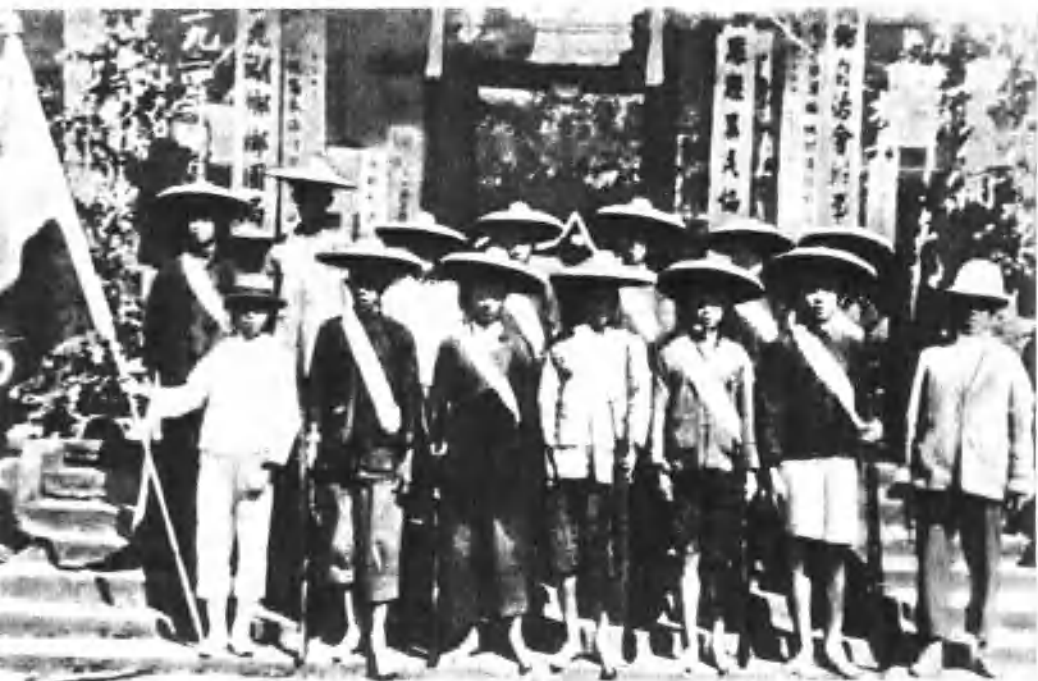
1924年广东省花县成立农民协会时的农民自卫军。