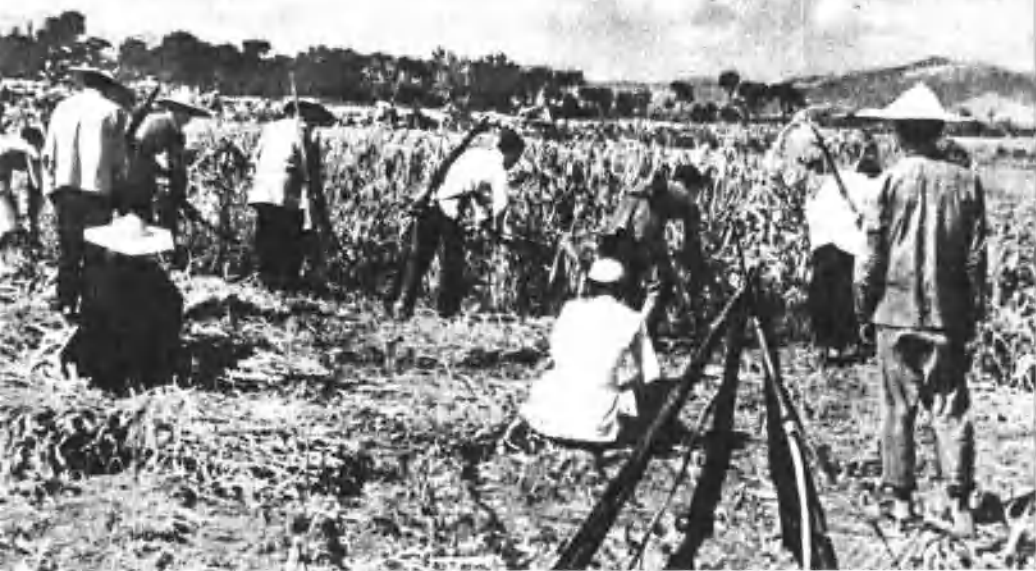
劳武结合，在战斗空隙收割庄稼。