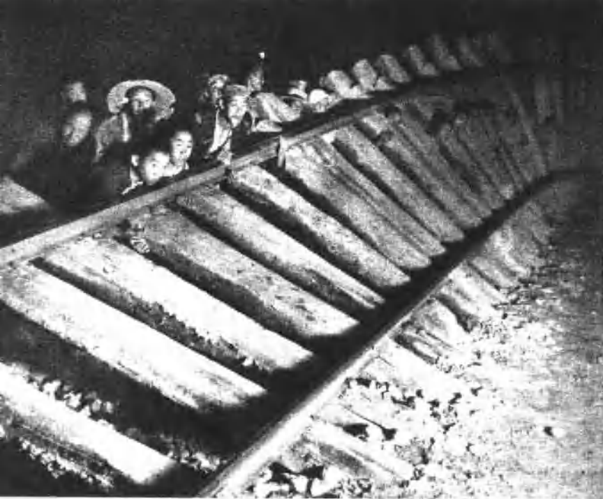
人民战争威力无穷。图为破坏敌人交通线的民兵群众。