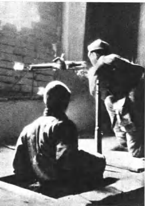
从地道中出来打击敌人的晋察冀民兵。