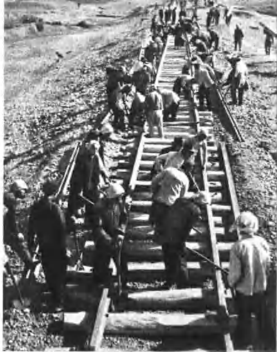
民兵抢修铁路，支援大军南下。