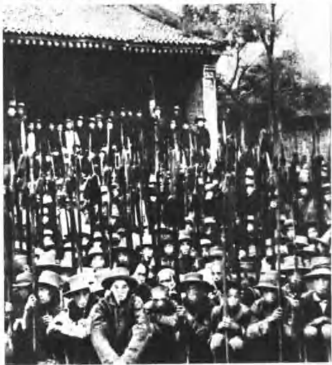
陕甘宁革命根据地的 赤卫队一部。