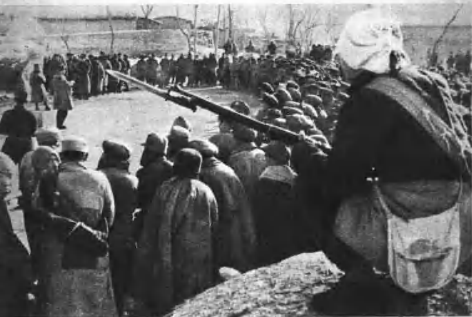
在人民战争的强大威力下，蒋家王朝终于覆灭，八百万蒋军全部被歼。这是定陶战役中民兵看押俘虏。