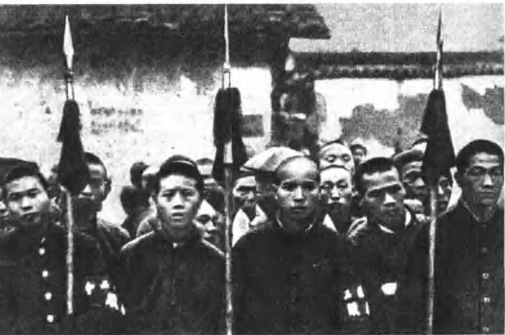
1926年江西的农民梭标队。