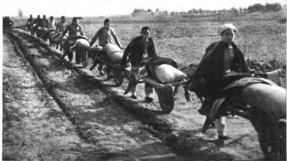
积极支援前线，民兵小车运粮队。