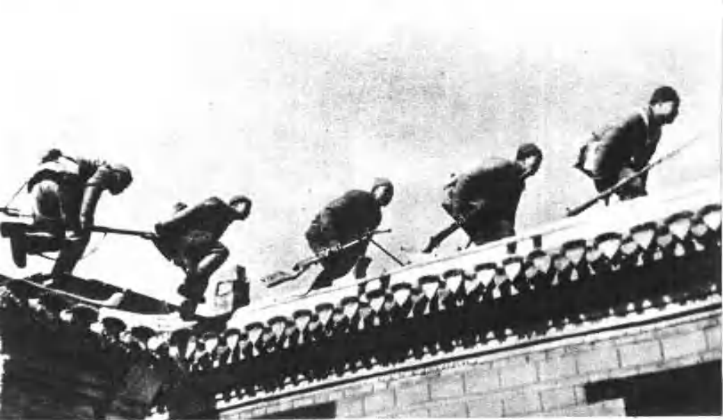
在村落战斗中的华北民兵。