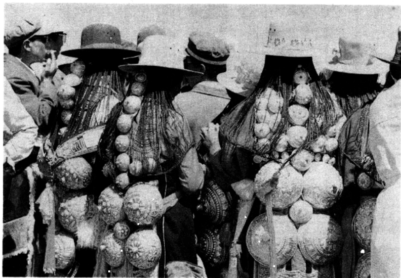
①身背银盾的藏族妇女