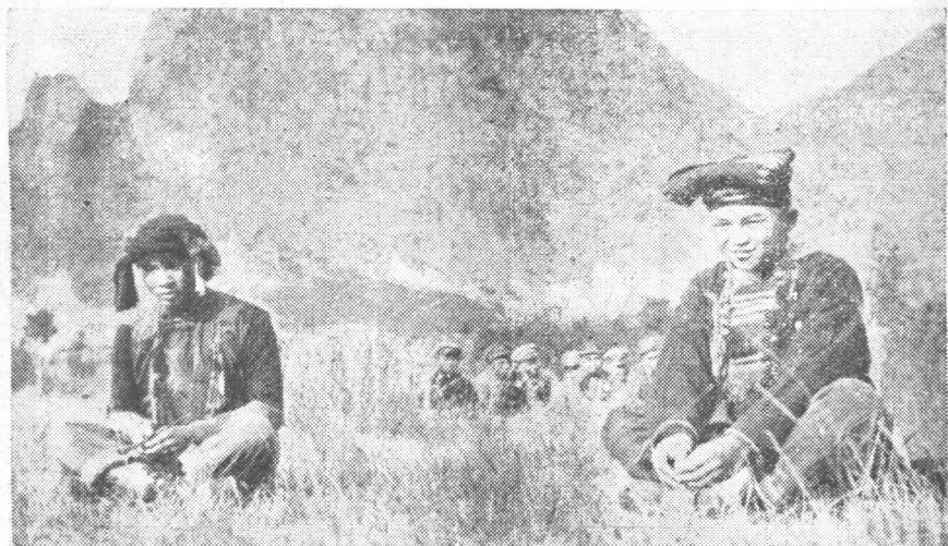
廣西板瑤男女調情對白