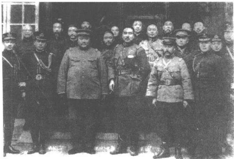
直皖大战中获胜的联军将领合影