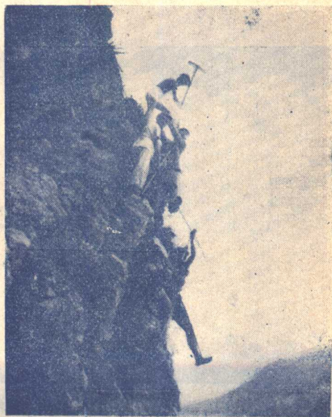
(4)工兵們用繩子拴在岩上工作的情形。