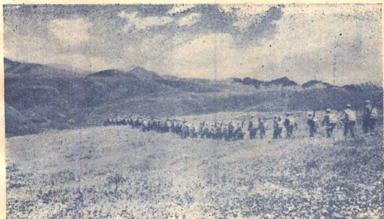
(3.)爲進軍西藏修築公路的工兵部隊，行進在西康草原上。