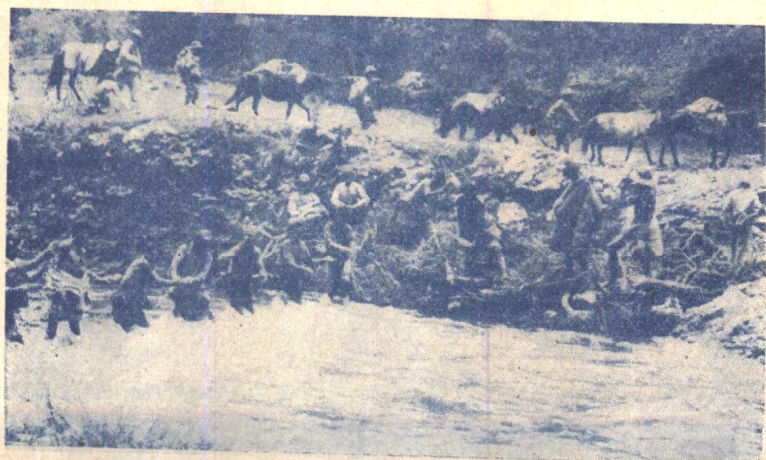
(6) 藏胞自動地組成修路隊，幫助解放軍修路。