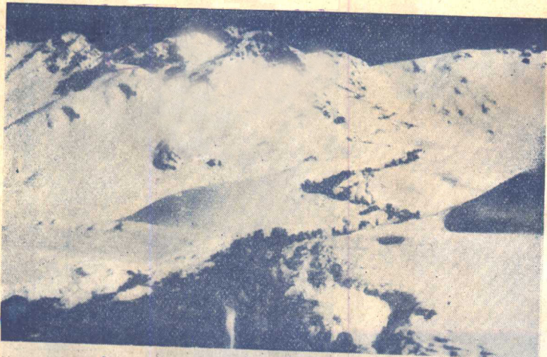
(2) 人民解放軍翻過雪山，向拉薩進軍。