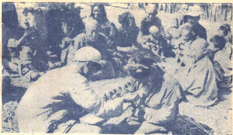
(7)我入藏人民解放軍工兵某團積極為藏胞治病。