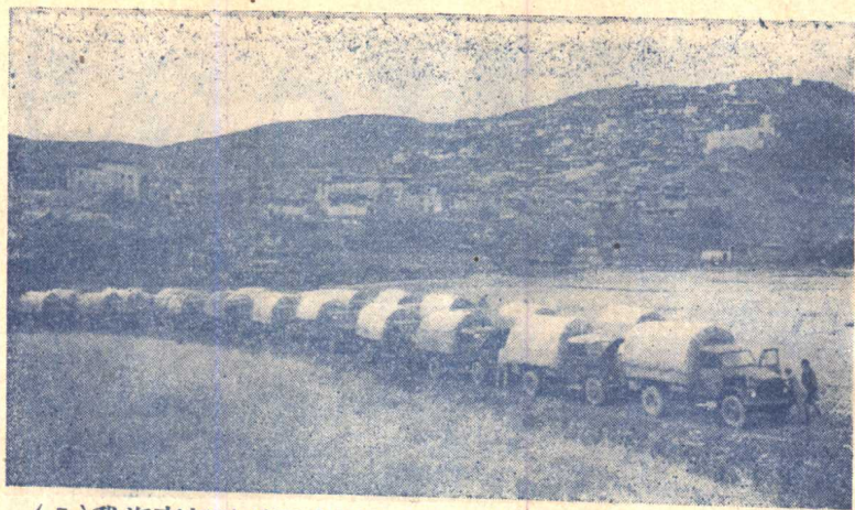
(5) 我汽車部隊爲了支援向西藏挺進的大軍，載運大批糧食及彈藥到達甘孜。(汽車後面即甘孜)