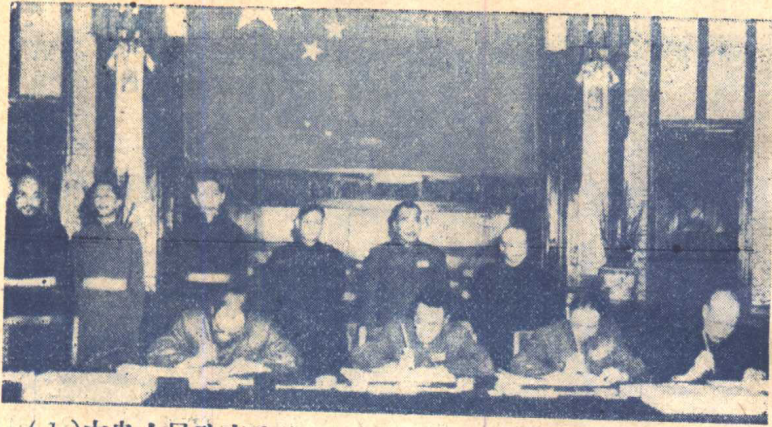
(1) 中央人民政府全權代表在關於和平解放西藏辦法的協議上簽字情形。右起：李維漢、張經武、張國華、孫志遠