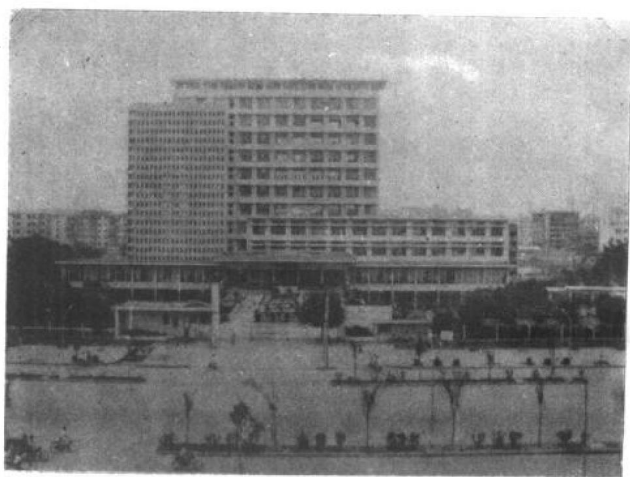
▲广西壮族自治区图书馆