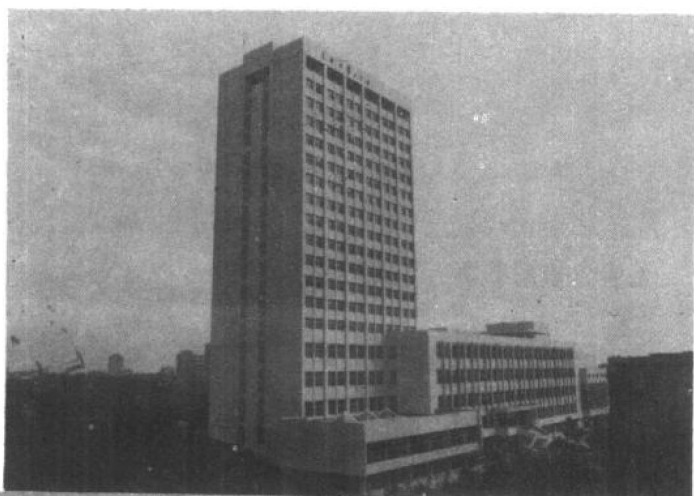
▲上海交通大学图书馆