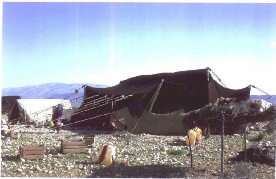
图1 游牧帐篷，现代伊朗