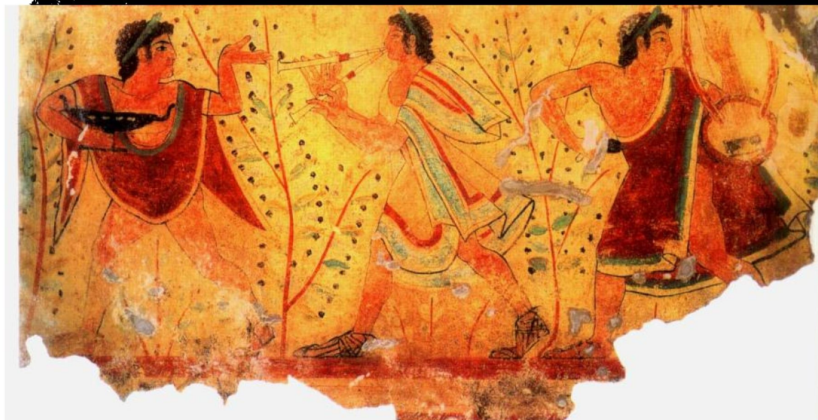
塔尔奎尼亚 狂欢者 约公元前470年

等价值判断，实际上只是 一种感情的表现，没有科学上的真理 性或客观的有效性。“你偷钱是错误的”这个 伦理学的判断实际只等于说“你偷了钱”加上一种感情态度或加个惊叹号而 已。偷钱与否是可以由经验证实的事实，但错误与否却不是能为经验所证实的 事实，从而也没有客观的真假。你说偷钱错误也不过是表示一种感情态度而 已。“美学的词语的用法与伦理学的词语完全一样。像‘美的’‘丑的’便与伦 理学的词汇一样，并非对事实的陈述，而只是表现某种感情和引起某种反应而 已。从而，如在伦理学中一样，以为审美判断有客观有效性是没有意义的。…… 与伦理学一样，不能证实美学是体现知识的一种形式。”[A.J.Ayer. Language, Truth and logic .