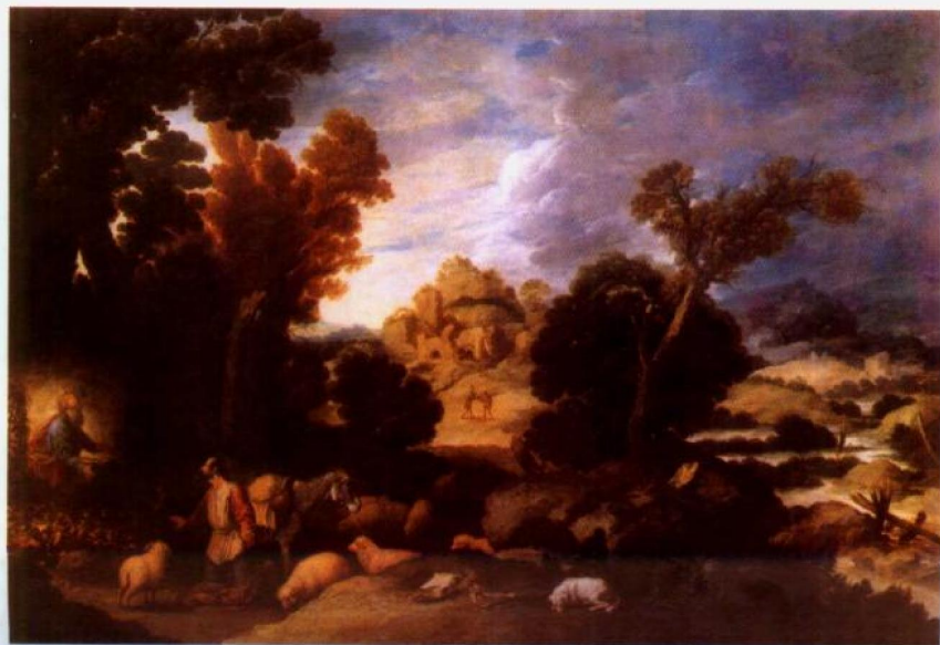
法兰西斯可·科朗提斯 创作的灌木丛

从很早起到目前止，一直有一种看法、意见或倾向，认为不存在什么美学。美或审美不可能也不应该成为学科，因为在这个领域，没有认识真理之类的知识问题或科学问题，也没有普遍必然的有效法则或客观规律。庄子早在两千年