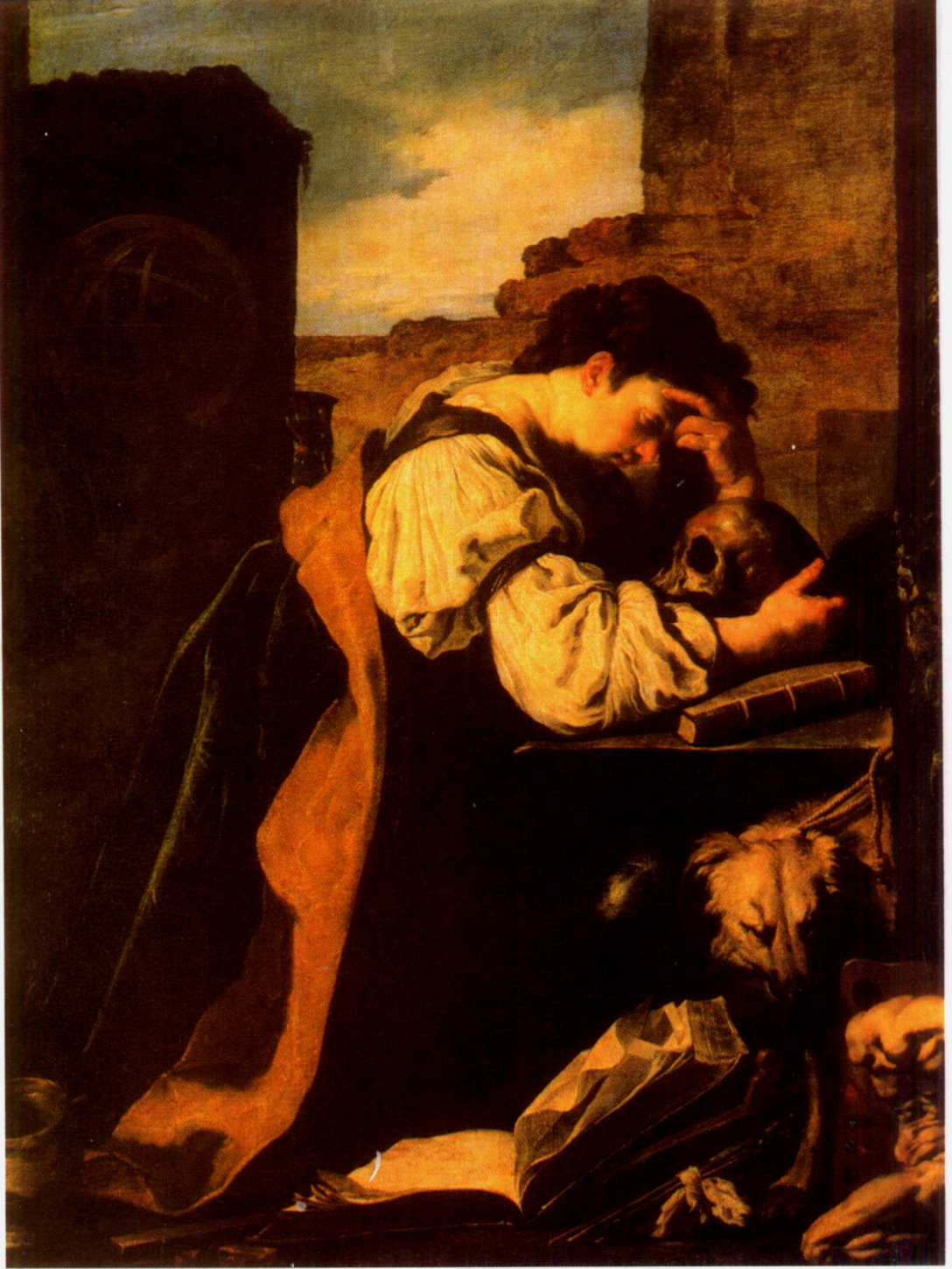
多明尼克·费提 忧郁或忏悔的玛格达兰