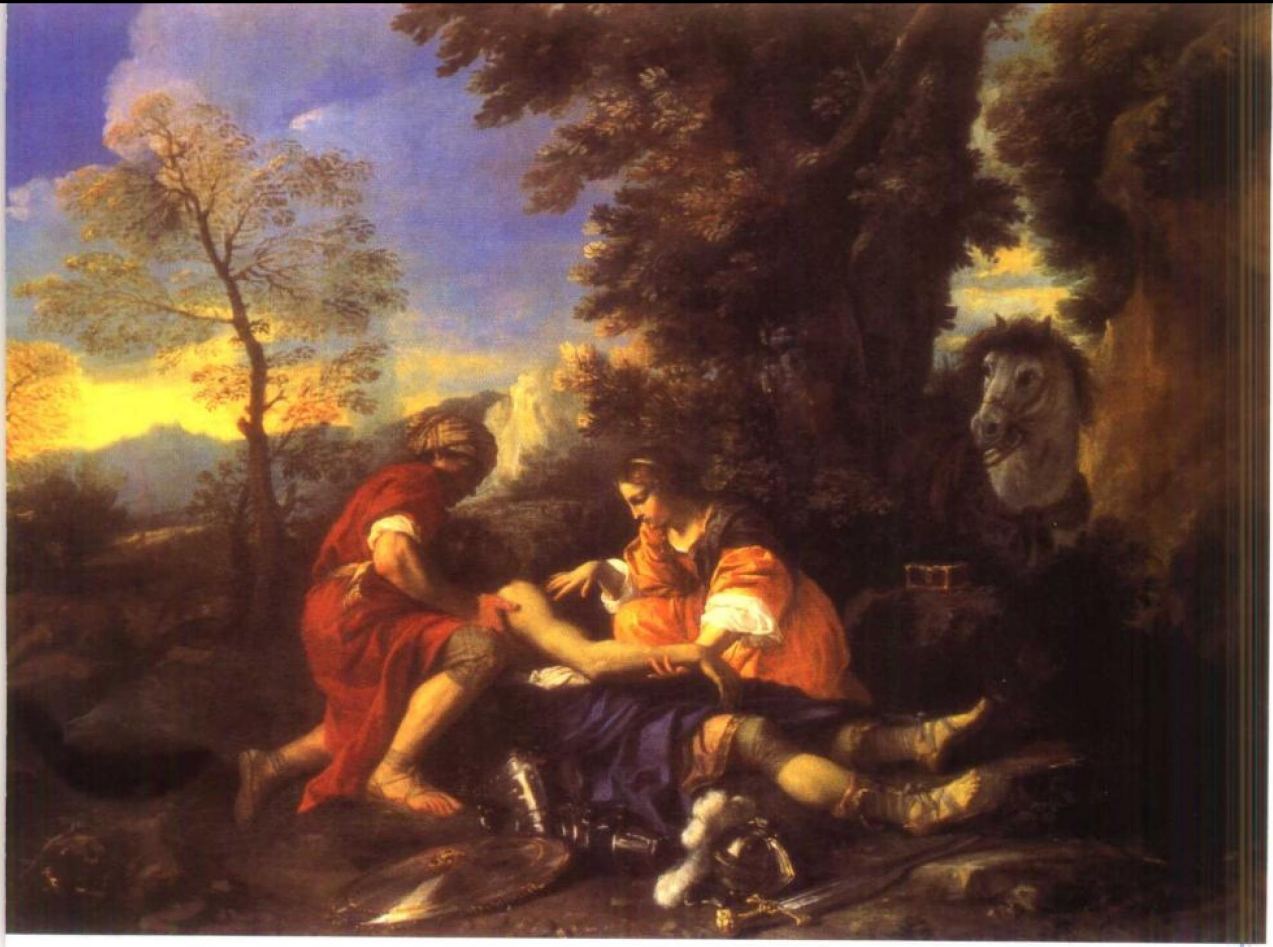
彼尔·法兰且斯科·莫拉 贺未尼雅与法瑞诺照顾 受伤的涅克德

取消美学的观点、论调当然也并不完全一致,例如艾耶尔认为美学仍然可以研究审美的心理学和社会学上的原因,例如有的人认为历史上的美学理论在一定顷况下强调出艺术的某个方面,仍有积极作用,等等。但总的说来,这派哲学否认美学能作为一门有关价值判断的理论学科或哲学而存在,而哲学本身,在他们那里本就是语言分析,如维特根斯坦所说:“关于哲学大多数命题并不是虚假的,而只是无意思的,因之我们根本不能回答这类问题,我们只能说它们的荒唐无稽。哲学家们的大多数问题和命题是由于我们不理解我们语言的逻辑而来的。”[参阅维特根斯坦《逻辑哲学论》,第44页,商务印书馆,北京]所以,维特根斯坦认为,把美学看成是说明美是什么的科学,便是“可笑的”。[转引自薛华《黑格尔与艺术难题》第131页,中国社会科学出版社1981年版]审美和伦理都属于非定义的领域。比兹利(M.C.Beardsley)等人的分析美学在这个哲学潮流中便也风行一时。