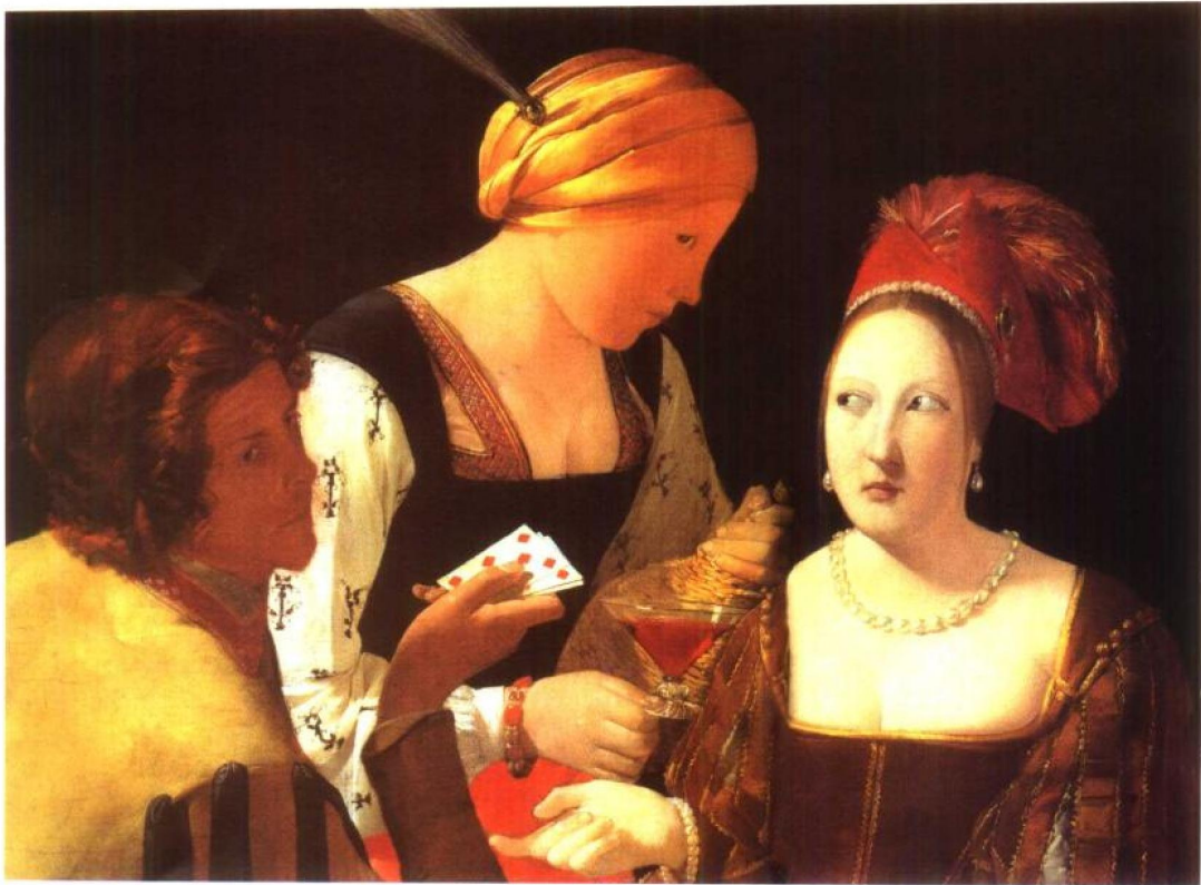
拉·图尔 拿红方块A的骗子 (局部)

作了细密的探讨和科学的清理,把问题提示得更为清晰,使人们不能再停留在含混笼统的一般谈论中了。特别是它在揭露美学中一些基本概念如美、丑、艺术、模拟、表现、形式主义、现实主义等等的词义含混、歧异多义,是有贡献的。哲学人文学科的一些基本概念、词汇大多来自日常语言,多义性、隐喻性、含混性十分突出。美学和文艺理论中的许多命题和争论,特别是这种争论的混乱性质,很重要的一个原因就由此而起。例如前些年十分热闹的关于形象思维的讨论便相当典型,争论了半天,“形象思维”这个词究竟是什么意思,它包含有哪几种不同含义,却并没弄清楚。分析哲学确乎可以帮助人们去做一些非常必要的澄清,使人们习惯于比较严格地、科学地注意使用概念、语词和语句。这在今天的中国学术界特别值得提倡。而研究美学和艺术领域的语词、语句、用法、含义等,也仍然是件巨大的工作。