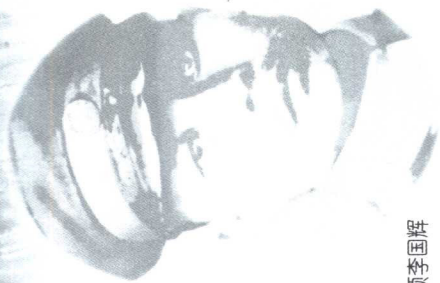
国民党残军首领李国麟