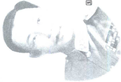
国民党残军首领李弥