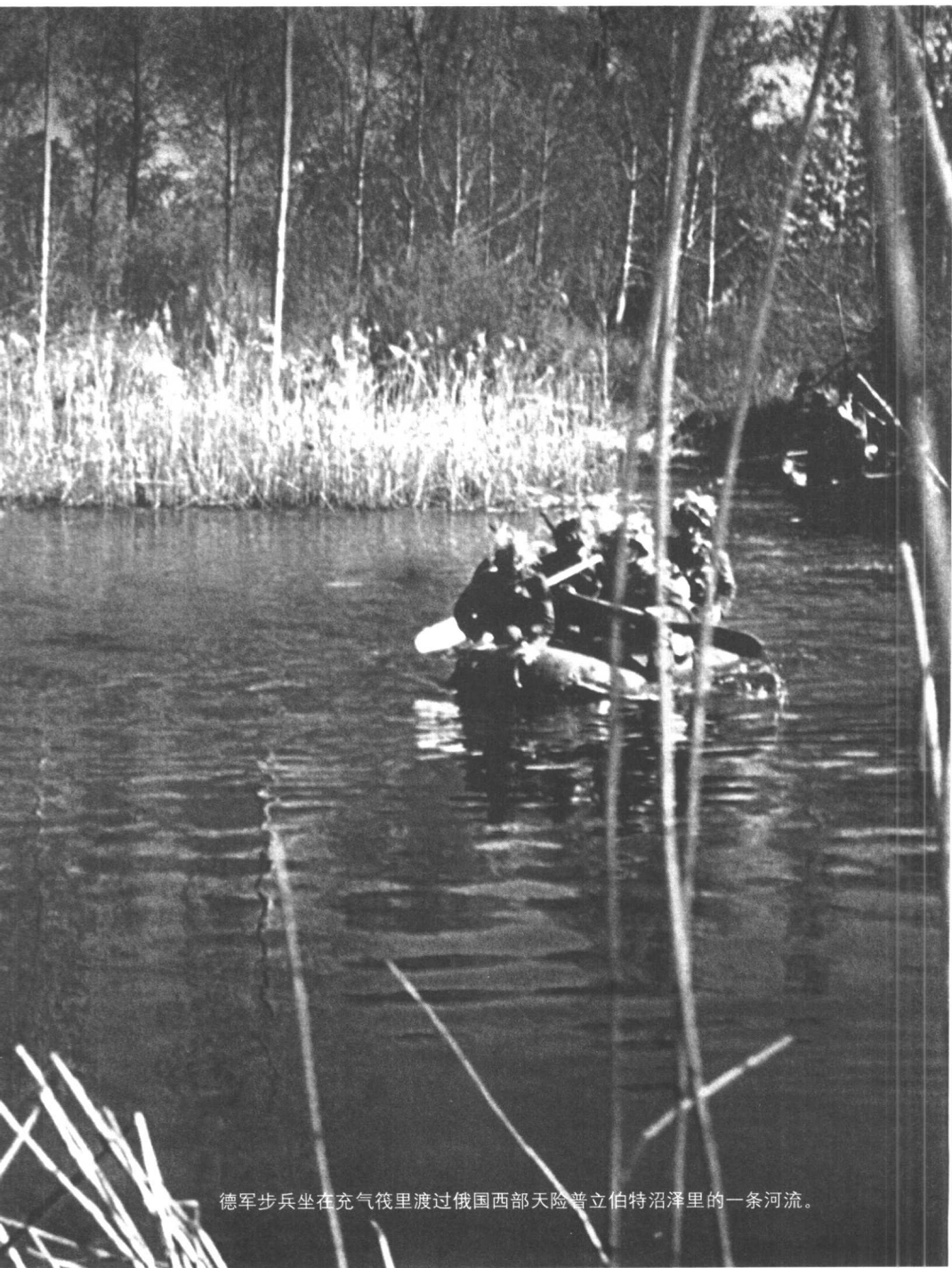
德军步兵坐在充气筏里渡过俄国西部天险普立伯特沼泽里的一条河流。