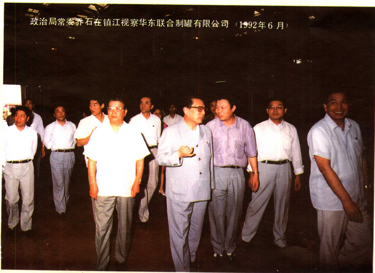
政治局常委乔石在镇江视察华东联合制罐有限公司（1992年6月）