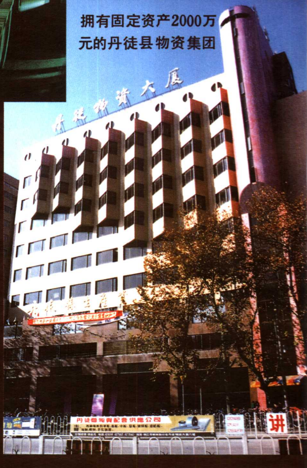
拥有固定资产2000万元的丹徒县物资集团