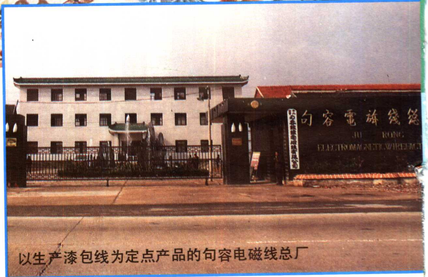
以生产漆包线为定点产品的句容电磁线总厂