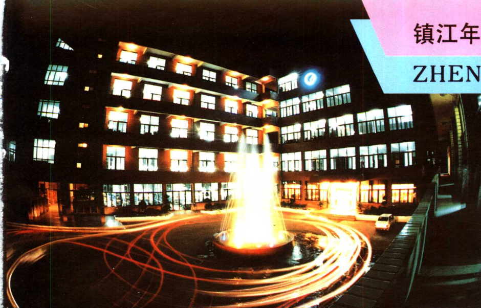
江苏省出口服装生产重点企业，丹徒县服装厂