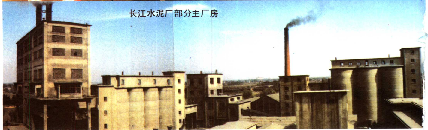
长江水泥厂部分主厂房