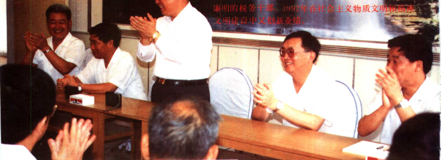
国家税务总局局长金鑫（中），在省税务局局长翁荣华（右二）陪同下，视察镇江税收工作。

镇江市税务局坚持以经济建设为中心，加强税收征管为国家聚财，积极帮助企业排忧解难，支持地方经济发展，同时加强队伍建设，培养又红又专，清正廉明的税务干部。1992年在社会主义物质文明和精神文明建设之又创新业绩。