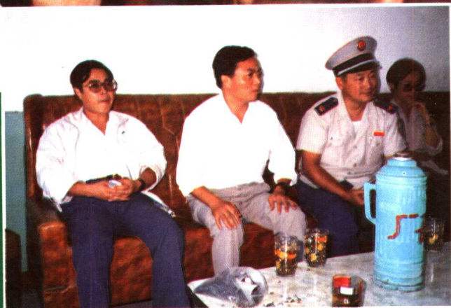
镇江市税务局局长毛景昌深入企业了解情况