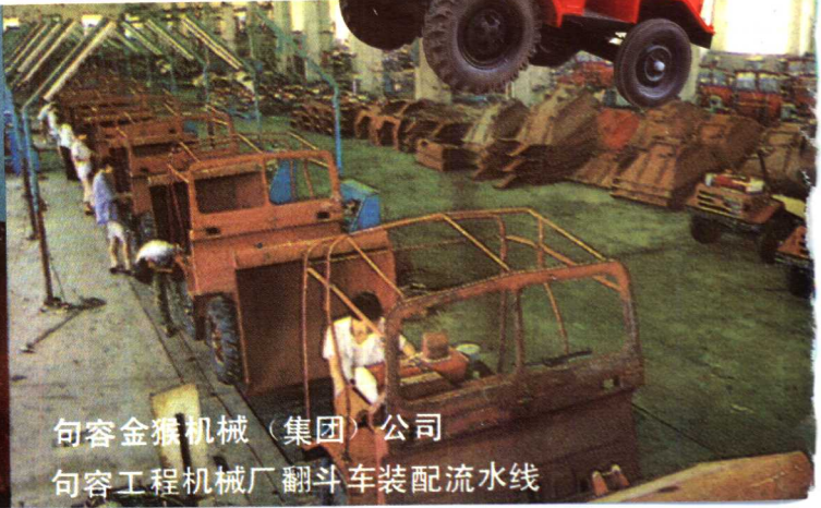
句容金猴机械(集团)公司 句容工程机械厂翻斗车装配流水线