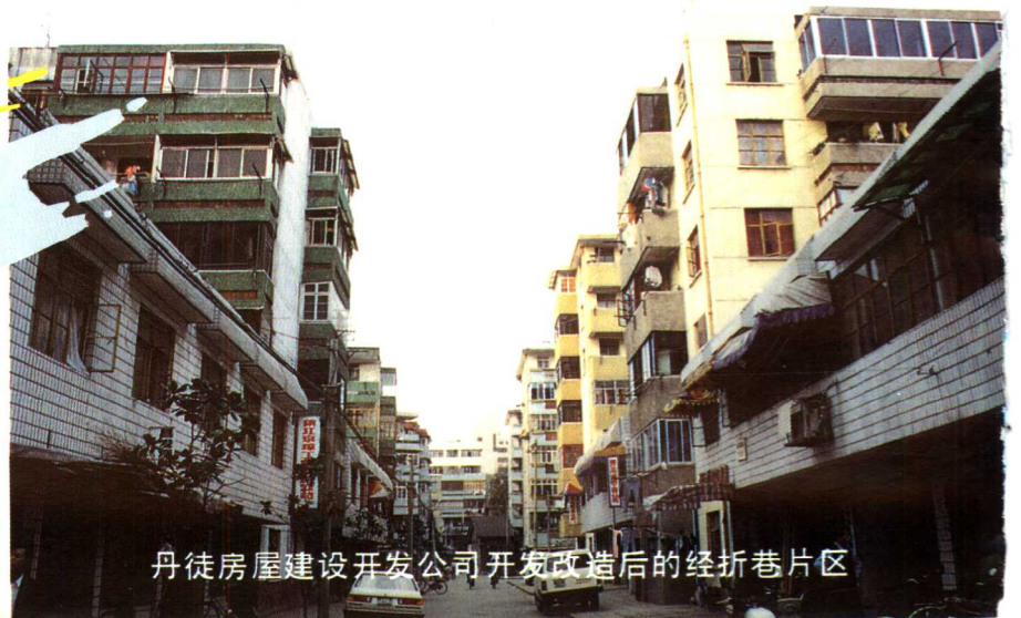
丹徒房屋建设开发公司开发改造后的经折巷片区