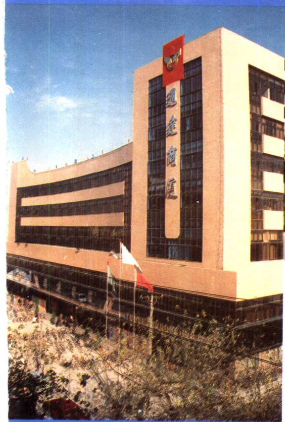
● 县城中心的通达商厦