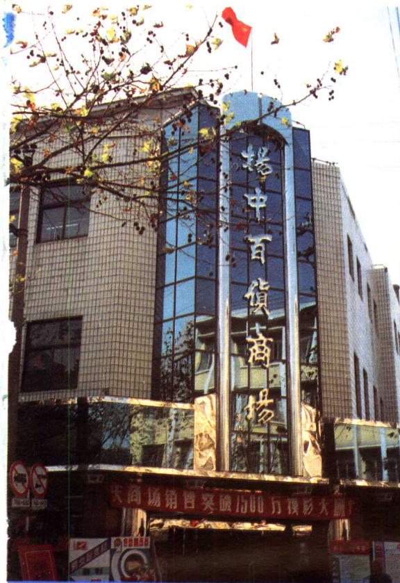
● 繁华的县百货商场