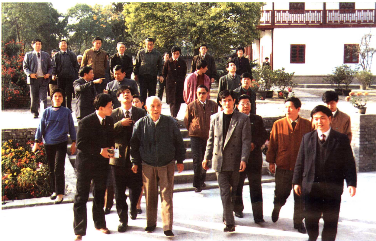
2 国家对外经济贸易部部长李岚清视察镇江经济技术开发区（1992年9月）