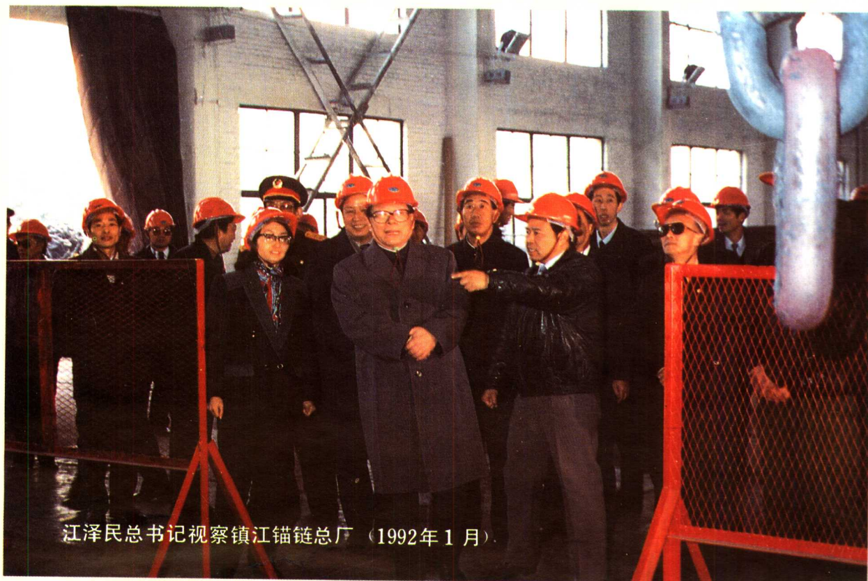
江泽民总书记视察镇江锚链总厂（1992年1月）