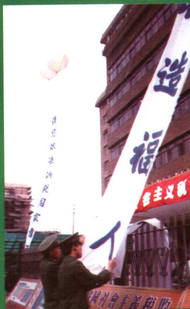
解放军战士在税务局大楼前参加税务宣传