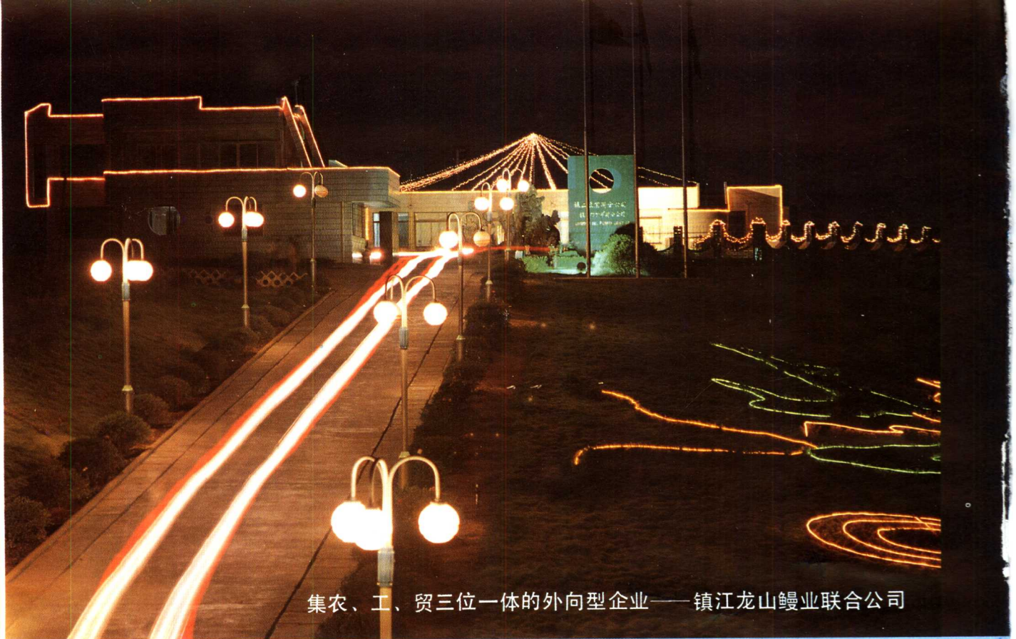
集农、工、贸三位一体的外向型企业——镇江龙山鳊业联合公司