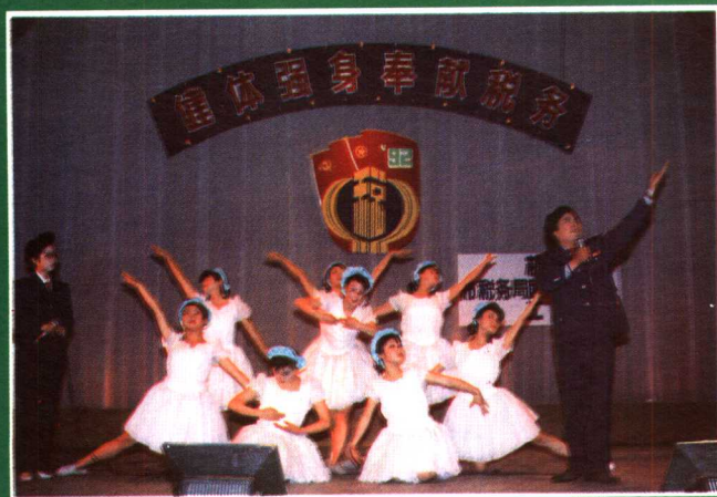
开展《团体强身奉献税务》系列活动——文娛会演