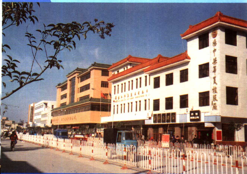
● 新开通的江洲东路