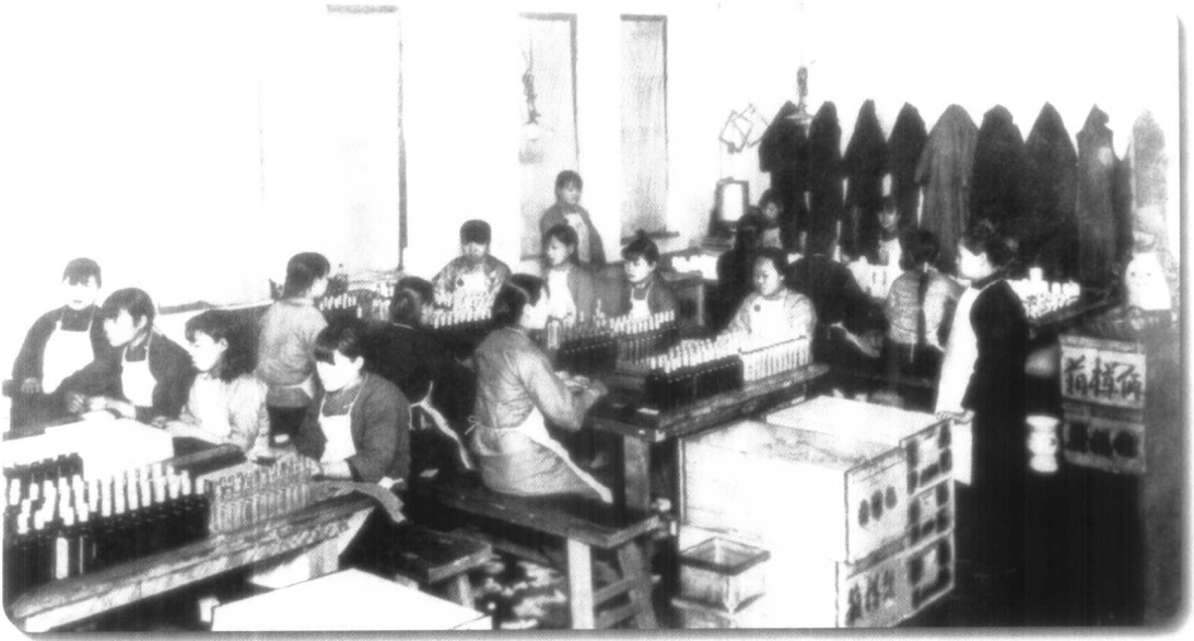
▲ 40年代工人在车间工作的情景。