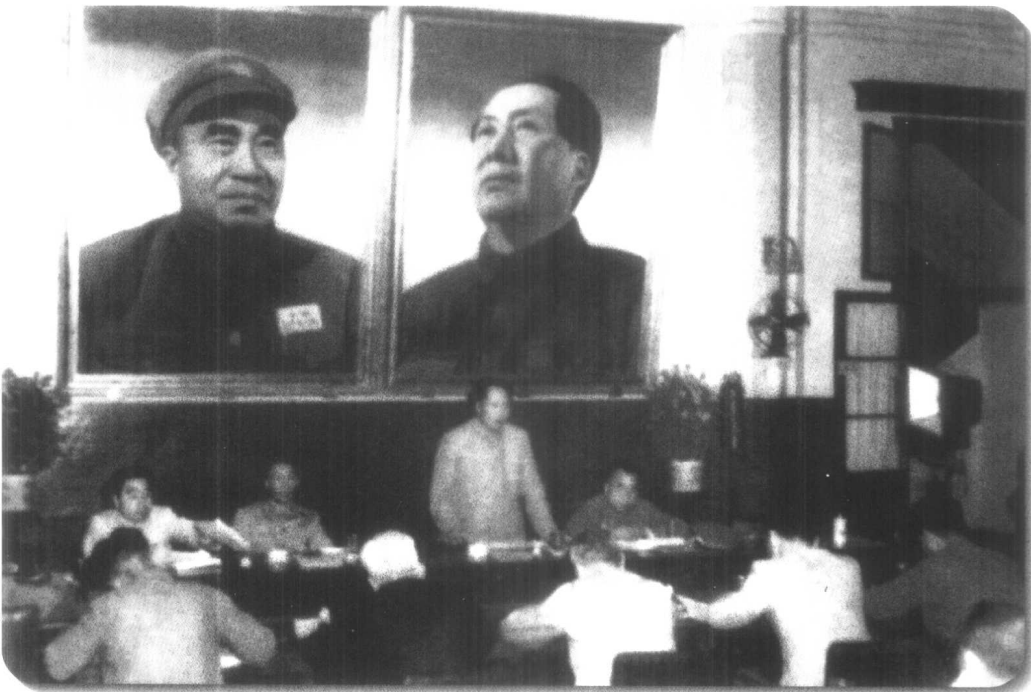
▲ 1950年6月6日至9日，中国共产党在北京召开了七届三中全会。这是建国后我党召开的第一次中央全会。会上，毛泽东作了《为争取国家财政经济状况的基本好转而斗争》的书面报告。