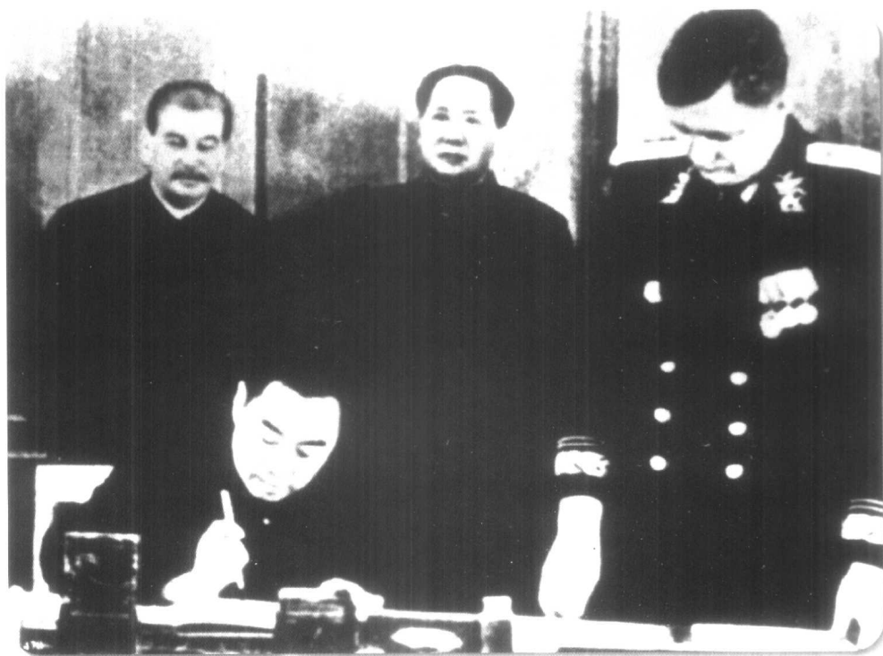
▲ 1949年12月，毛泽东访问苏联。1950年2月14日，中苏两国政府在莫斯科签订《中苏友好同盟互助条约》。图为周恩来代表中国政府在条约上签字。