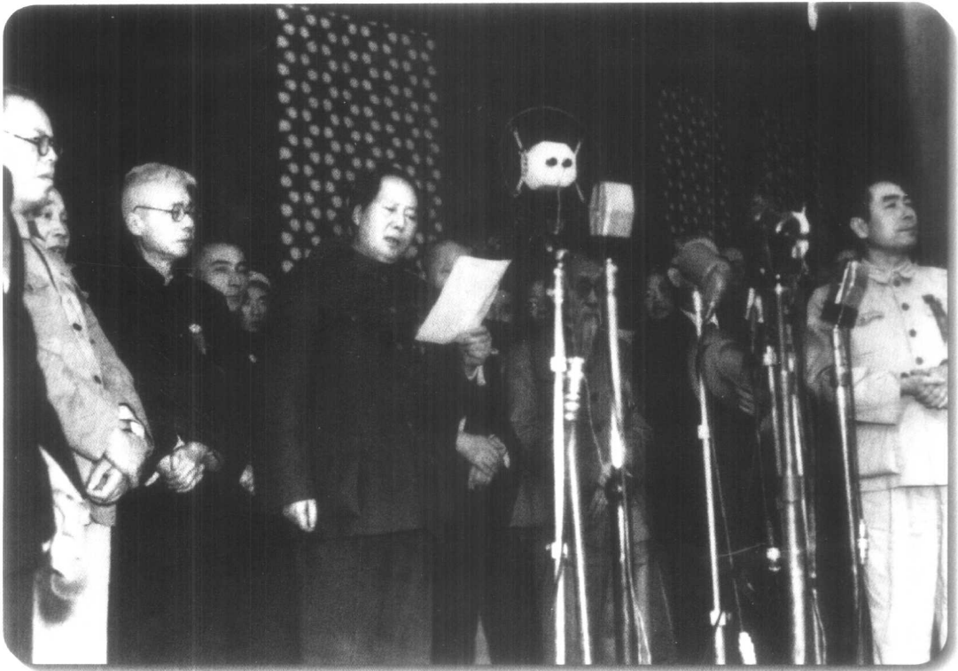
▲ 1949年10月1日，中华人民共和国开国大典在天安门广场隆重举行。毛泽东向全世界庄严宣告：中华人民共和国中央人民政府成立了！从此，揭开了中国工业发展的新篇章。