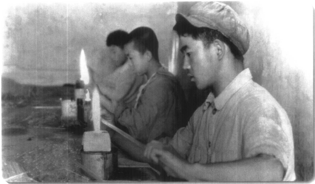
▲ 建国初期，手工操作场景。