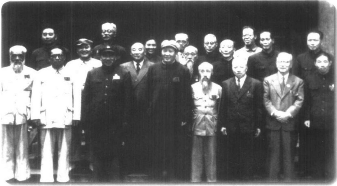
▲ 1949年9月17日，新政治协商会议筹备会第二次会议选举21人组成常务委员会，并决定将“新政治协商会议”改称“中国人民政治协商会议”。图为新选出的常务委员会委员合影。左起：谭平山、周恩来、章伯钧、黄炎培、林伯渠、朱德、马寅初、蔡畅、毛泽东、张奚若、陈叔通、沈钧儒、马叙伦、郭沫若、李济深、李立三、蔡廷锴、陈嘉庚、乌兰夫、沈雁冰。