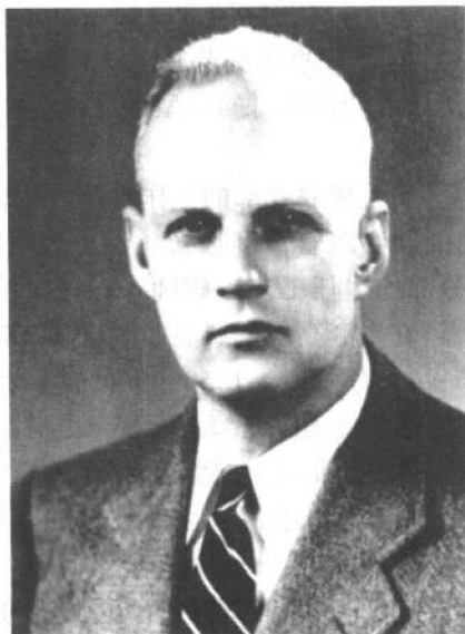
奥尔顿·爱德华·贝雷

奥尔顿·爱德华·贝雷 1907 年出生于美国得克萨斯州的中部,四十六年后逝世于田纳西州的孟菲斯。在其短暂的职业生涯中,贝雷在油脂科学技术上留下了无人比拟的足迹。在其众多成就中,传世之作——《贝雷:油脂化学与工艺学》无疑是最重要的。该书于 1945 年首次出版后,立即成为油脂工业的金科玉律,时至今日依然如此。为了纳入更新的科学发现和工程发展,在他去世后,该书也历经数次更新与增补。然而在详细阅读此书 1945 年第一版时,读者几