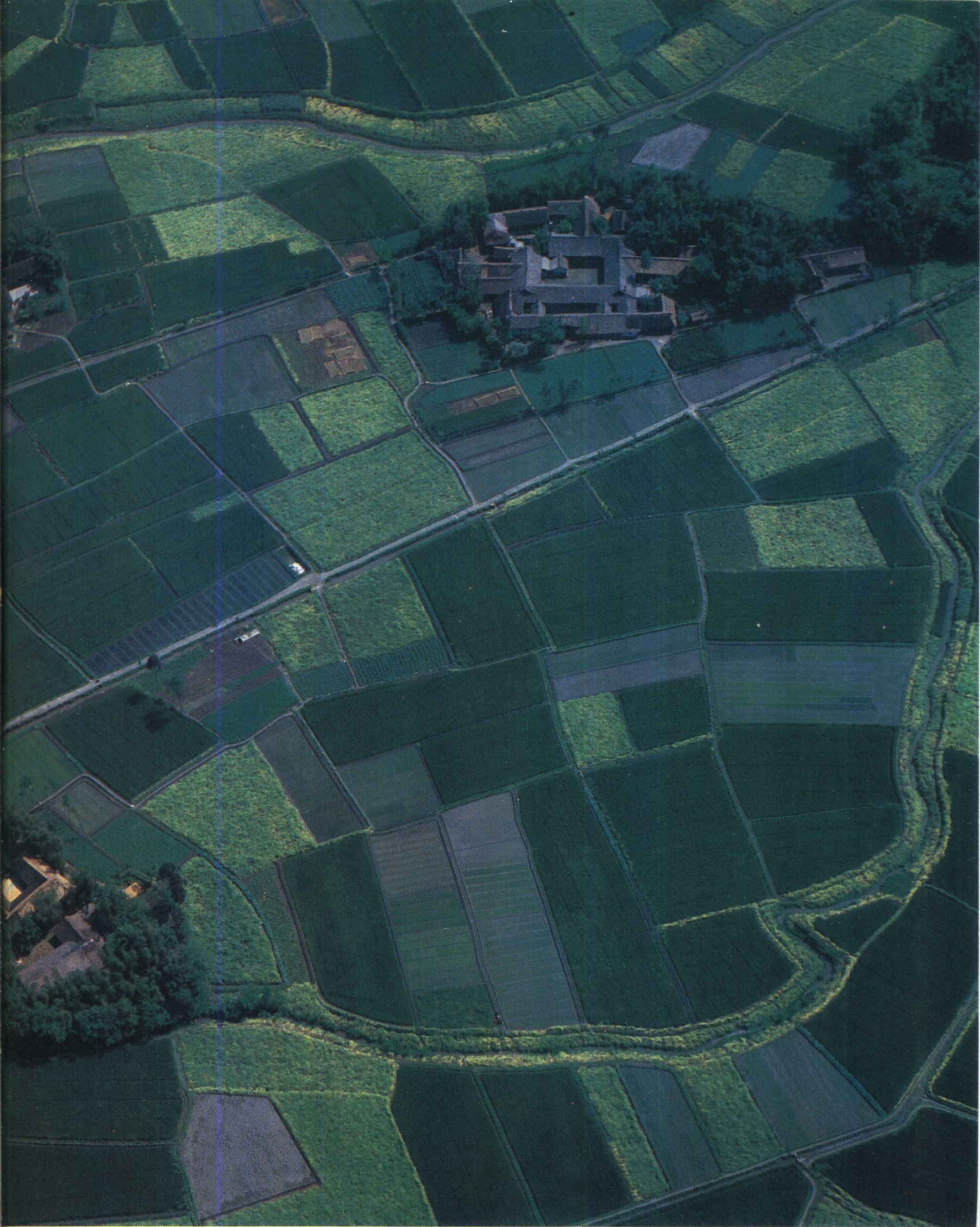
氣候溫和，土地肥美，物產豐富的天府之國。