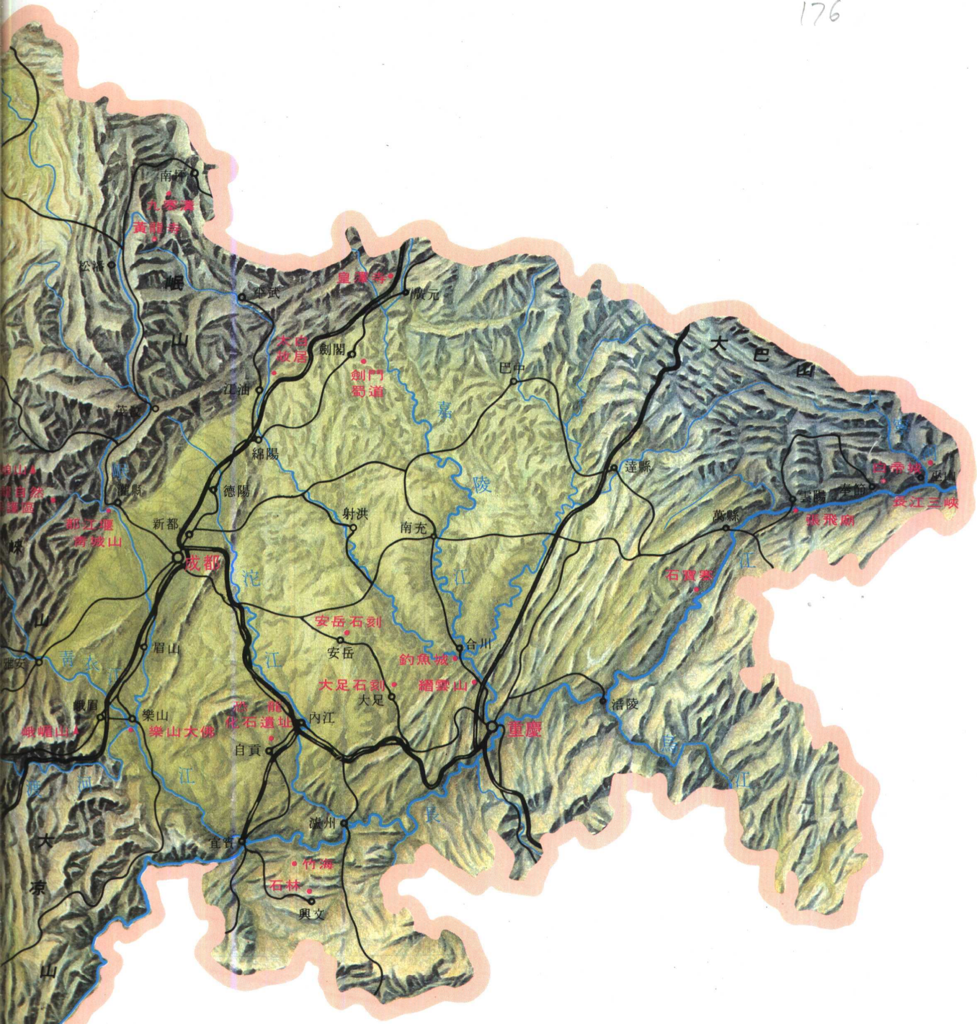
四川地圖 MAP OF SICHUAN