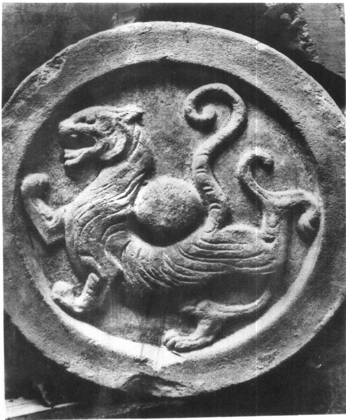
二 白 虎 瓦 當 ( 漢 )