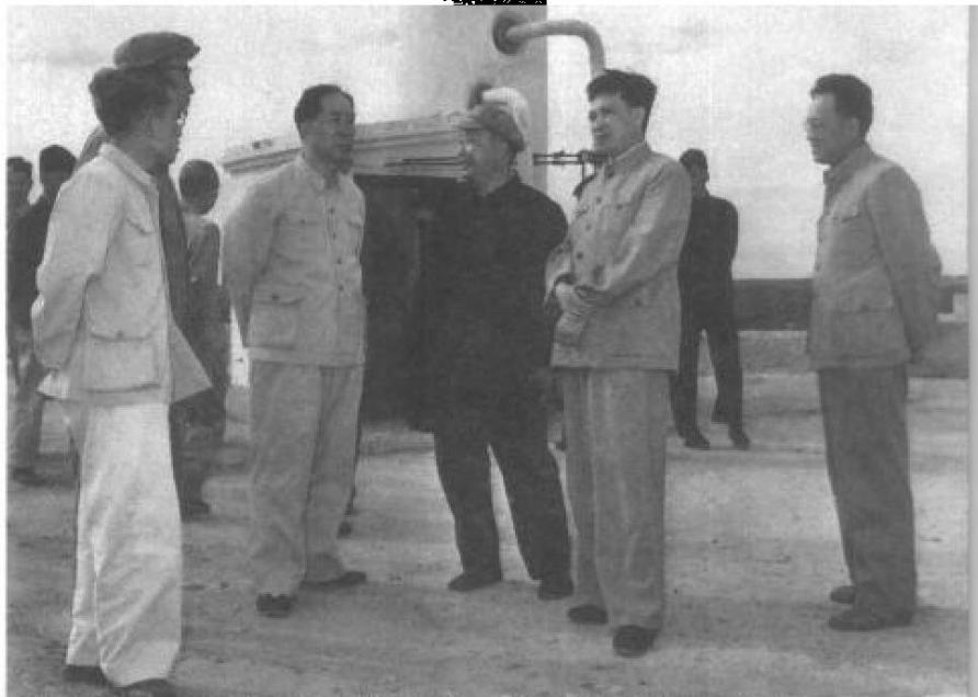
1964年在大庆。右二田家英、右四薄一波。