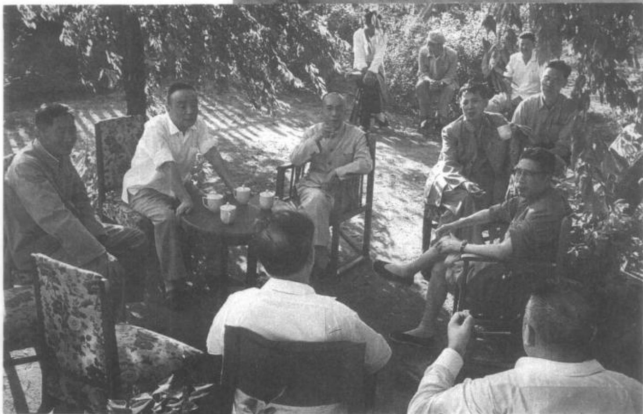
1964年在东北。第二排左二杨尚昆、左三李富春、左四田家英、左五宋任穷。