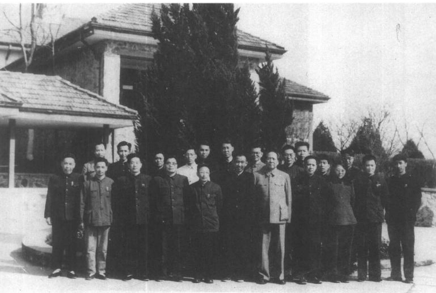
1962年3月在武昌，毛泽东同湖南调查组全体成员合影。 前排右起第四人为田家英、第六人为王任重。