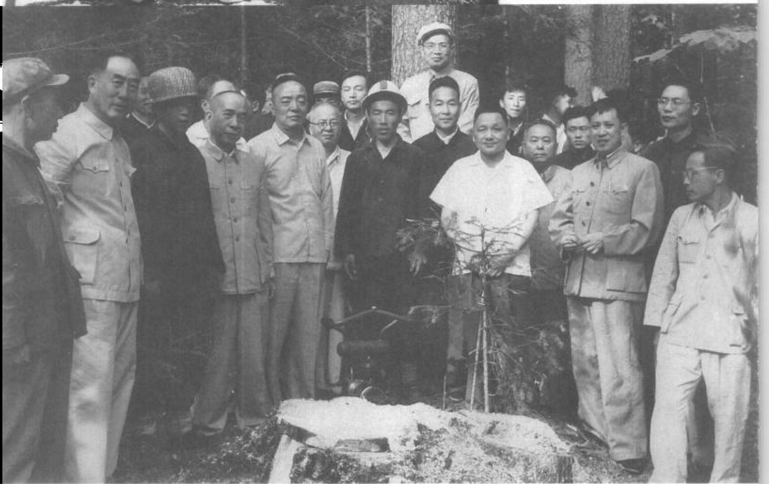
1964年夏，随同邓小平等参观东北林区。前排左二薄一波、左四李富春、左五杨尚昆、左七邓小平、左八田家英、后排中为吴晗。