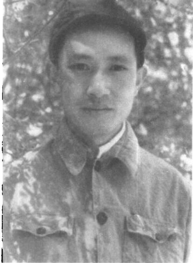
延安时期的田家英。