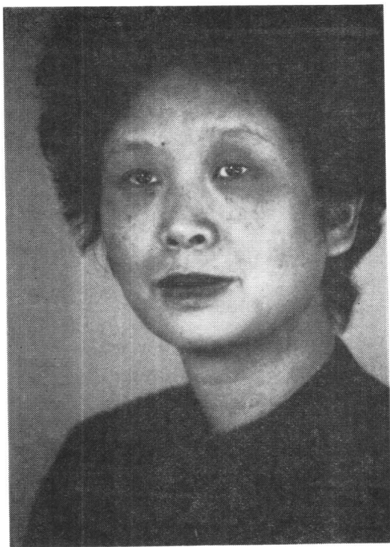
作 者 像