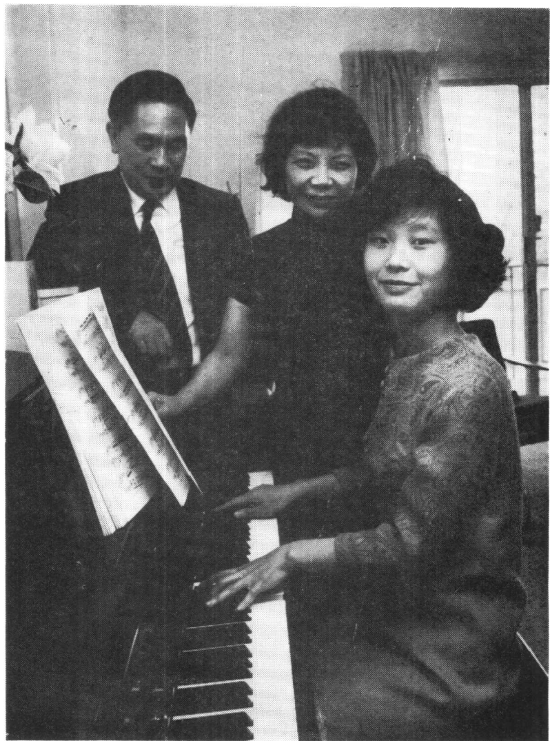
作者和她父母1967年摄于美国华盛顿