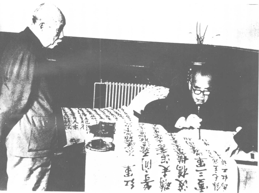
1965年4月，朱德为成都杜甫草堂书录毛泽东诗词。左为董必武。