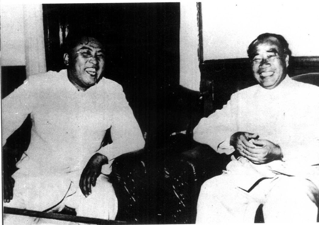
1955年8月，朱德率中国代表团参加朝鲜解放十周年庆祝活动。 图为朱德和朝鲜内阁首相金日成在一起。