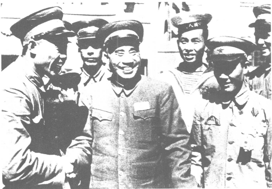
1950年9月，朱德和出席全国战斗英雄代表会议的代表们在一起。