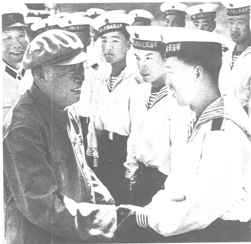
1974年8月，朱德视察河北秦皇岛海军基地时，与海军战士们在一起。