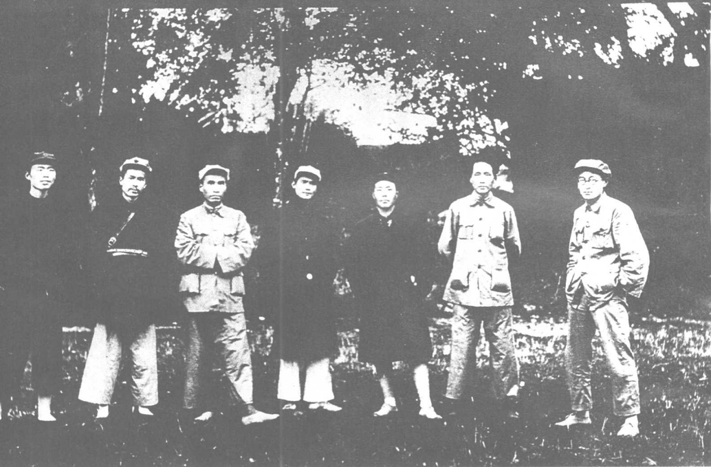
1931年1月15日，中共中央決定成立中共蘇維埃區域中央局。 圖為蘇區中央局成員在江西瑞金的合影。右起王稼祥、毛澤東、 項英、鄧發、朱德、任弼時、顧作霖。