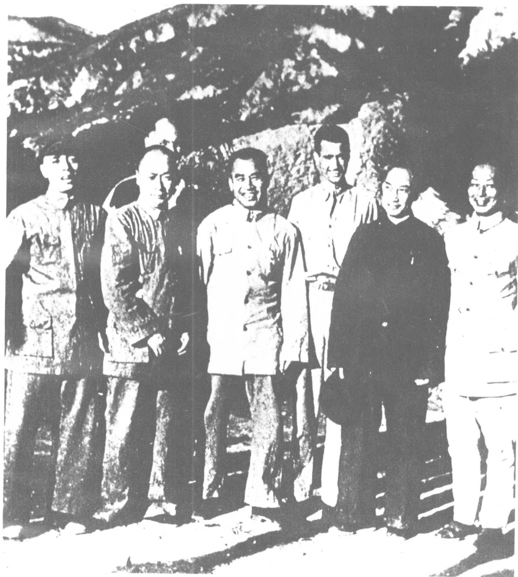
1944年7月，中缅印战区美军总司令史迪威派遣美军观察组赴延安考察。图为朱德等和美军观察组成员的合影。前排左起：杨尚昆、陈毅、朱德、吴玉章、聂荣臻；后排左起：惠特尔赛、谢伟思。