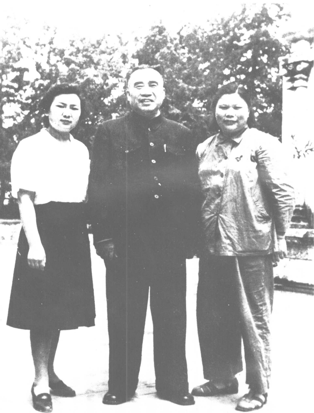
朱德和夫人康克清、女儿朱敏合影。