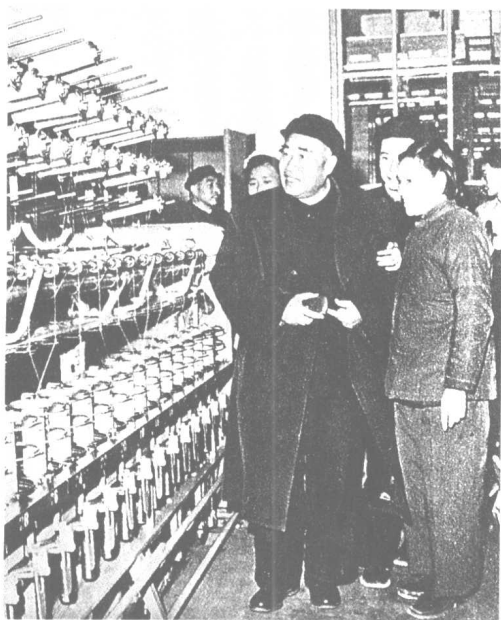
1959年11月，朱德视察北京合成纤维实验厂。