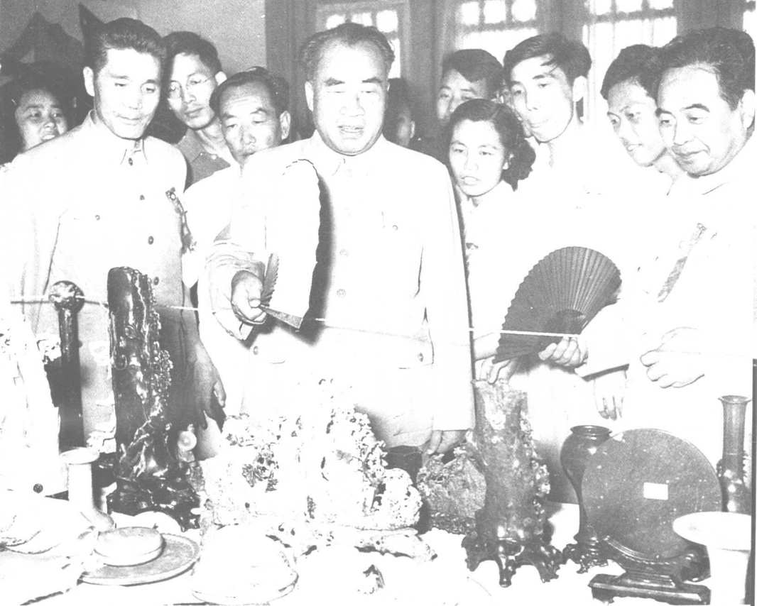
1957年12月，朱德在北海团城参观全国工艺美术品展览。