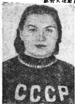
蘇聯選手羅馬什柯娃，世運女子擲鐵餅冠軍。成績是五十一·四二公尺，創造世界新紀錄。