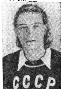
蘇聯選手朱迪娜，世運跳遠亞軍，創造奧林匹克新紀錄，成績五·七七公尺。