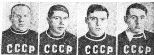
世運重鼈級 冠軍，蘇聯 角力選手。 柯特卡斯