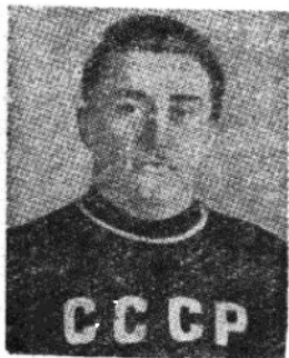
蘇聯選手齊密施基揚，世運羽量級舉重冠軍。打破了三項動作的世界紀錄，成績是三百三十七點五公斤。