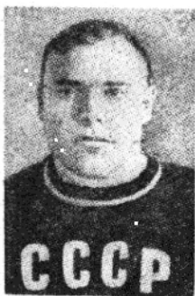
蘇聯選手羅瑪金，世運中量級舉重冠軍。他舉了四百十七點五公斤。