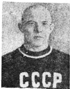
蘇聯選手薩克沙諾夫，世運毛量級亞軍。得銀質獎章一枚。