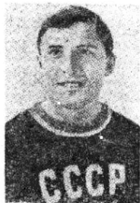
蘇聯選手謝巴可夫，世運三級跳遠亞軍，打破歐洲紀錄。