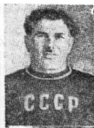
蘇聯選手麥科基施 維里，榮獲世運重 量級冠軍，得金質 獎章一枚。