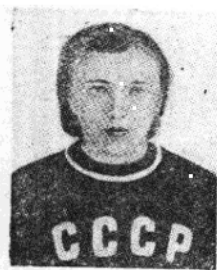
蘇聯選手齊賓娜，世運女子推鉛球冠軍。創造世界新紀錄，成績十五公尺二十八公分。