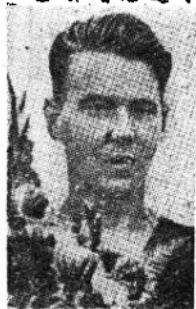
蘇聯划船選手邱卡洛夫(今年才二十二歲),在兩千公尺單人划船競賽中獲得冠軍,成績七分五十二·六秒,得金質獎章一枚。