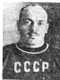
蘇聯選手齊馬庫 里，榮獲世運中量 級冠軍，得金質獎 章一枚。