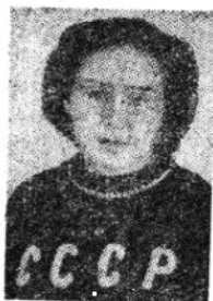
蘇聯選手巴格良且娃，世運女子擲鐵餅亞軍。得銀質獎章一枚。