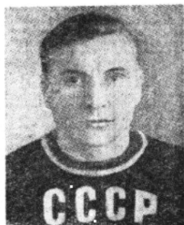
蘇聯選手烏岡多夫，世運毛量級舉重冠軍。打破了一項奧林匹克紀錄，他的三項動作成績是三百十五公斤。