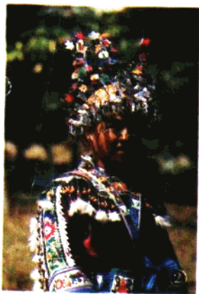
② 广西苗族妇女盛装