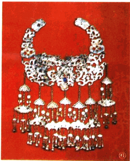
⑥湖南湘西凤凰县及贵州松桃县苗族银披肩