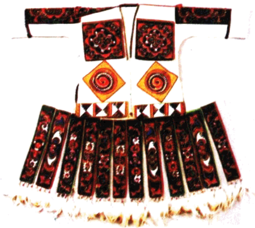
④贵州丹寨、榕江等县的苗族百鸟衣