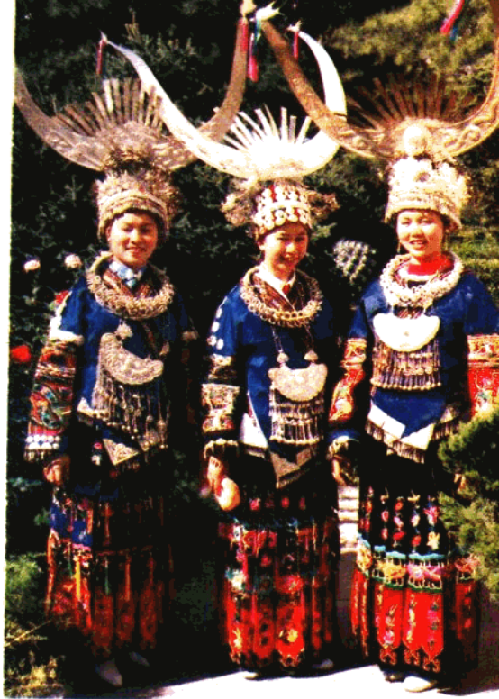
① 贵州黔东南 苗族妇女盛装