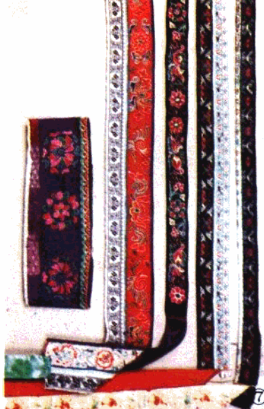
⑧ 贵州台江、雷山等地苗族衣袖花