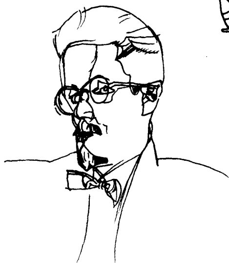
刘易斯作乔伊斯像