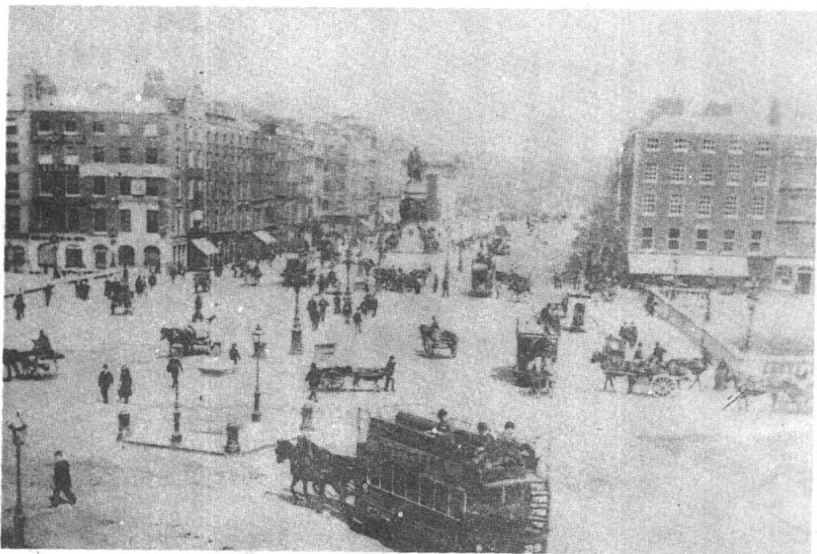
都柏林奥康纳大街