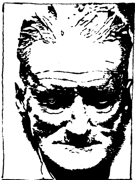
乔伊斯的蜡模遗容