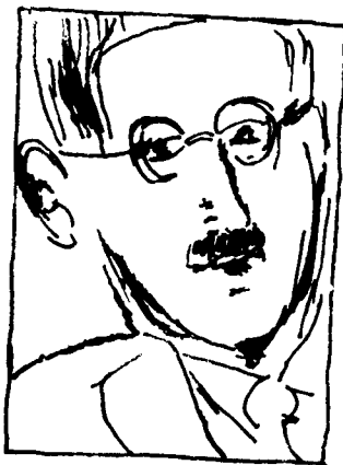
露西亚·乔伊斯作乔伊斯像