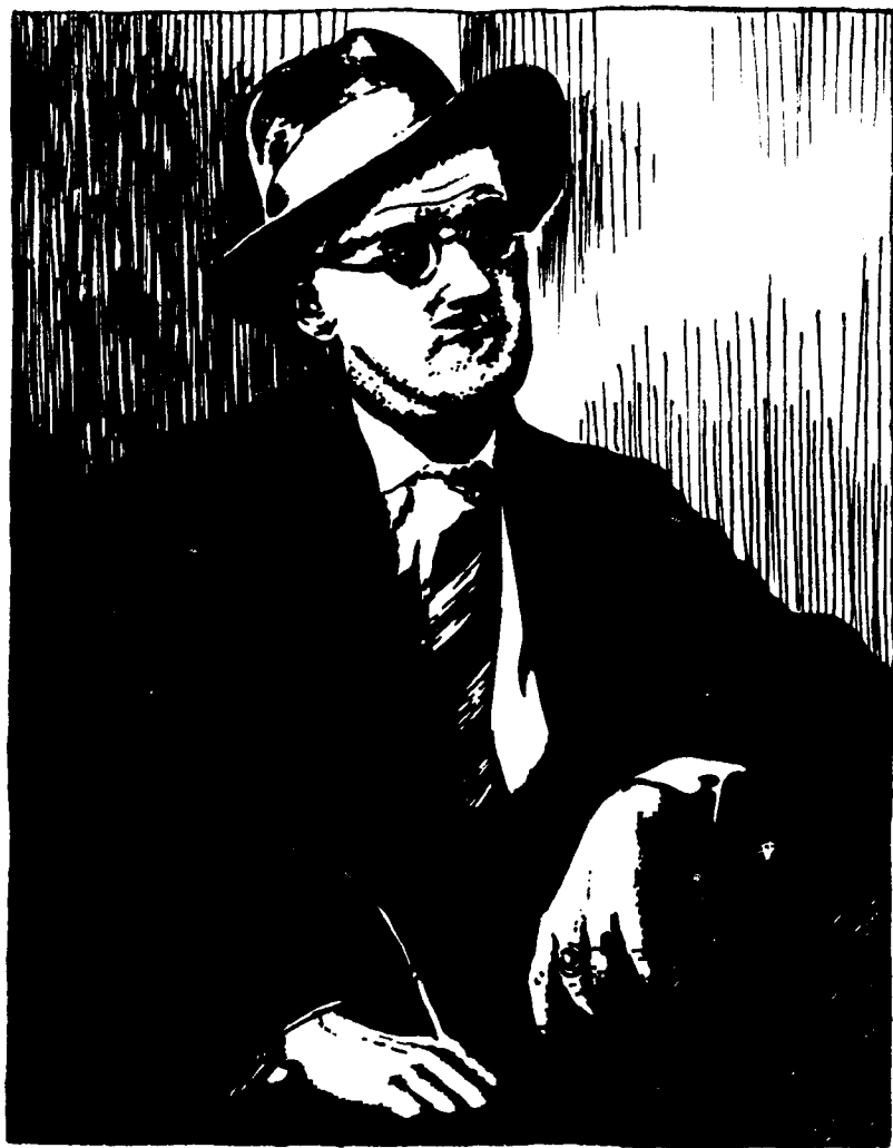
全盛时期的乔伊斯