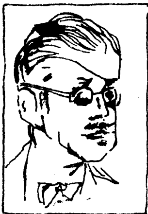
艾文·奥普弗作乔伊斯像