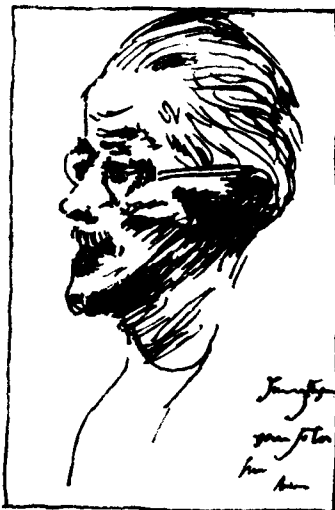
奥古斯塔斯·约翰作乔伊斯像