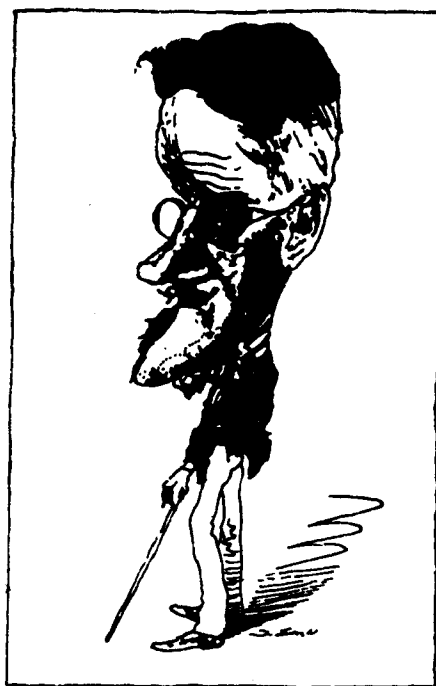
戴卫·列文作乔伊斯漫画像