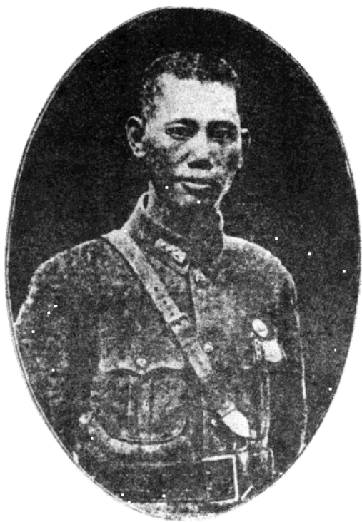
淞沪抗战时的蔡廷锴将军 (1932年)