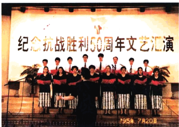
国库司在总行举办的“纪念抗战胜利 50 周年文艺汇演”上演出小合唱