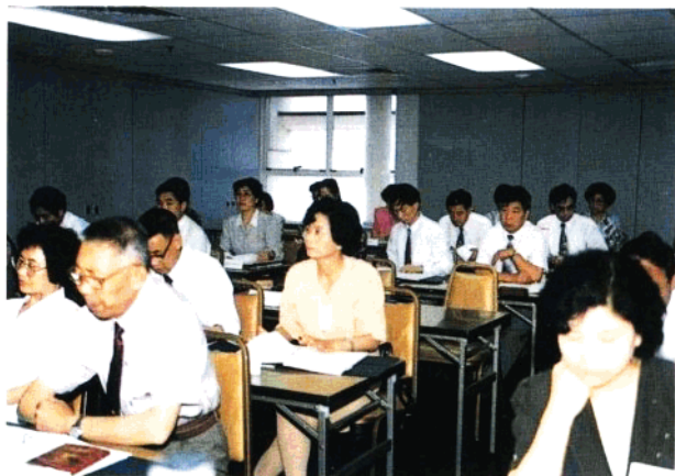
在香港国际会计与国库管理研修班上