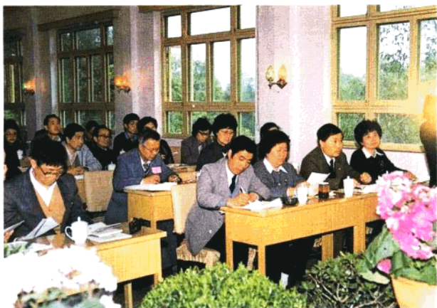
1989年各省国库处长在无锡召开的全国国库工作会上