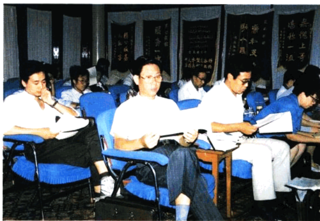
各位代表在新疆国库研讨会上(1991年)