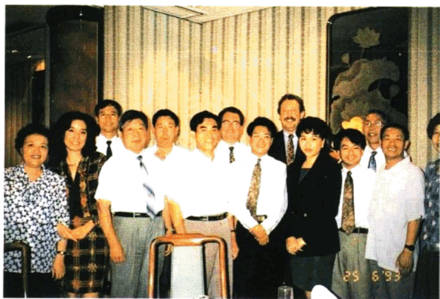
在香港国际会计与国库管理研修班上与香港同业专家合影