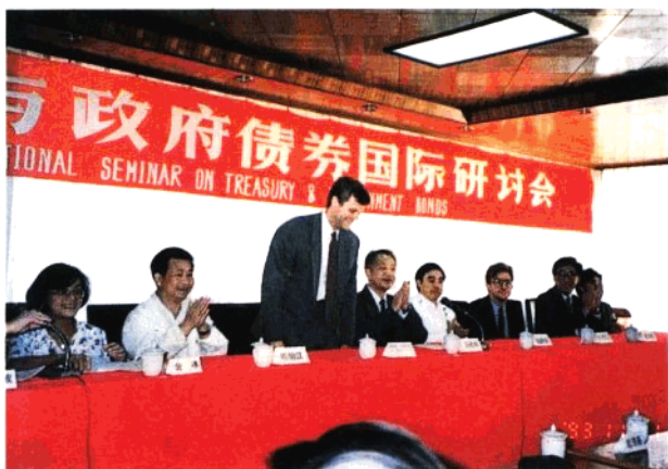
开展国际交流活动