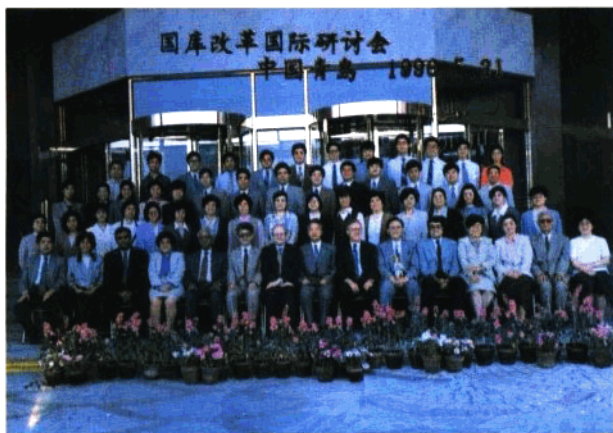
黄掘卿司长与财政部领导在国库会议上