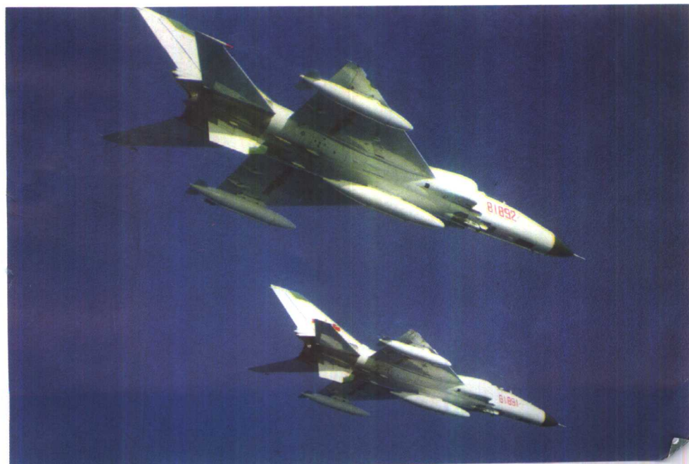
歼 8- II