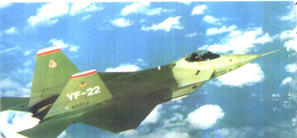
美国 YF-22 战斗机