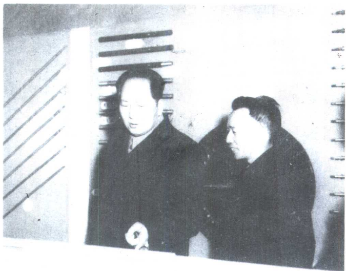
1955年初，陪毛主席在中南海瀛台参观纺织工业展览。