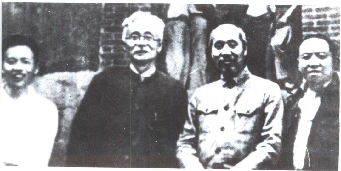
1944年林伯渠到重庆谈判。左起：钱之光、林伯渠、董必武、王若飞。