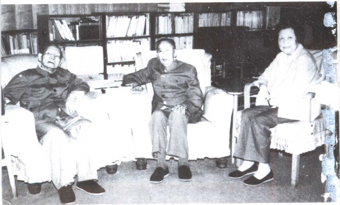
1993年7月，在中南海陈云家中。