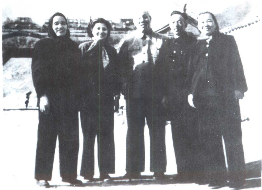
1954年在居庸关。左起：何莲芝、刘昂、董必武、钱之光、张琴秋。