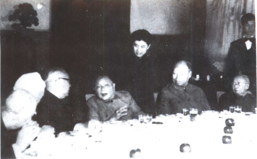
1985年，与邓小平、李先念、彭真在一起。右一为钱之光。