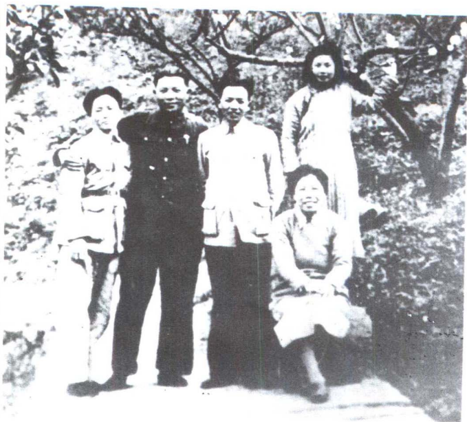
1939年，在重庆红岩。 左起：童小鹏、岳仁和、 钱之光、邓颖超。