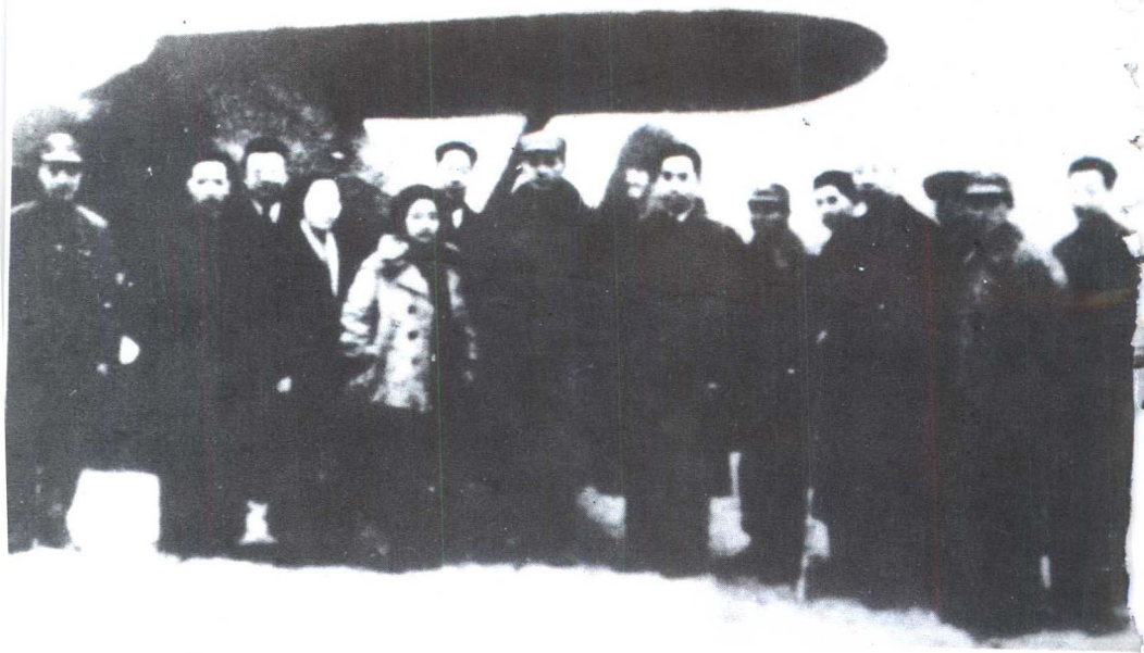
1941年皖南事变后，送叶剑英回延安。