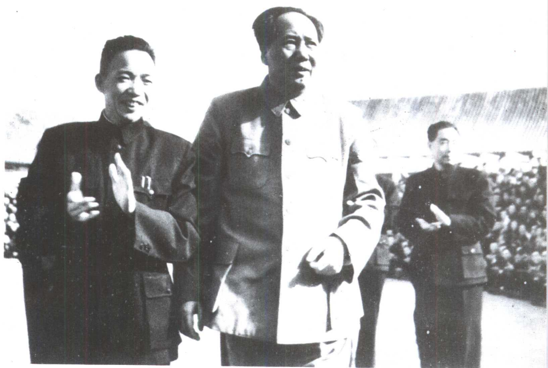
1956年，陪毛主席、周总理等领导接见纺织工业先进工作者。