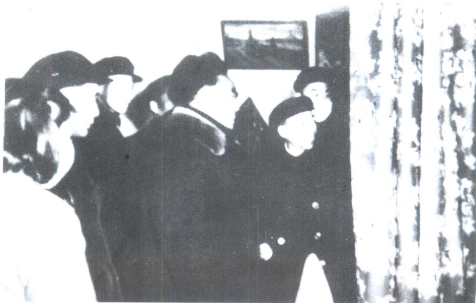
1954年底，陪朱德在中南海瀛台参观纺织工业展览。