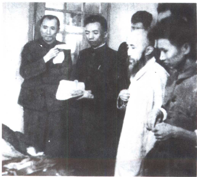
1945年10月，钱之光在重庆陪沈钧儒到医院与李少石遗体告别。