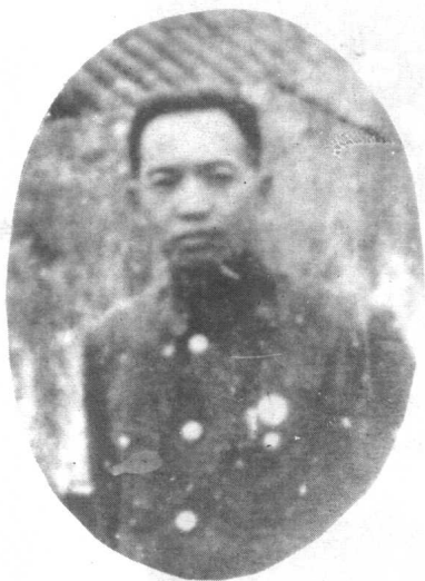
1938年在武汉八路军办事处。