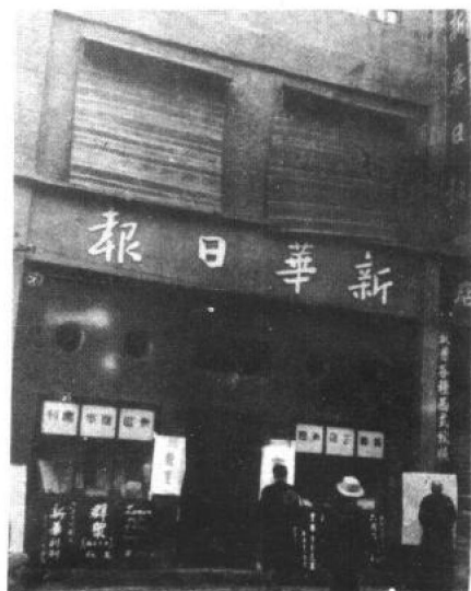
重庆民生路营业部