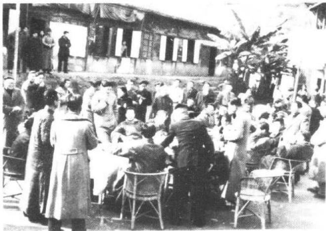
创刊四周年， 各界友好来报馆祝 贺联欢