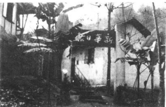
重庆化龙桥新华日报馆大门