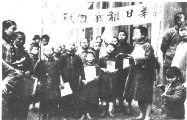
重庆市儿童在街头 义卖新华日报向前 线抗日将士献金