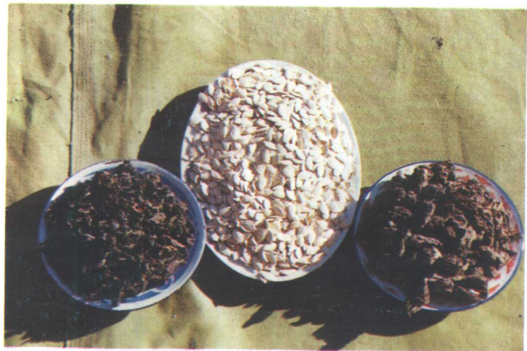
名特产品——白瓜子 细木耳 羊肚菌