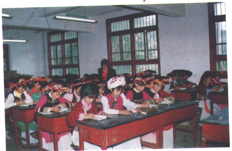
县民族中学女子班