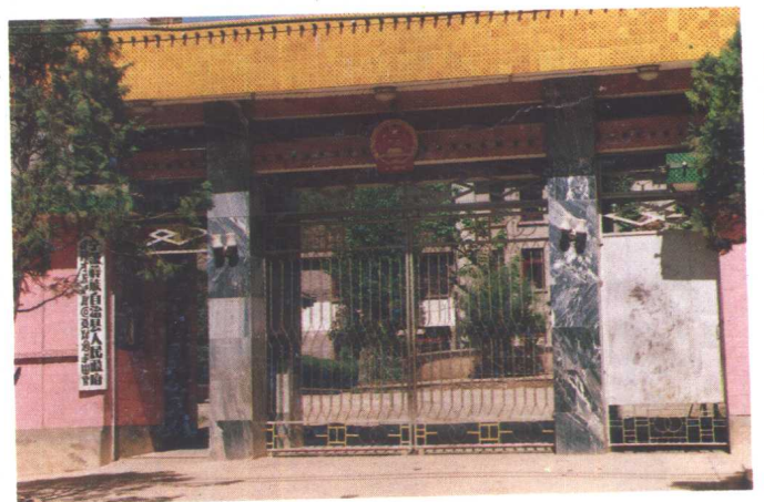
自治县人民政府驻地