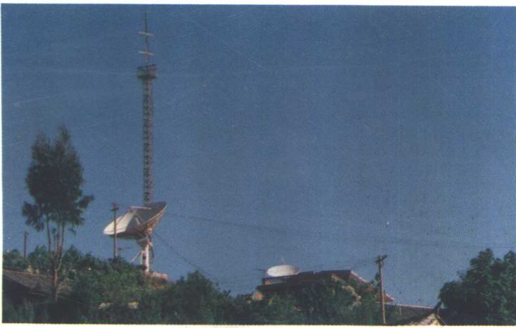
电视卫星地面接收站