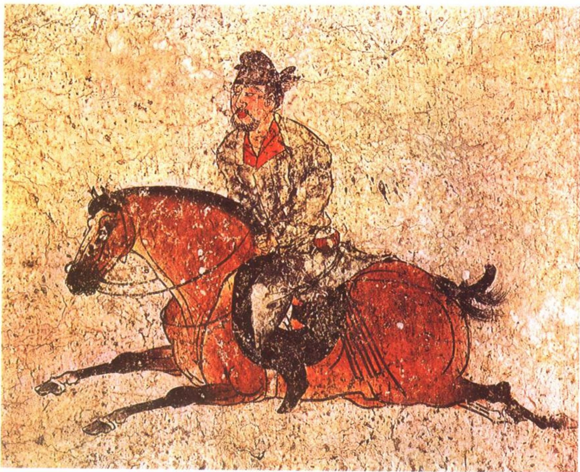
图2. 陕西省乾陵李贤墓室壁画《马球图》局部

公》)。卷轴画唐代周昉《挥扇仕女图》，以精细入微的线条刻画画面人物、道具等，尽显骨法用笔的传神写貌之能事，赋色柔丽，橙黄、石青、石绿等颜色交相辉映，浓艳而不俗，透明色与不透明色相映成趣。“重彩”方法也被用于山水画、花鸟画的创作中。宋代青绿山水的杰出巨制《千里江山图》，全图在笔墨方面采用传统的勾勒法精细地描绘了浩瀚的江水和人物、屋宇、树木、飞鸟、桥梁、舟船等，在色彩上继承了传统的青绿山水的表现手法并加以发展，用浓重鲜艳的青绿重色、赭石色及其它颜色描绘了祖国河山的壮丽雄伟、灿烂辉煌的景象。如果没有这些绚丽的色彩，作品的面貌将会是另一种情形。其他作品如图2陕西省乾陵李贤墓室壁画《马球图》局部、图3清代虚谷《无量寿佛》、图4任伯年《苏武牧羊》等，情形也是