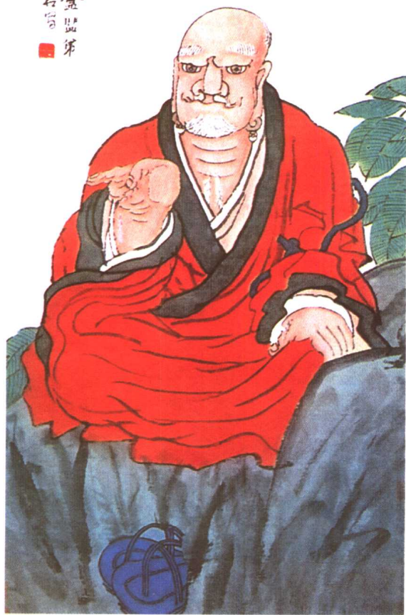
图3. 清代虚谷《无量寿佛》。人物造型古朴、勾勒用笔圆浑稳健，与石地用笔形成对比。脸及手用赭石着色且略有分染，服饰以朱砂上色平涂而不破坏墨线，背景树叶色彩冷暖有变化。