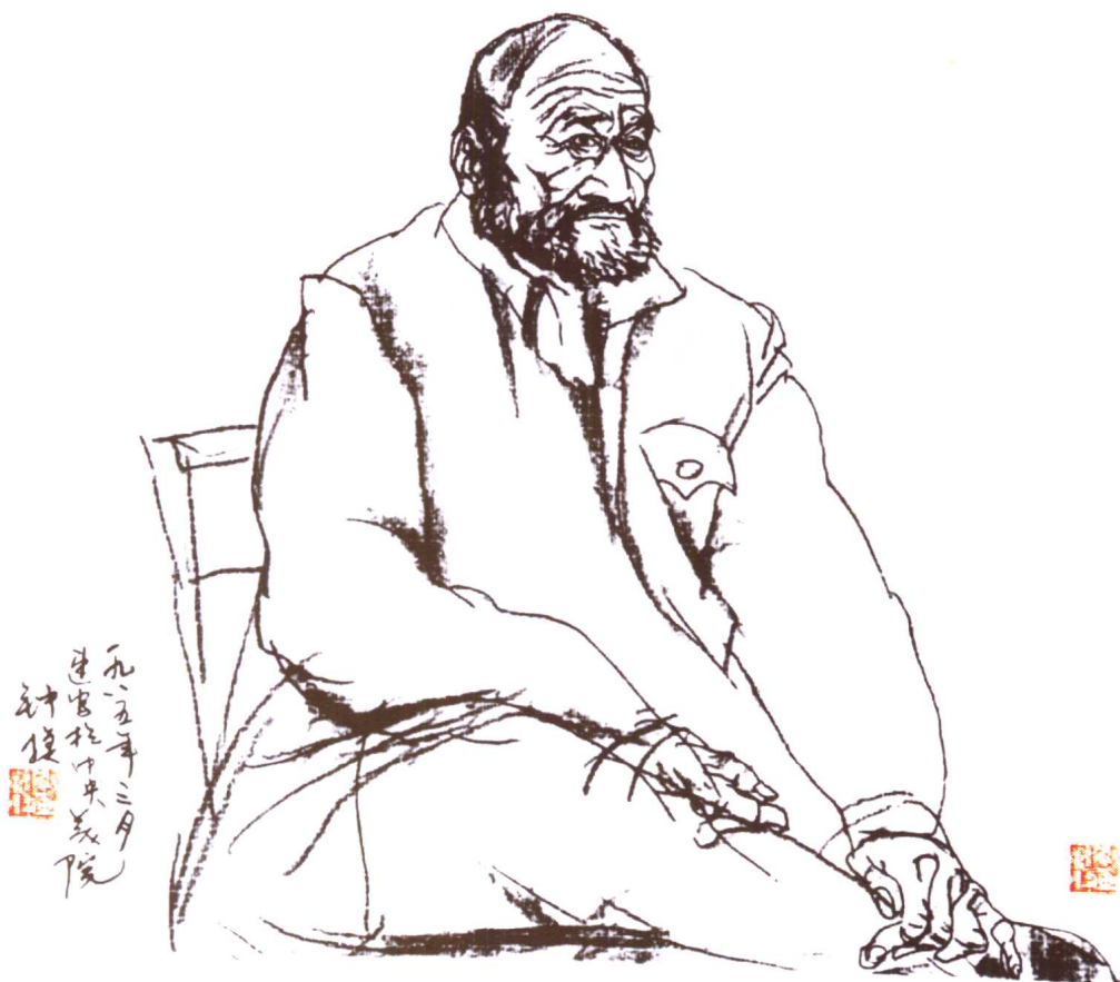
图10. 速写作品《老人写生》50 × 50(cm)。“以线造型”的意识要在平时的训练中得到强化。虽是速写，也不可只求“速”而忽视认真地“写”。