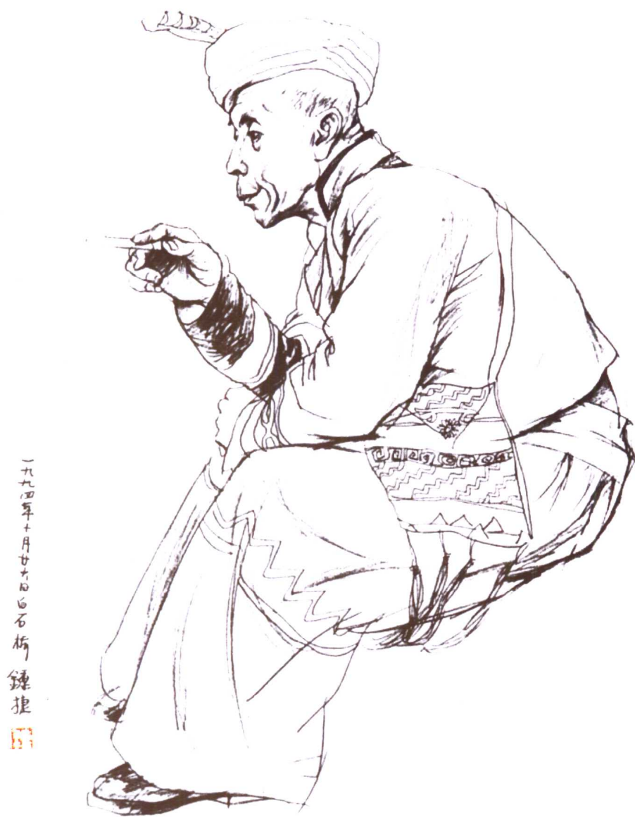
图12. 《老人速写》55 × 80(cm)。在进行人物动态透视较大的写生时要把握住局部与整体的关系，画面刻画要有重点。