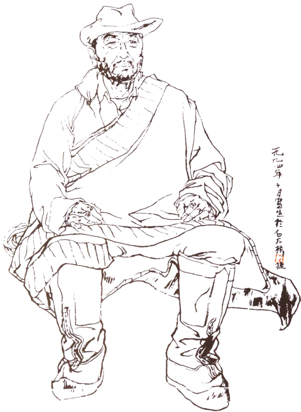
图5. 《藏民线描写生》55 × 78(cm)。以形写神，在充分地认识对象内在结构的基础上，主观地用墨线条塑造形象(不着颜色)，表现形象的本质，并在塑造中体现出线条的各种表现力。