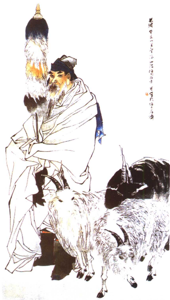
图4. 任伯年《苏武牧羊》。图中以凝重端庄的笔墨刻画了坚守民族气节的英雄人物苏武的形象，设色沉稳。