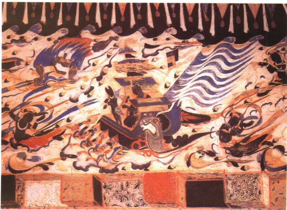
图1. 敦煌莫高窟第305窟隋代壁画《帝释天·东王公》

用赤铁矿作颜料,把部分装饰品涂成红色以增强美观。河南临汝阎村出土的新石器时代的“鹳鱼石斧”纹彩陶缸以刚柔互用的笔致,根据不同的内容和要求表现对象,或用浓重的黑线条勾勒,或直接着色没骨涂染,造型意趣横生。我国历史上唐宋以前的人物画很多是采用重彩双勾手法,达到画面色彩艳丽的效果,其勾勒线条的笔法变化都不是很大。敦煌莫高窟等石窟壁画及古墓室壁画也大都采用勾线加重彩着色手法绘制(见图1敦煌莫高窟第305窟隋代壁画《帝释天·东王