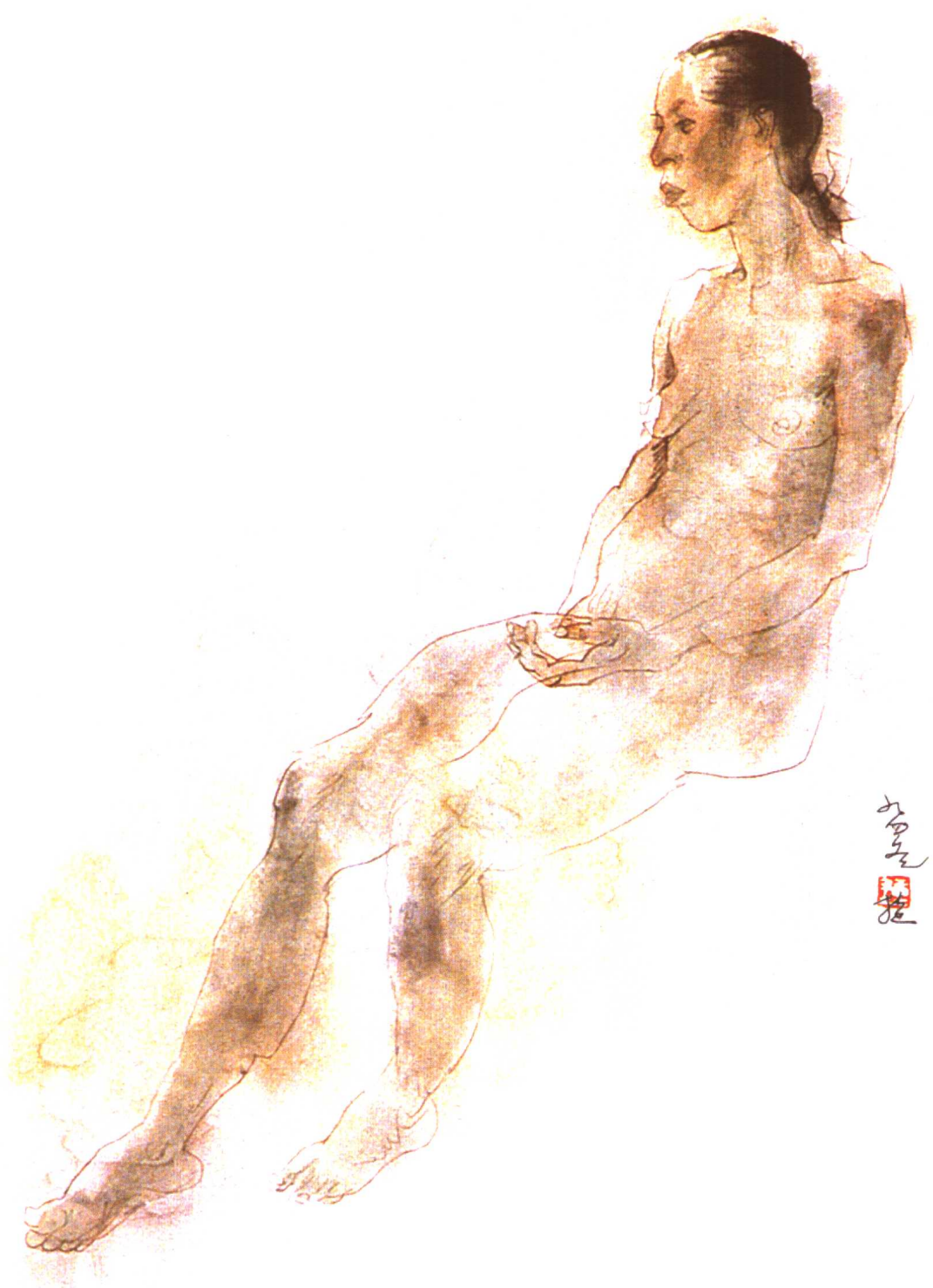
图9. 《女人体写生》50 × 68(cm)