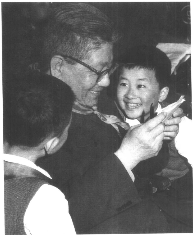
冯至与儿童们在一起