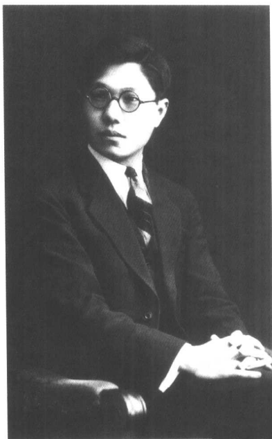
冯至在德国海 德堡(1930年)