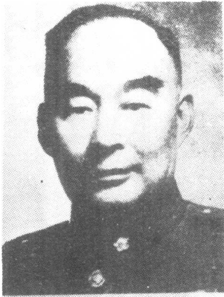
国民党西安绥靖公署 主任胡宗南。