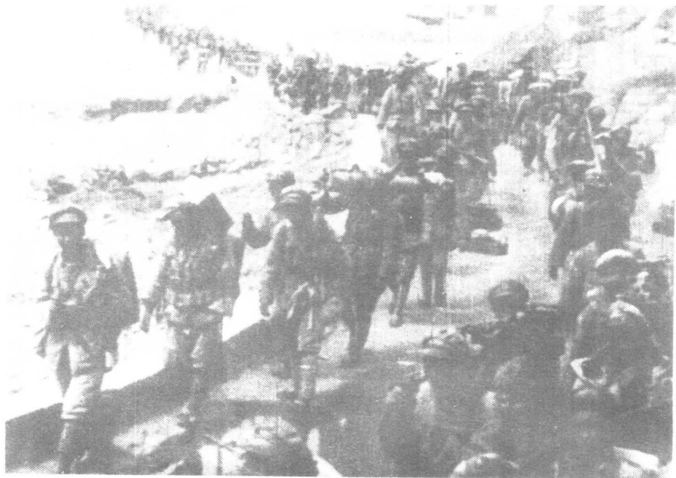
1947年3月13日，胡宗南发动数十万大军向延安进犯。