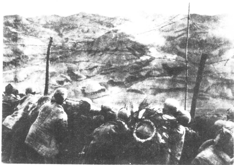
蟠龙战役中的积玉山战斗。