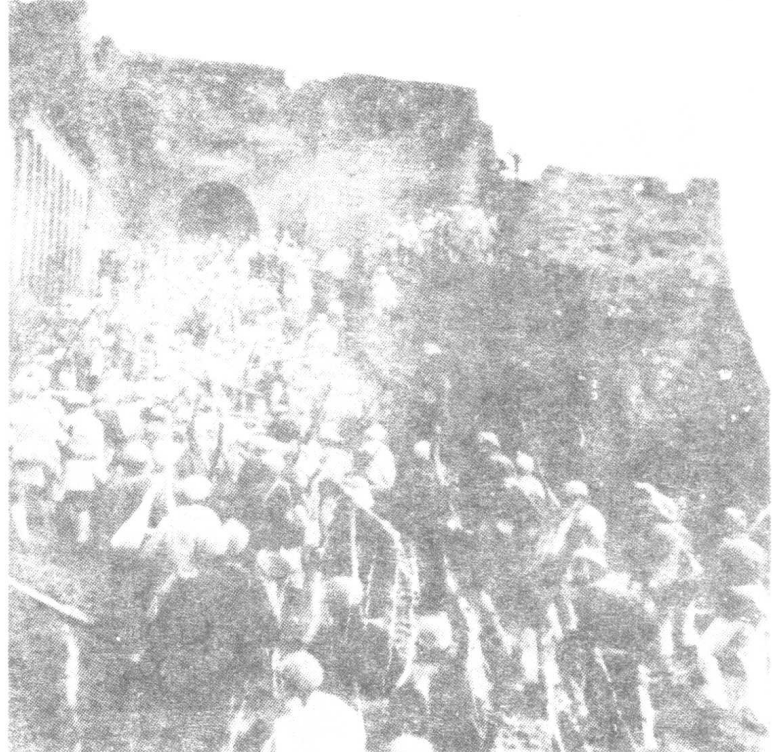
1947年10月， 延清战役中，解 放军攻进清涧城。