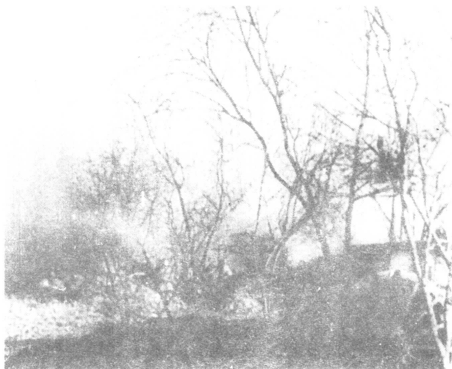
1948年3月，瓦子街战斗中，解放军的炮兵。