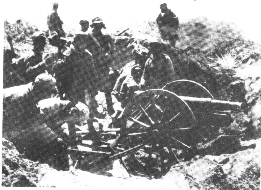
1947年5月，蟠龙战役中被解放军缴获的山炮。