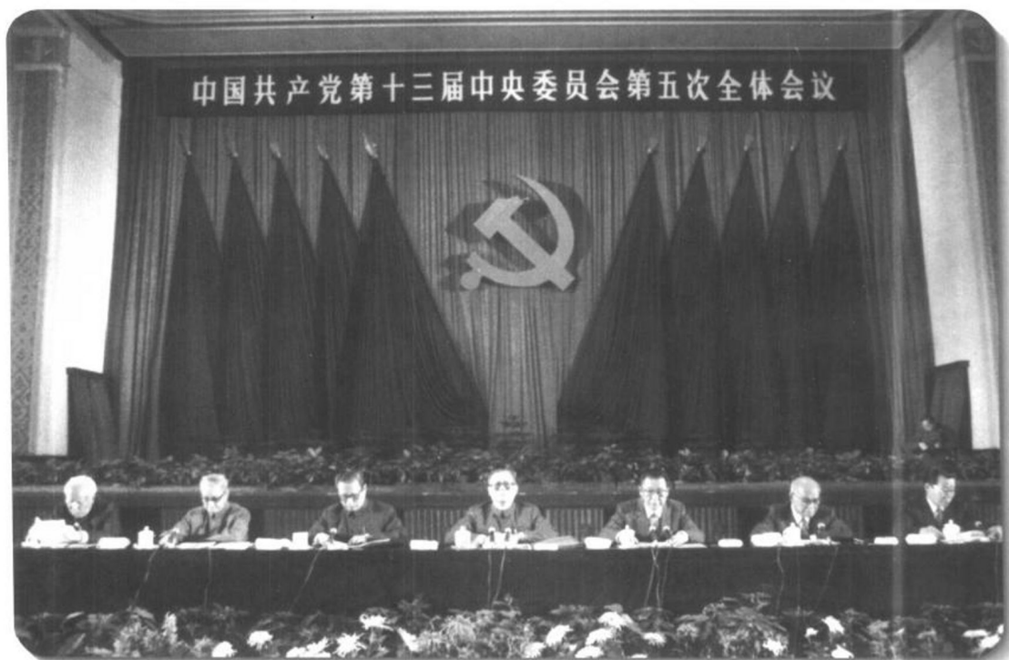
▲ 1989年11月6日至9日召开的中共十三届五中全会作出了《关于进一步治理整顿、深化改革的决定》，中国经济在治理整顿中继续发展。