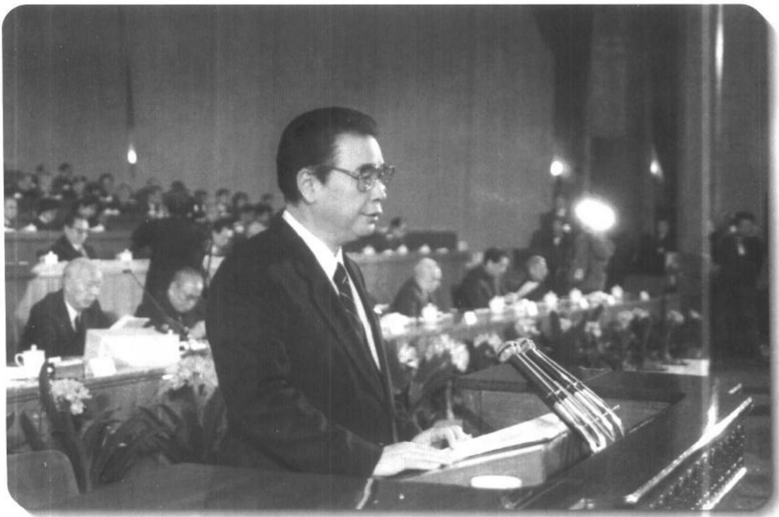
▲ 1991年3月25日，七届全国人大四次会议在北京人民大会堂隆重开幕。国务院总理李鹏在大会上作《关于国民经济和社会发展十年规划和第八个五年计划纲要的报告》。