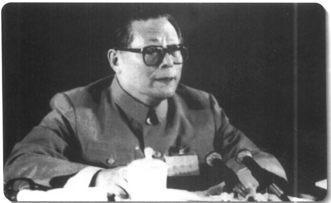
▲ 1989年6月23日至24日在北京召开的中共十三届四中全会，选举江泽民为中央委员会总书记，确立了以江泽民为首的新的中央领导班子。图为江泽民在十三届四中全会上讲话。