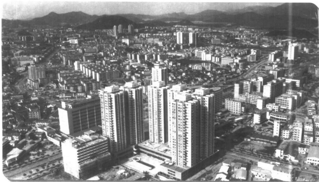
▲ 1980年8月，全国人大常委会批准在深圳、珠海、汕头、厦门四个城市兴建经济特区。在中国现代化建设中，经济特区起着对外开放的窗口及试点作用，获得了很大的成功。深圳特区是中国创办的第一个经济特区。图为深圳新貌。