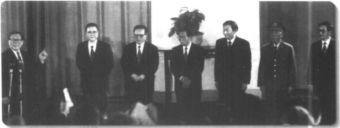
▲ 中国共产党第十四次全国代表大会于1992年10月12日至18日在北京召开。大会确立了邓小平“建设有中国特色的社会主义”理论在全党的指导地位；在总结14年改革经验的基础上，明确提出了建设社会主义市场经济的目标；大会顺利实现了党的第二、三代领导核心的正常交替。图为十四大新当选的中共中央政治局常委。左起江泽民、李鹏、乔石、李瑞环、朱镕基、刘华清、胡锦涛。