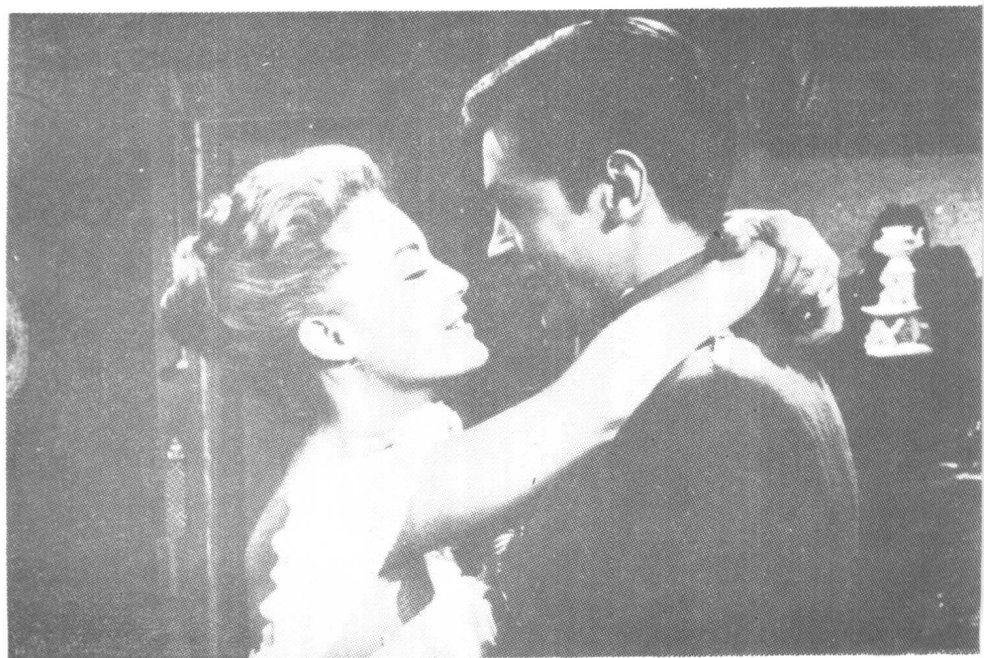
影片《花月断肠时》，与罗蜜·施奈德合拍