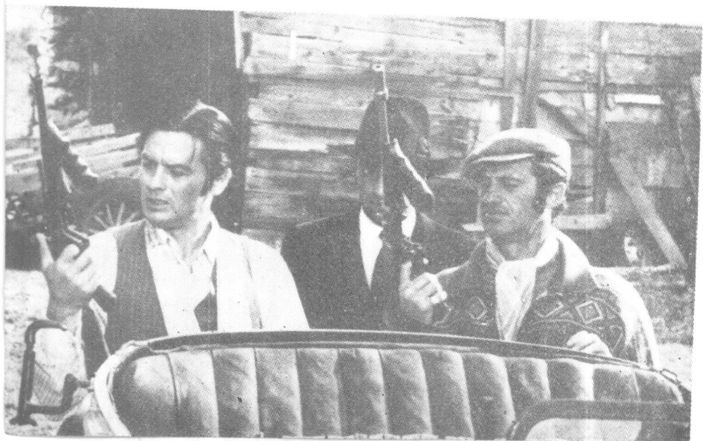
影片《博尔萨利诺》与 让-保尔·贝尔蒙多合拍