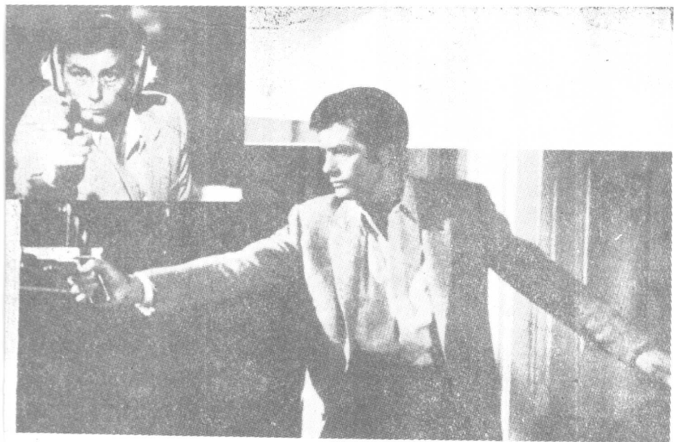
影片《披着警察外衣的人》