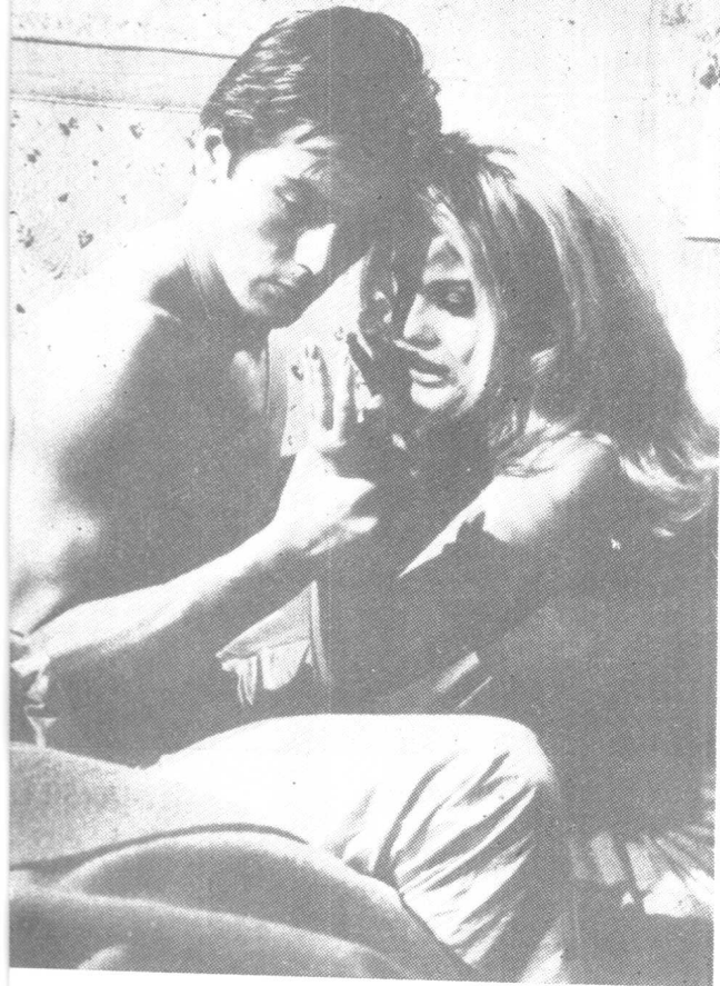
影片《旧金山的杀手》， 与好莱坞影星安娜·玛格雷 合拍