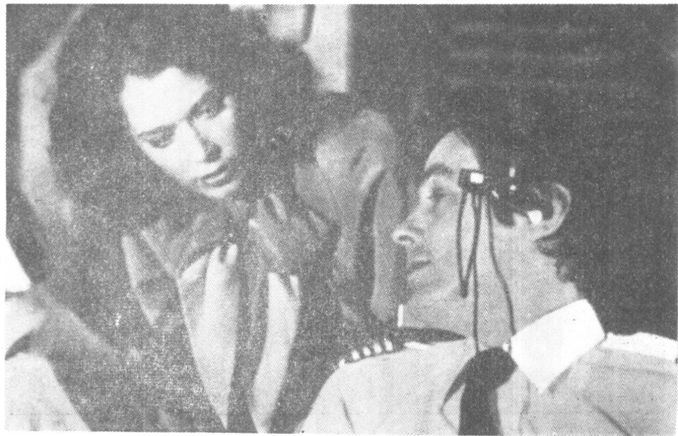
影片《协和飞机空难记》