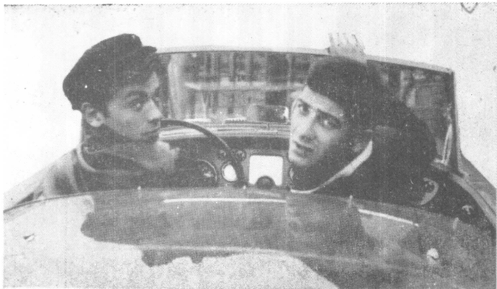
阿兰·德隆和他的朋友布里亚利在去戛纳的路上