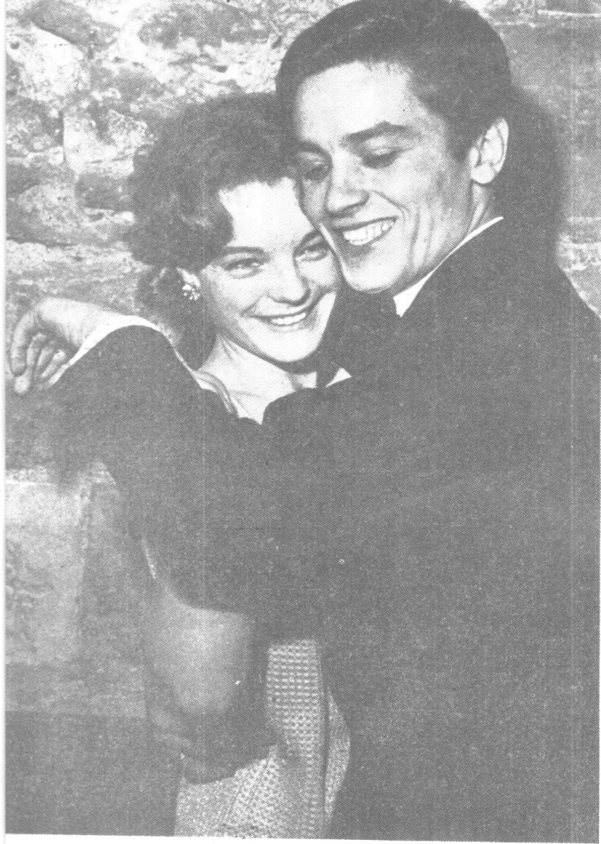
与罗蜜·施奈德订婚