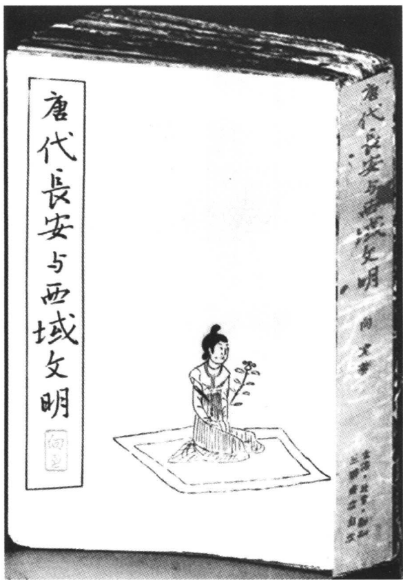
《唐代长安与西域文明》 三联书店 1957 年版书影