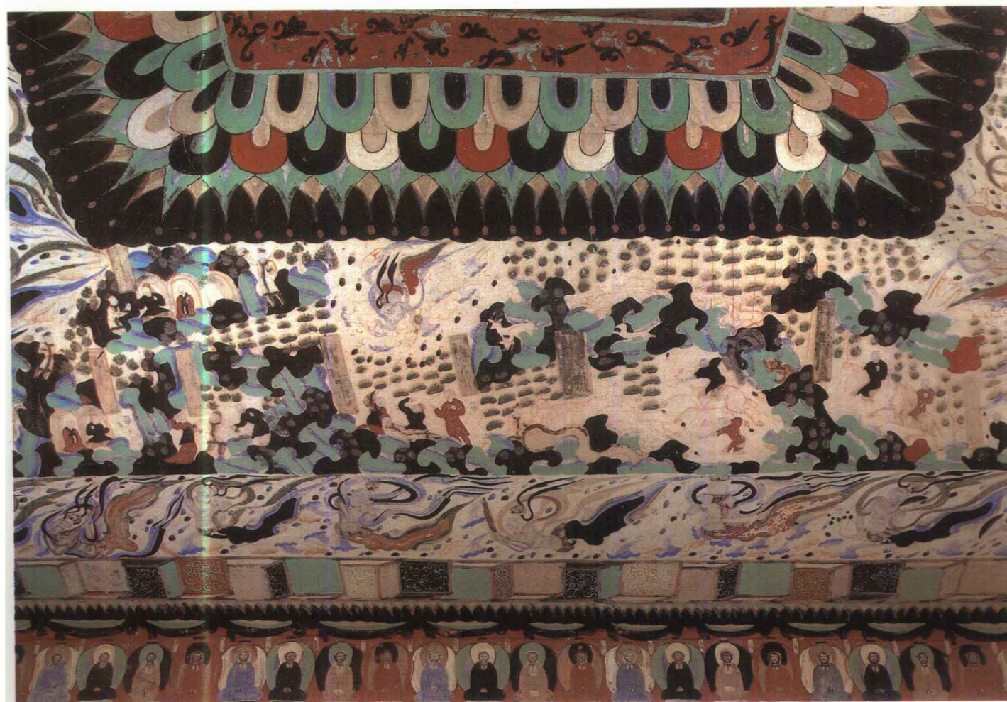
3 第301窟 窟顶北披 睒子本生 北周末隋初