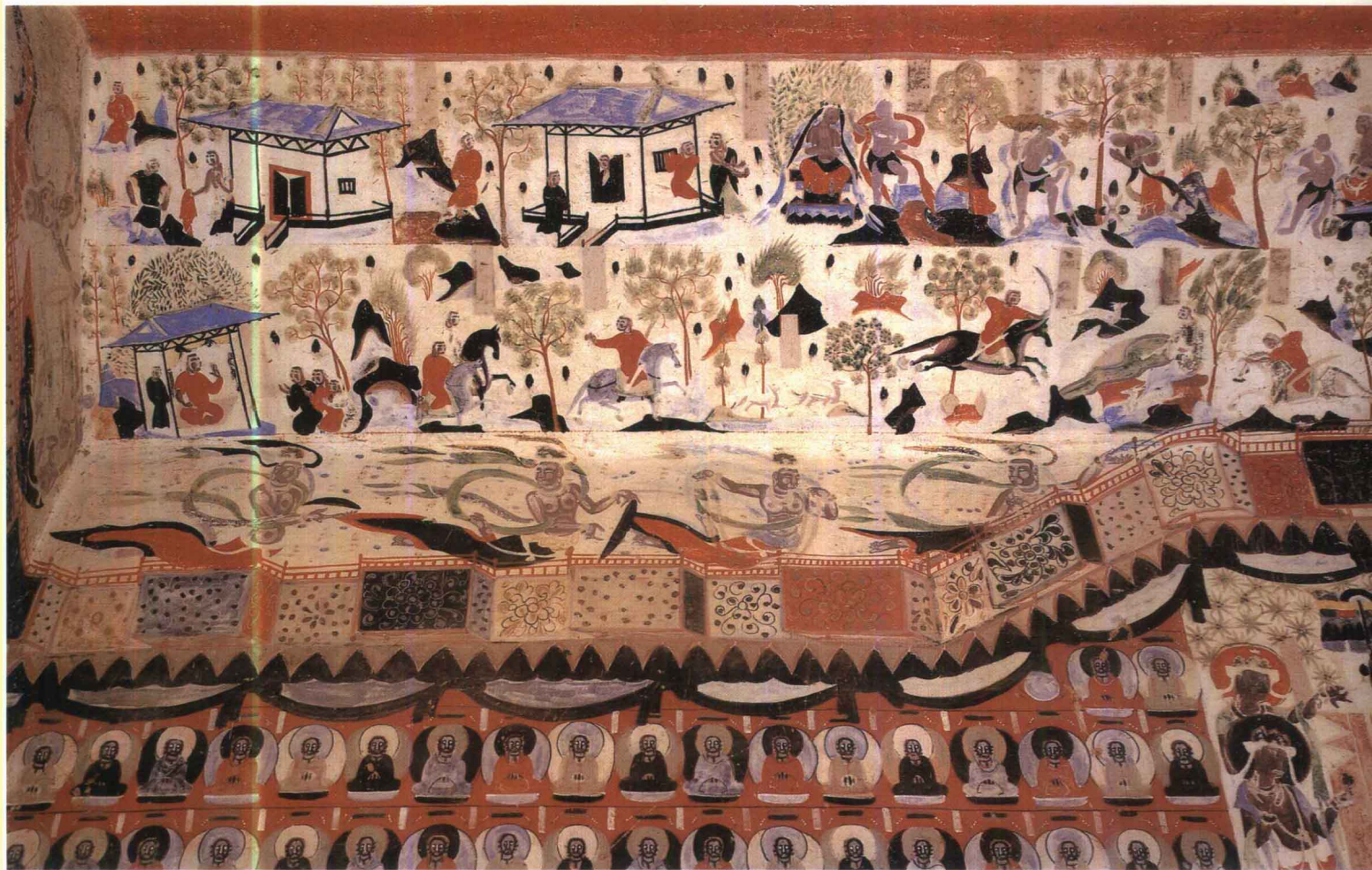
9 第302窟 人字披顶东披 隋