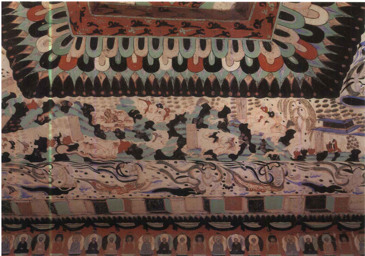
4 第301窟 窟顶南坡 萨埵太子本生之一 北周末隋初