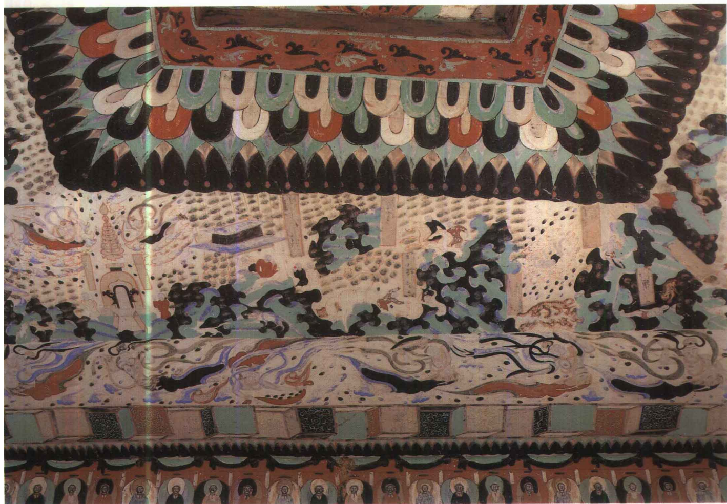
2 第301窟 窟顶东披 萨埵太子本生之二 北周末隋初