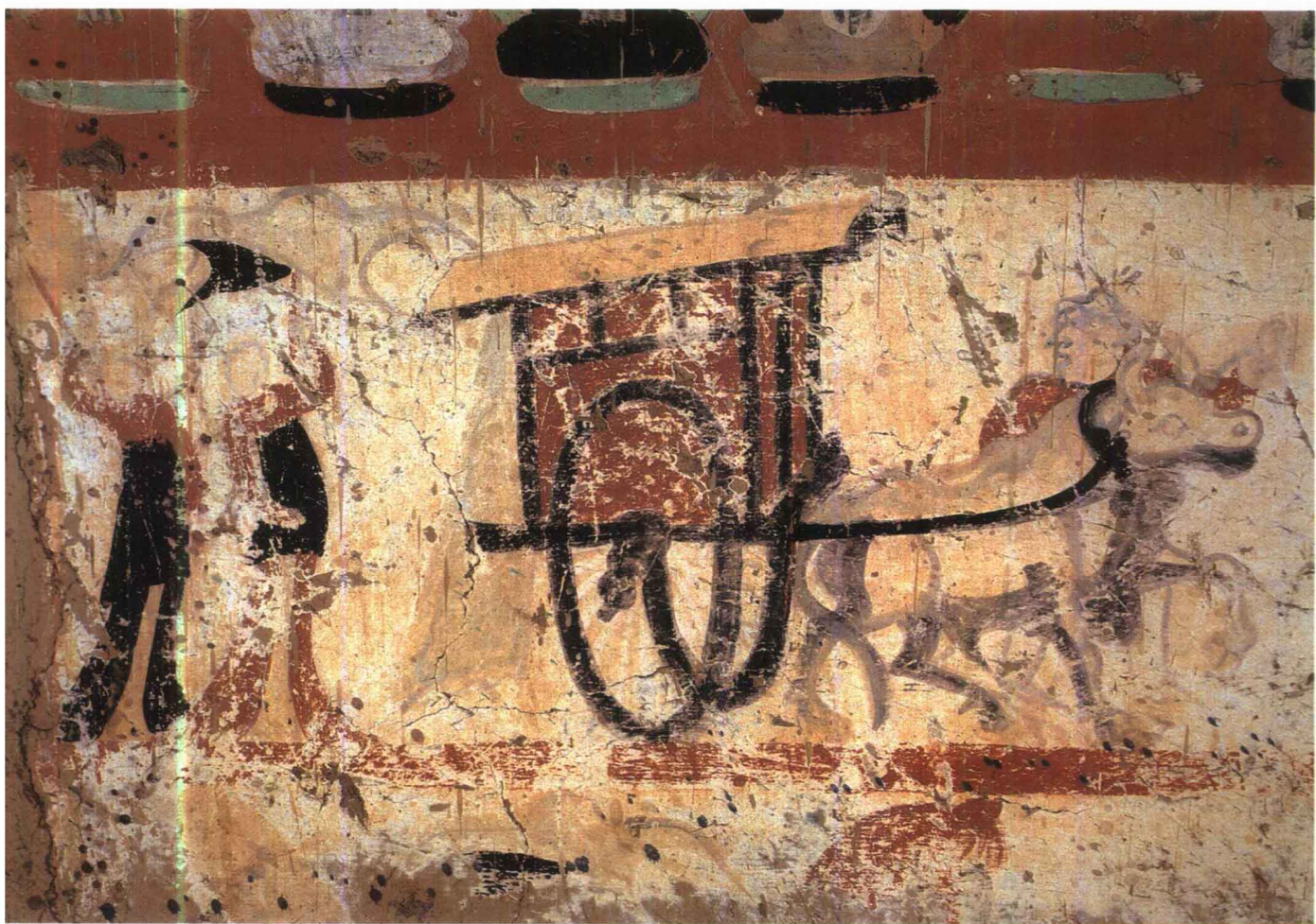
5 第301窟 东壁南侧 供养人与牛车 北周末隋初