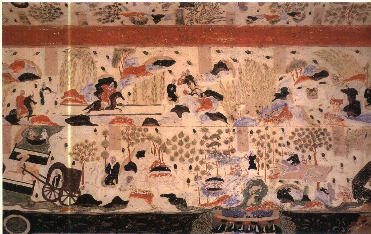
10 第302窟 人字披顶西披（部分） 隋