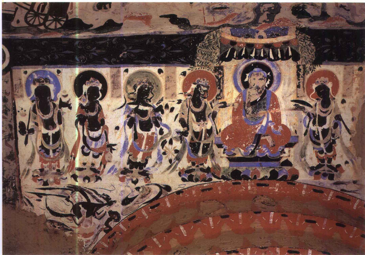
7 第302窟 中心柱上方平基顶 说法图 隋