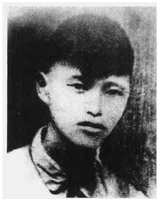
蔡会文 赣南军区司令员、湘粤赣边游击支队支队长