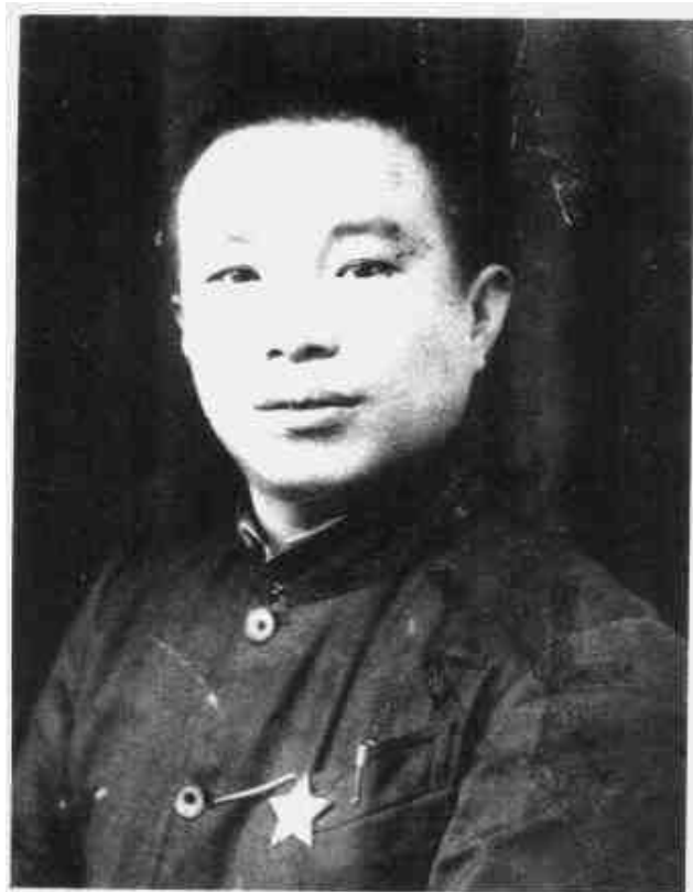
黄道 中共闽北分区委书记、闽赣省委书记、闽赣省抗日军政委员会主席