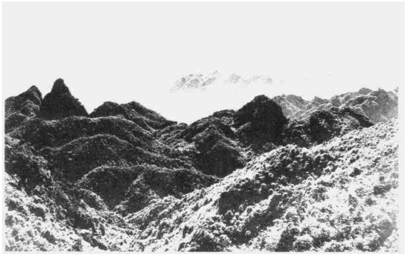
闽粤边游击区红军游击队主要活动地区之一——乌山。