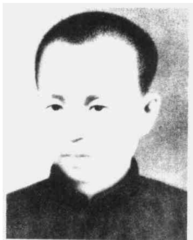
李乐天 中共赣粤边特委书记、赣粤边军分区司令员兼政委