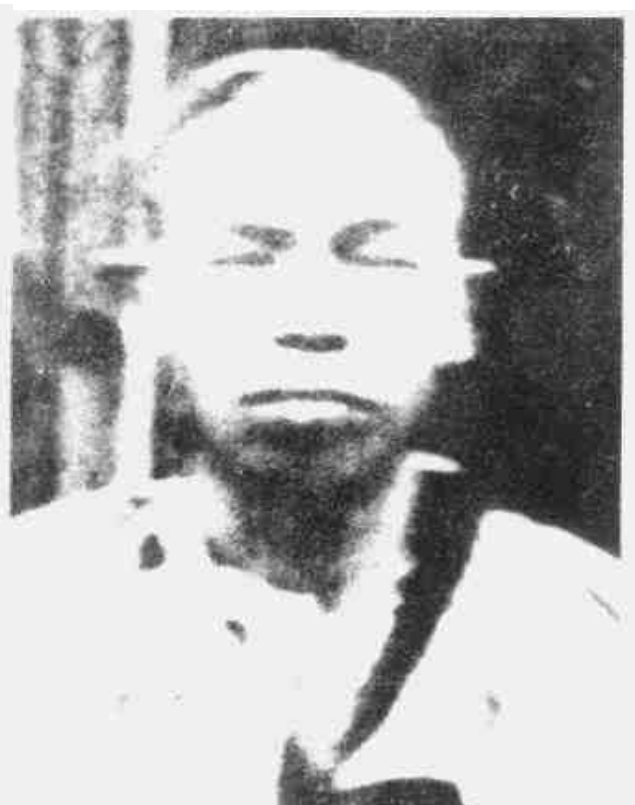
刘畴西 红10军团军团长