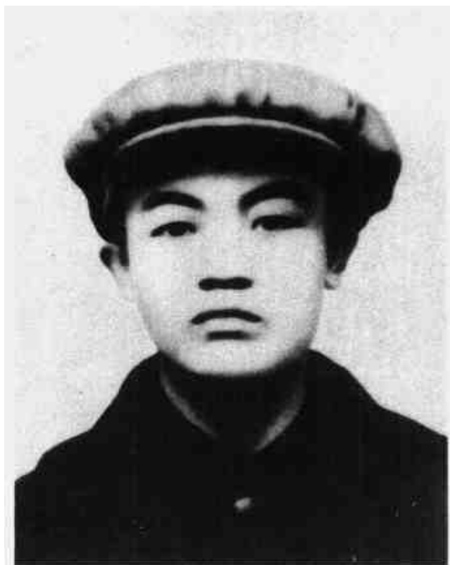
贺昌 中共中央分局委员、中央军区政治部主任