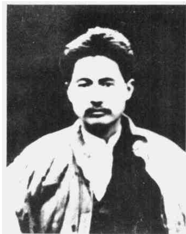
方志敏 红10军团军政委员会主席