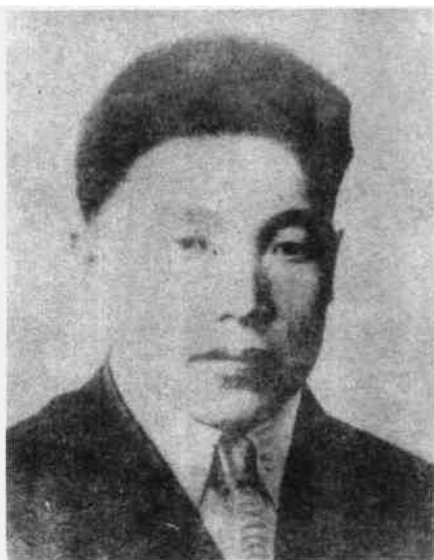
梁柏台 中华苏维埃共和国中央政府办事处副主任