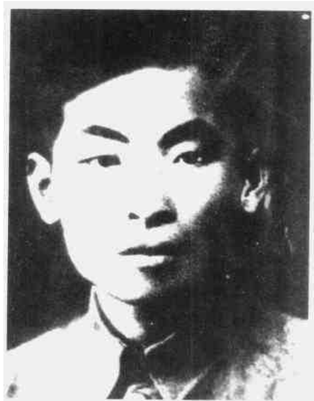
叶飞 中共闽东特委书记、闽东独立师师长兼政委、闽东军政委员会主席