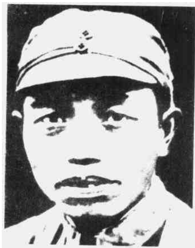
谭震林 闽西南军政委员会副主席