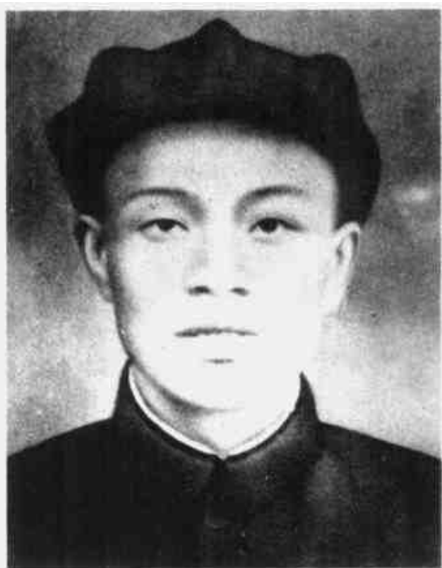
唐在刚 闽浙赣军区司令员