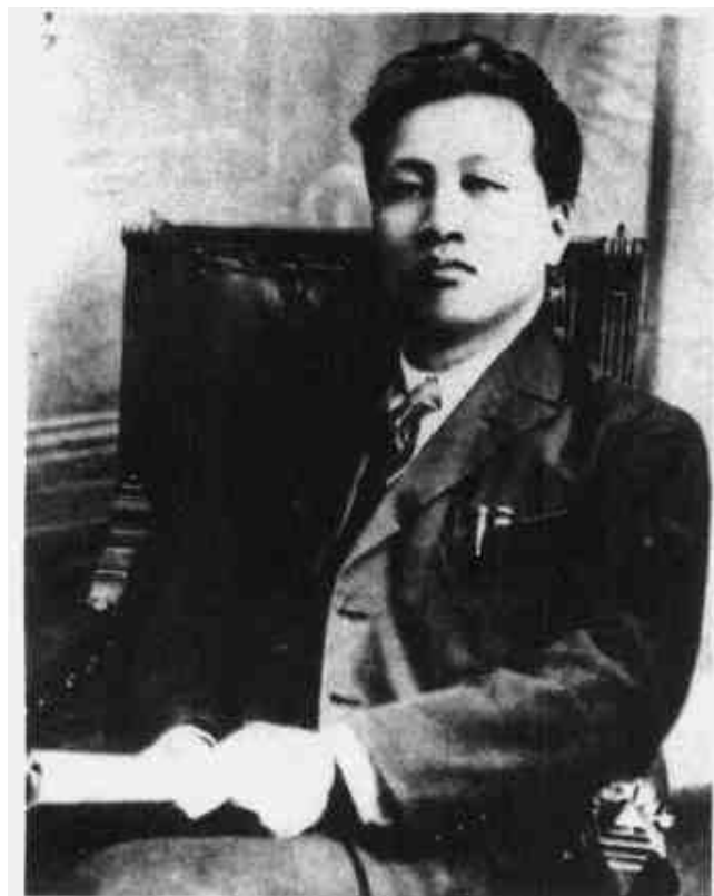
刘伯坚 赣南军区政治部主任