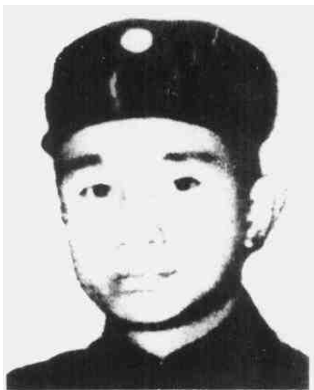
粟裕 中国工农红军挺进师师长、闽浙边临时省军区司令员