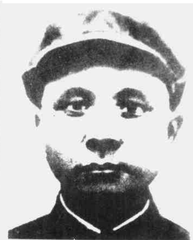
邓子恢 闽西南军政委员会副主席