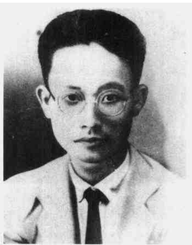
阮啸仙 中共赣南省委书记、赣南军区政委