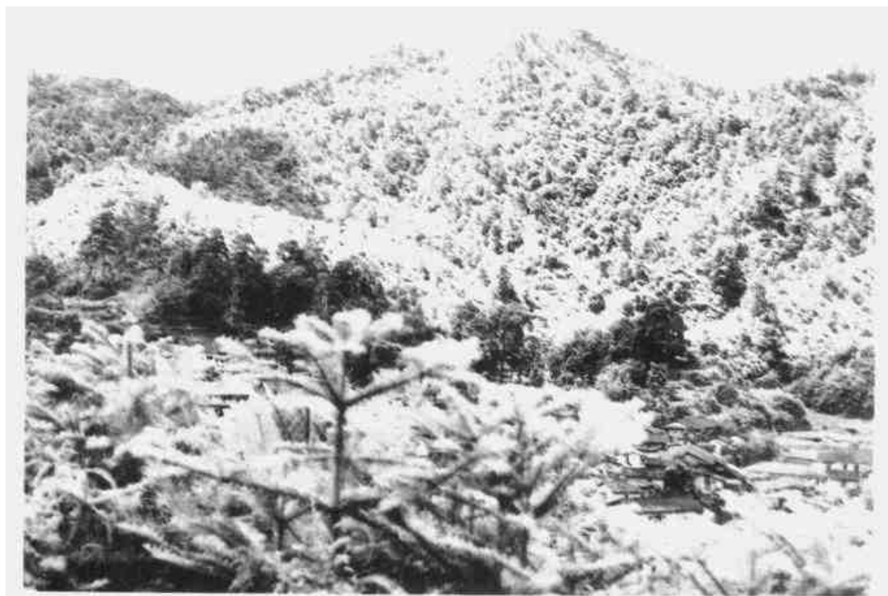
闽赣边红军游击队主要活动区域之一——(长)汀瑞(金)交界之观音岫。