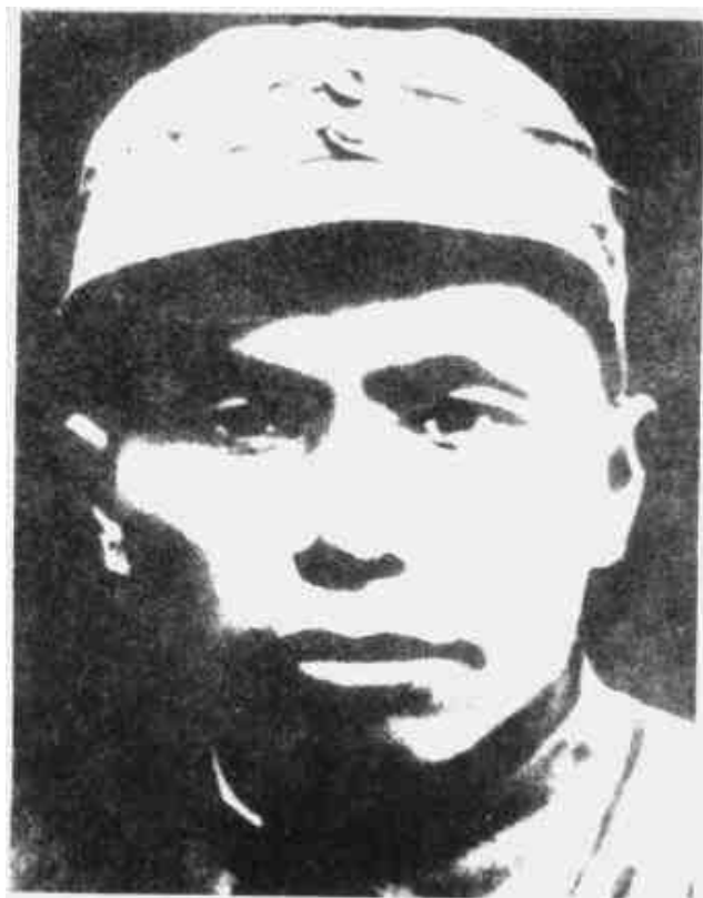
张鼎丞 闽西南军政委员会主席