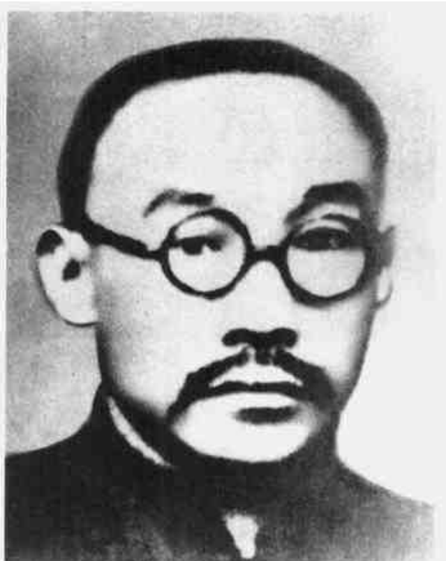
何叔衡 原中央政府执行委员会委员、 工农检查部部长、内务部代部长