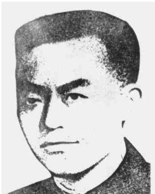
关英 中共闽浙赣、皖浙赣省委书记