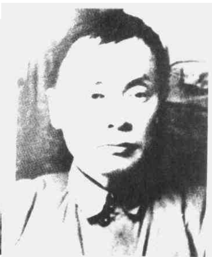
陈毅 中共中央分局委员、中华苏维埃共和国中央政府办事处主任