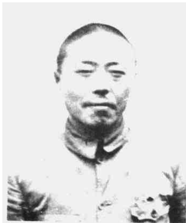
项英 中共中央分局书记、中央军区司令员兼政委、中央革命军事委员会中区分会主席