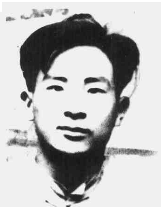
古柏 原粤赣军区游击支队司令员