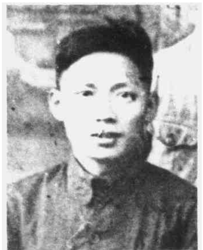
刘英 中国工农红军挺进师政委、挺进师政委、中共闽浙边临时省委书记、省军区政委