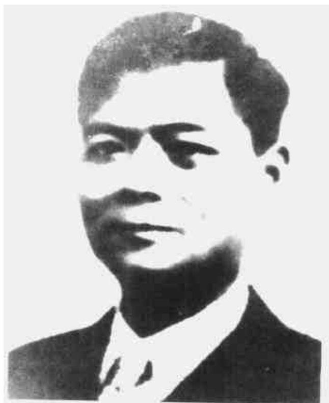
陈潭秋 中共中央分局委员