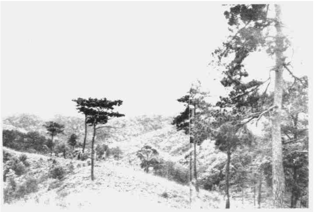
闽西红军游击队经常活动的地区——永定金丰大山。