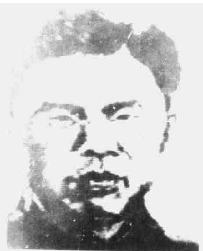
黄会聪 中共闽粤边特委书记