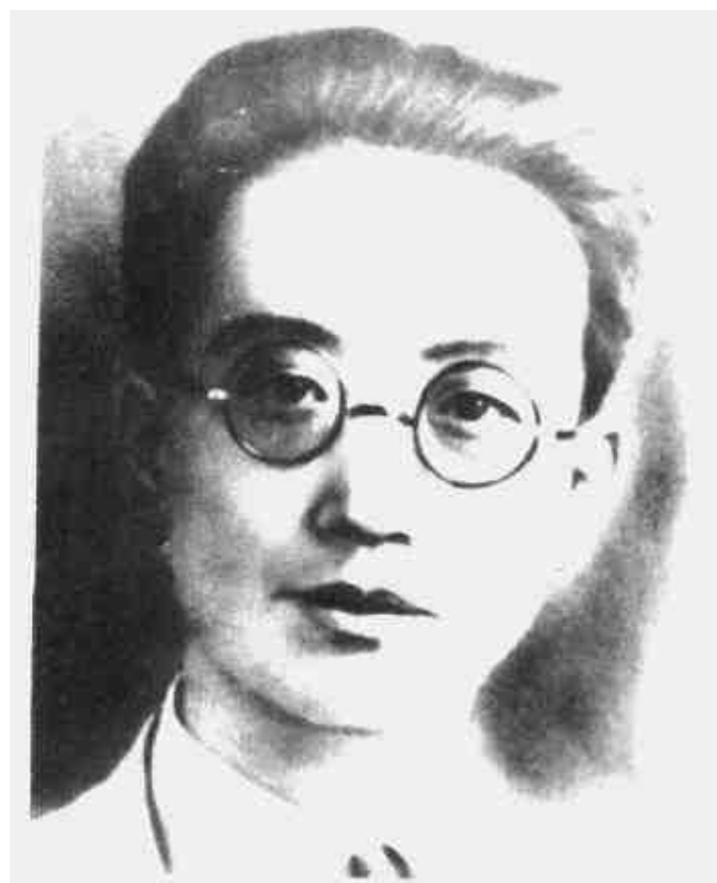
瞿秋白 中共中央分局委员