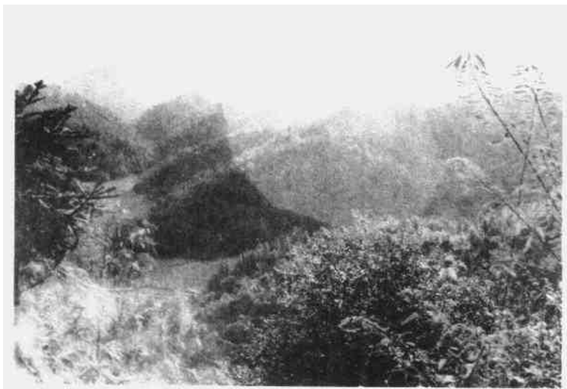
赣粤边游击区的中心、中共中央分局活动区域之一——油山。