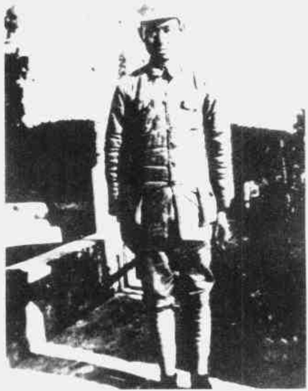
高敬亭 鄂豫皖边游击区红 28 军政委