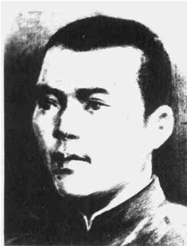
张星江 中共鄂豫边省委书记兼红军游击队指导员