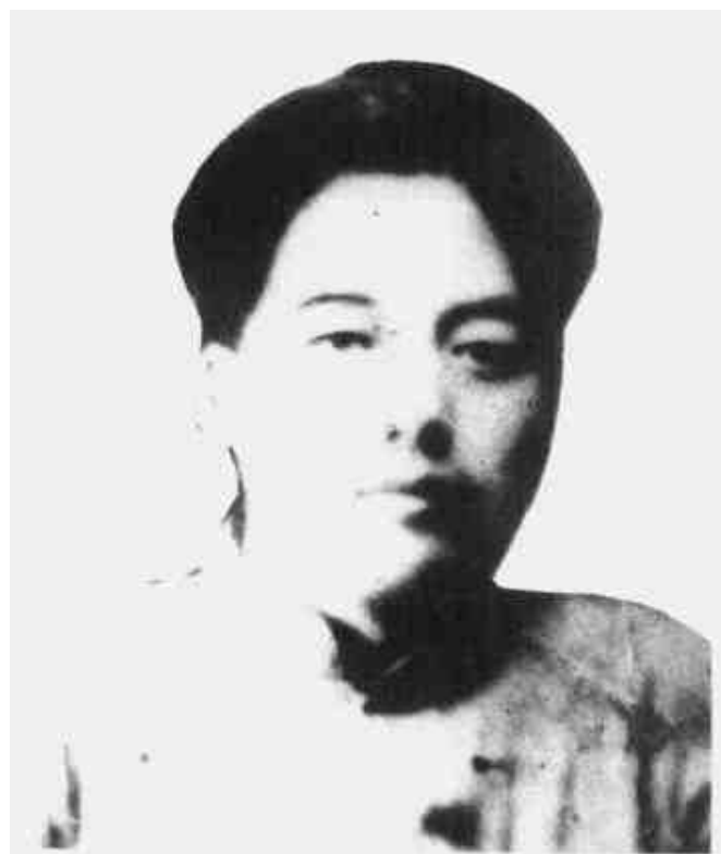
毛泽覃 中共福建省委书记