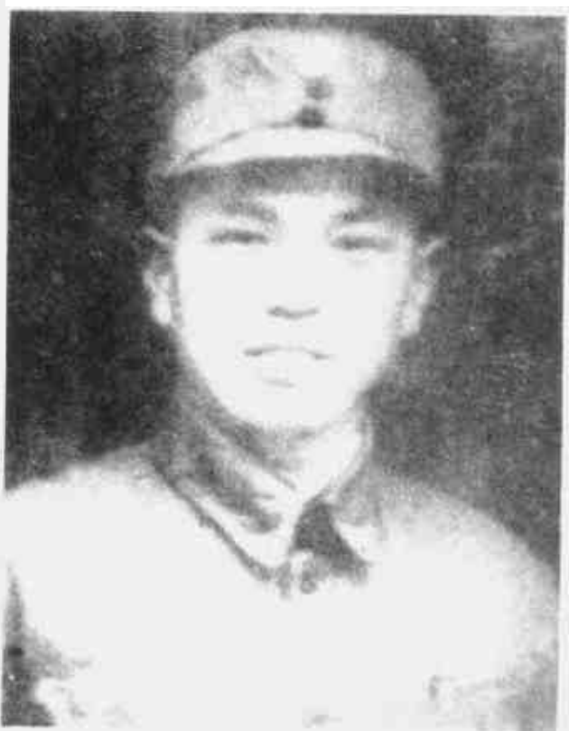
傅秋涛 中共湘鄂赣省委书记兼军区政委、湘鄂赣军区人民抗日军事委员会主席