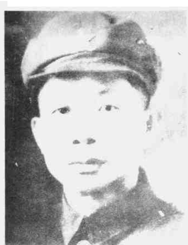
冯白驹 中共琼崖特委书记、琼崖红军游击队主要领导人、广东民众抗日自卫团第 14 区独立队队长