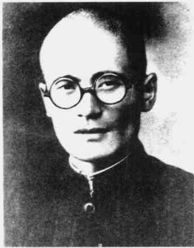
谭余保 中共湘赣临时省委书记、省军政委员会主席、湘赣游击司令部政委