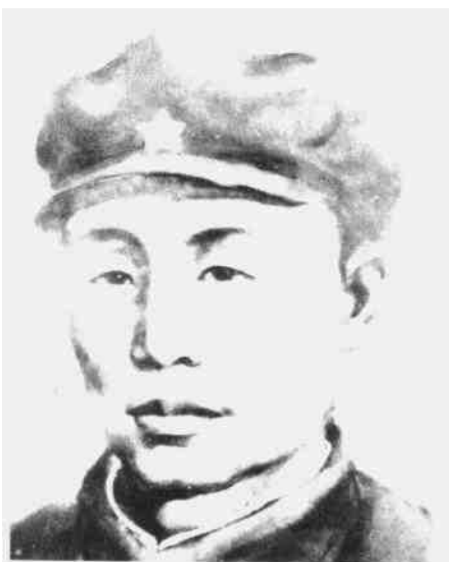
赖昌祚 中共瑞西特委书记