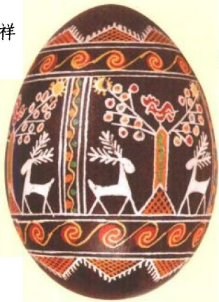
一枚乌克兰彩蛋，描绘了驯鹿们站在生命之树下面。像蛋一样，这一主题在北美和欧洲艺术作品中频繁出现，是创世与再生的象征。

除此之外，蛋还代表满是憧憬与希望的春天。在基督教的复活节庆典中，代表复活的蛋的位置是不可取代的。大斋节（复活节前为期四十天的斋戒及忏悔，以纪念耶稣在荒野禁食。——译者注）行将结束前的食蛋传统就是这一圣餐祭典之寓意的有力表现。在犹太教习俗中，逾越节家宴中的蛋也象征着希望，按照传统，蛋在给犹太哀悼者的食物中占据首席位置。