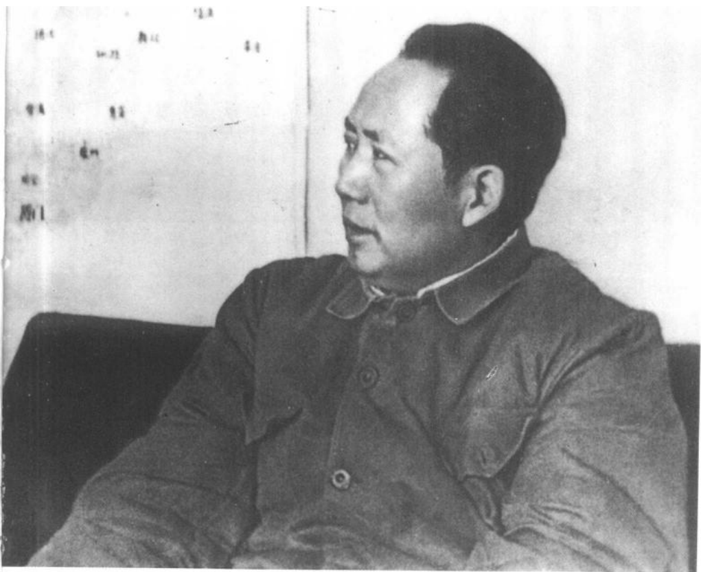
1948年9月至1949年1月,毛泽东同中央军委其他领导人,在河北省平山县西柏坡指挥人民解放军同国民党军进行伟大的战略决战。图为毛泽东在西柏坡。