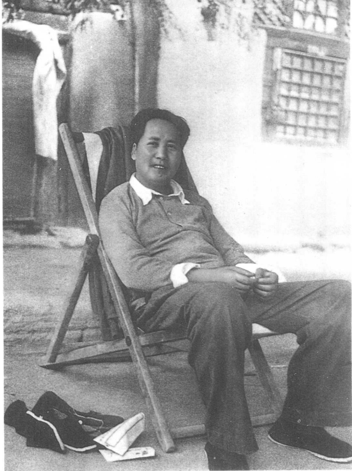
在伟大的战略决战中，毛泽东满怀胜利喜悦。