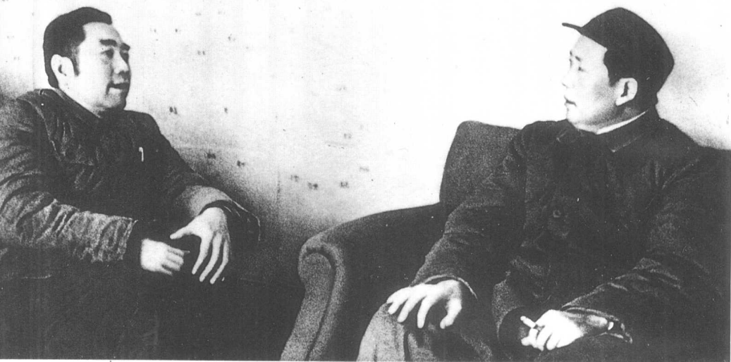
战略决战期间，毛泽东同周恩来在西柏坡分析战区形势。