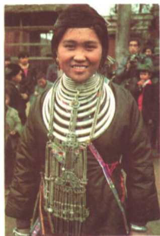
溶江河侗族姑娘正面服饰