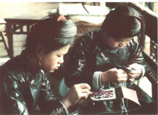
溶江河侗族姑娘在绣花