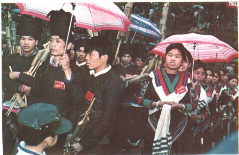
三月三花炮节游行的苗族芦笙队