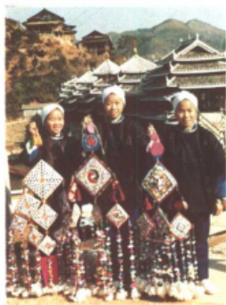
侗族姑娘将吉祥物 「如意串珠」献给程阳桥