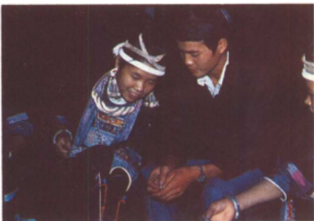
侗族姑娘在绣花