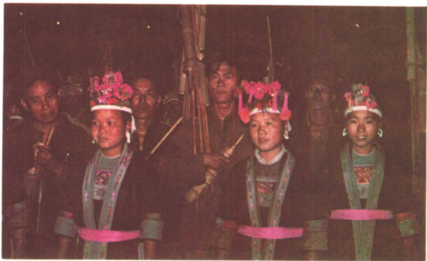
三月三花炮节游行的瑶族芦笙队