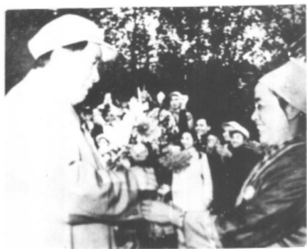
1958年侗族女青年吴英花在南宁向毛泽东主席献花