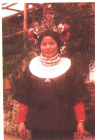
林溪侗族姑娘盛装