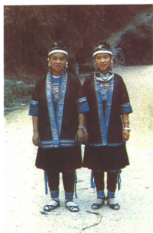
侗族姑娘正面头饰