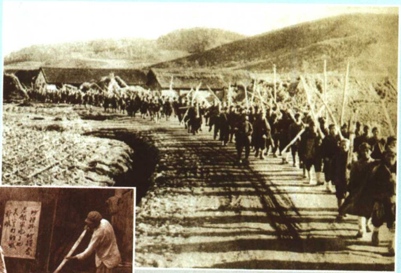
东北群众组成的随军担架队 开赴朝鲜