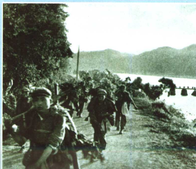
跨过鸭绿江，踏上朝鲜国土的志愿军 部队向前线开进