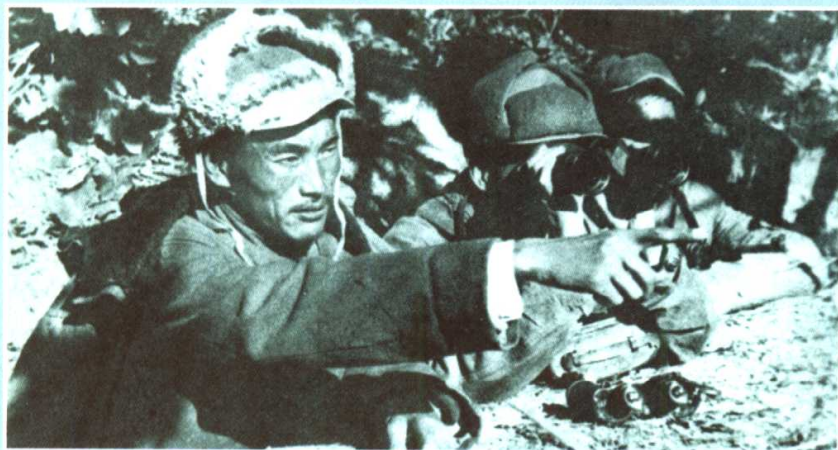
坚守黄草岭的志愿军部队