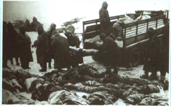
美军在第二次战役中伤亡惨重。 图为美军在运送尸体