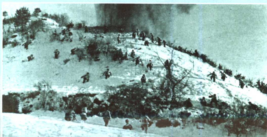
第二次战役中，志愿军部队对美军展开猛烈进攻