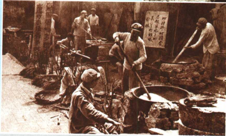
国内群众为志愿军赶制炒面