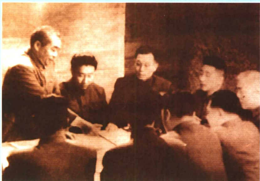
彭德怀在部署第五次战役 作战任务