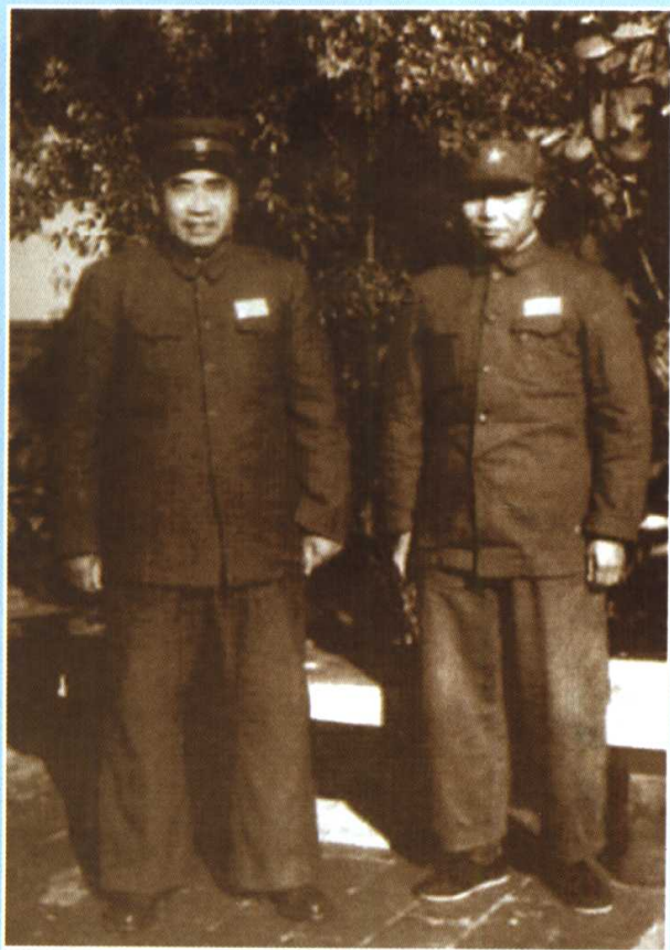
志愿军第9兵团开赴朝鲜战场前夕，朱德总司令到部队进行动员。图为他与第9兵团司令员兼政委宋时轮的合影