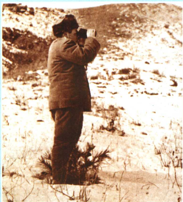
彭德怀在朝鲜前线