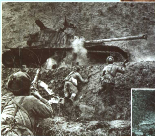
向敌军坦克攻击中的志愿军反 坦克小组