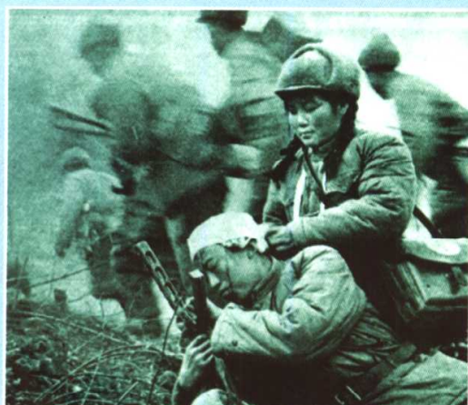
志愿军医务人员在火线为伤员包扎