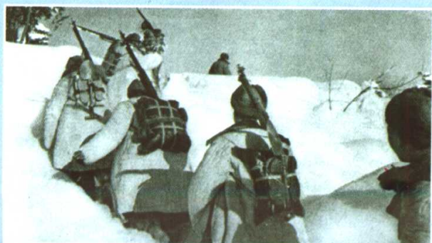
志愿军第9兵团部队正向长津湖地区开进