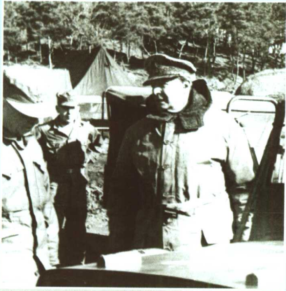
麦克阿瑟在朝鲜视察，声称要在 1950年圣诞节前结束战争