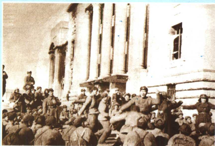
中朝官兵在汉城国会大厦前共庆胜利