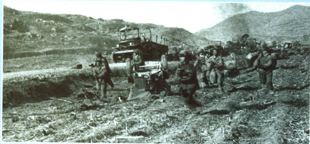
坚守龙源里 的志愿军部队对 南撤的美军实施 反击