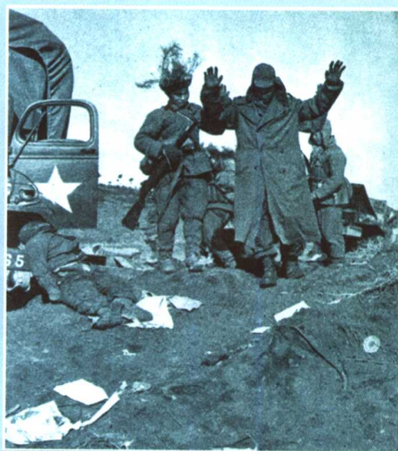
被俘的美军士兵被押下战场