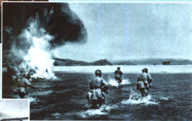
志愿军战士冒着敌军炮火，强渡江河，冲向敌阵