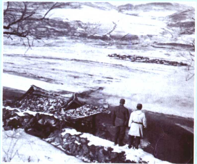
美军在鸭绿江边，观 察对岸中国境内情况