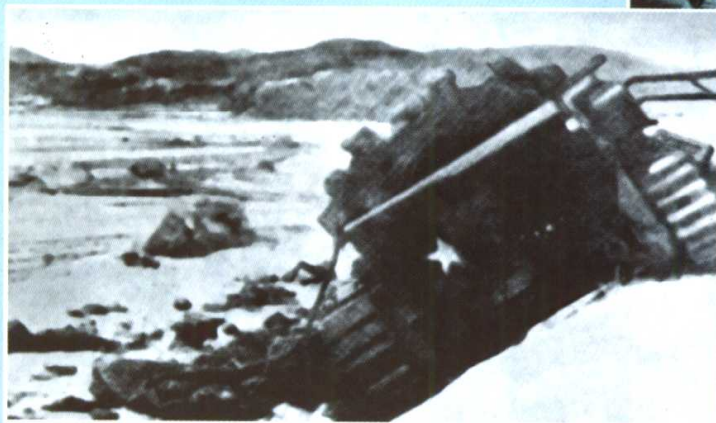
志愿军部队在高阳地区全歼英皇家重坦克营1个中队。图为被击毁的英军重型坦克