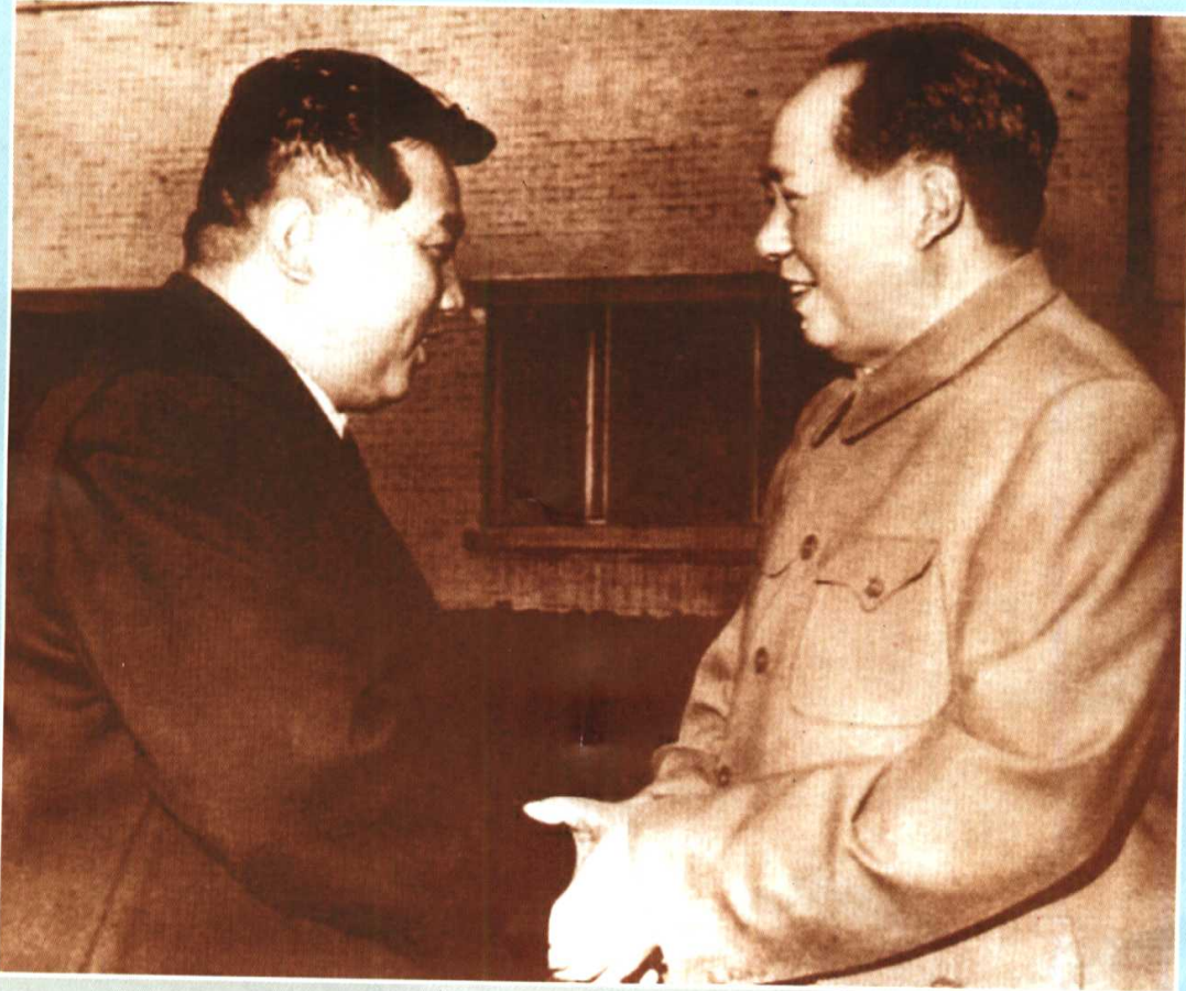
毛泽东会见金日成