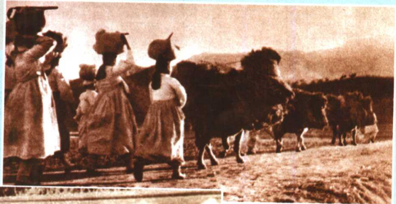
朝鲜妇女踊跃支 前，为志愿军运送物资