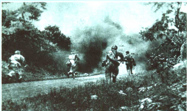
志愿军部队向云山地区美军发起猛烈进攻