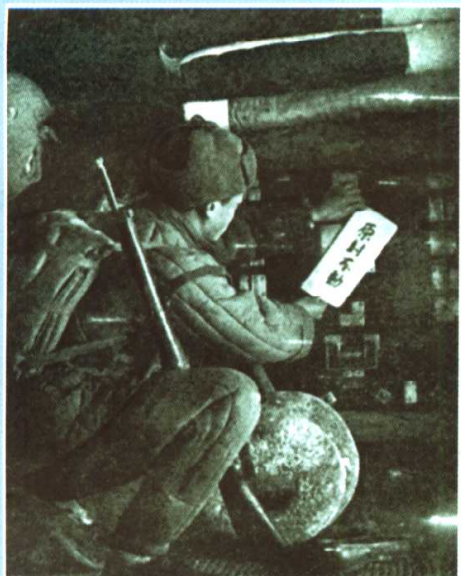
志愿军部队模范执行群众纪律，爱护朝鲜的一山一水，一草一木