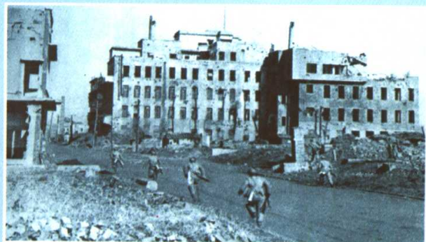
志愿军部队攻入平壤市区