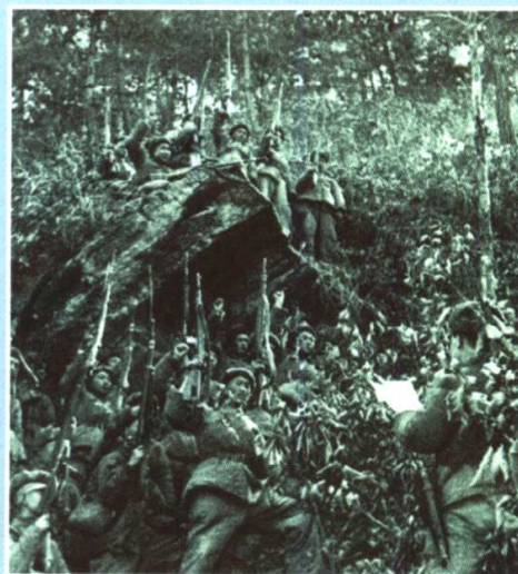
参加横城反击作战的志愿军官兵宣誓：“坚决消灭敌人”