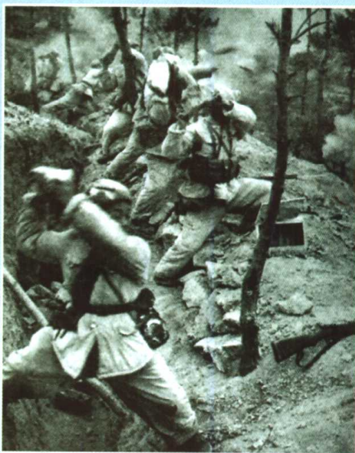
志愿军战士在汉江南岸地区顽强阻击美军的反扑