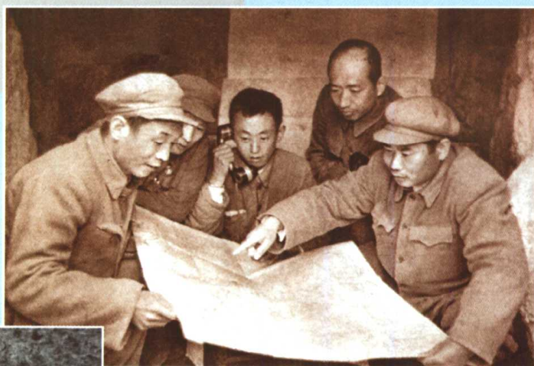
第五次战役中，志愿军第19兵团司 令员杨得志(右一)、政委李志民(左一)正 在部署作战