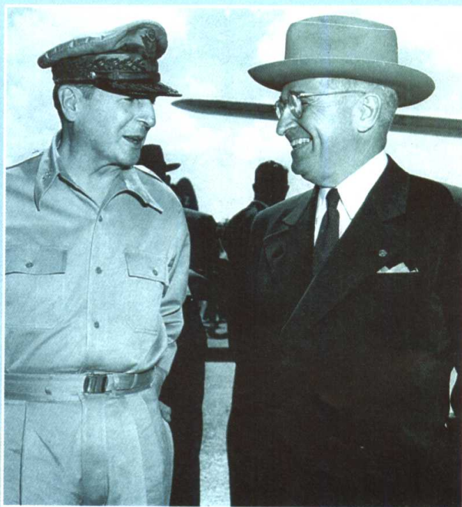
杜鲁门(右)与麦克阿瑟在威克岛会谈