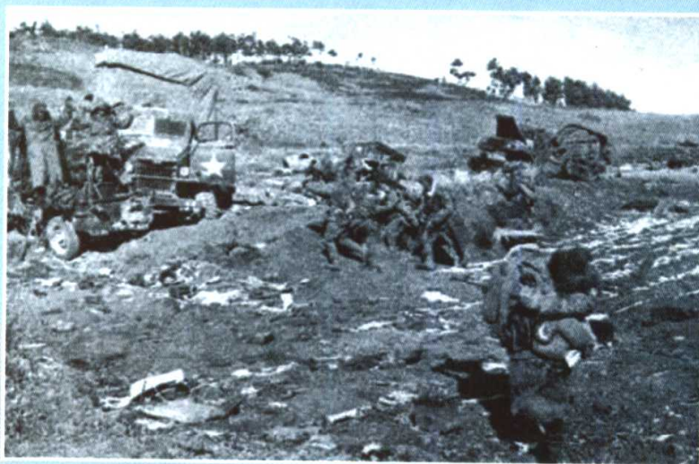
志愿军部队奋勇截击南逃的 美军车队