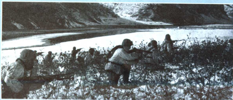
志愿军主力沿 清川江对南撤之敌 展开追击作战