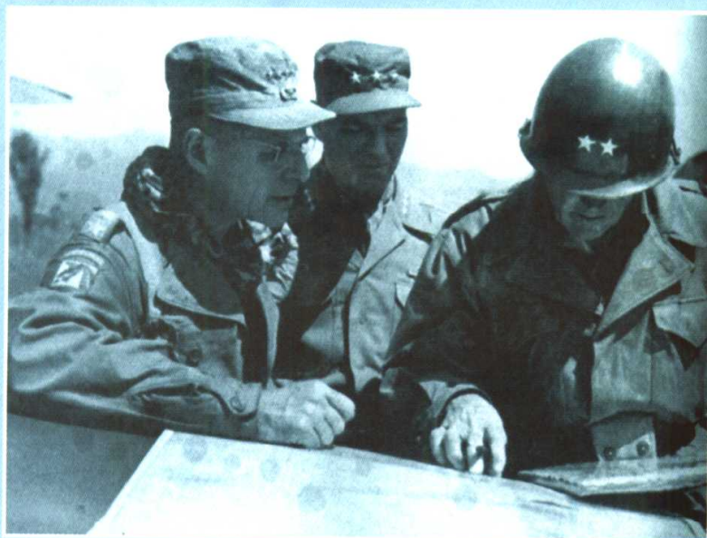
“联合国军”总司令李奇微(左)与美第8集团军司令范佛里特(中)在研究进攻计划