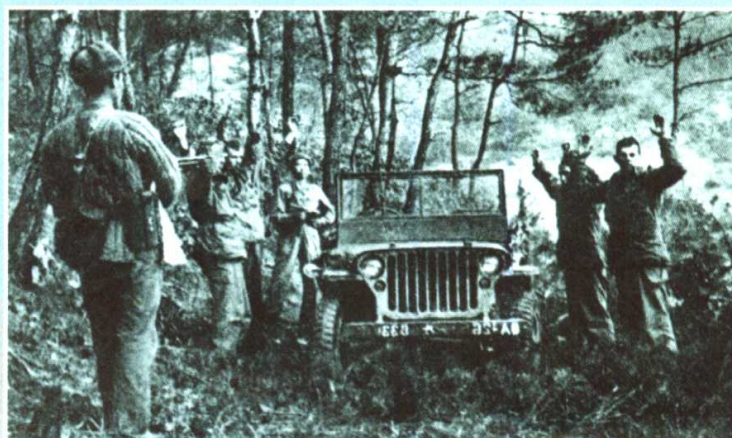
云山战斗中，志愿军俘虏美军士兵