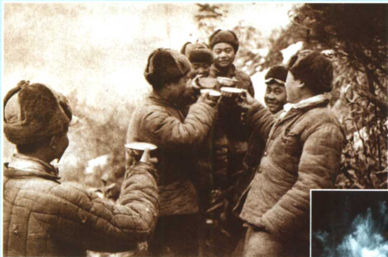
1951年元旦来临，前线的志愿军战士以雪水代酒，预祝胜利