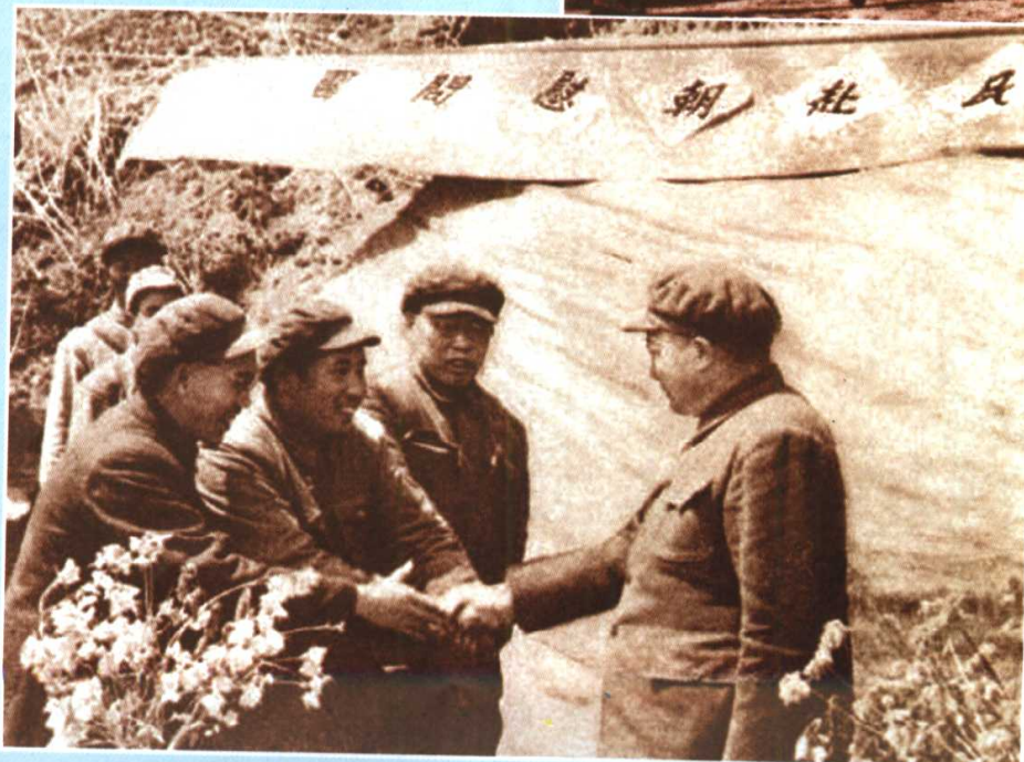
以廖承志（右三） 为团长的第一届赴朝慰 问团到达朝鲜，受到彭 德怀司令员的欢迎