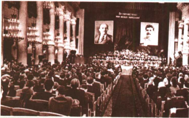
苏联群众举行集会，声援中朝人民抗 击美国侵略的正义行动