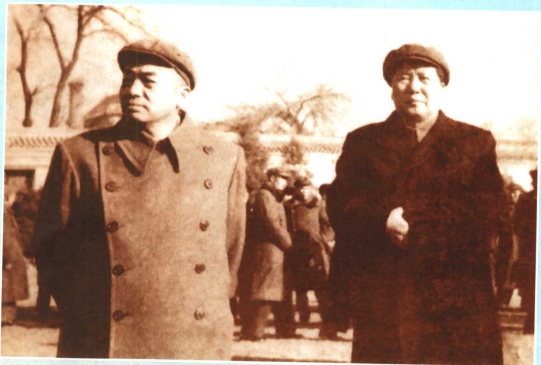
1951年2月下旬，彭德怀回国述职，在京郊玉泉山向毛泽东汇报朝鲜战局情况