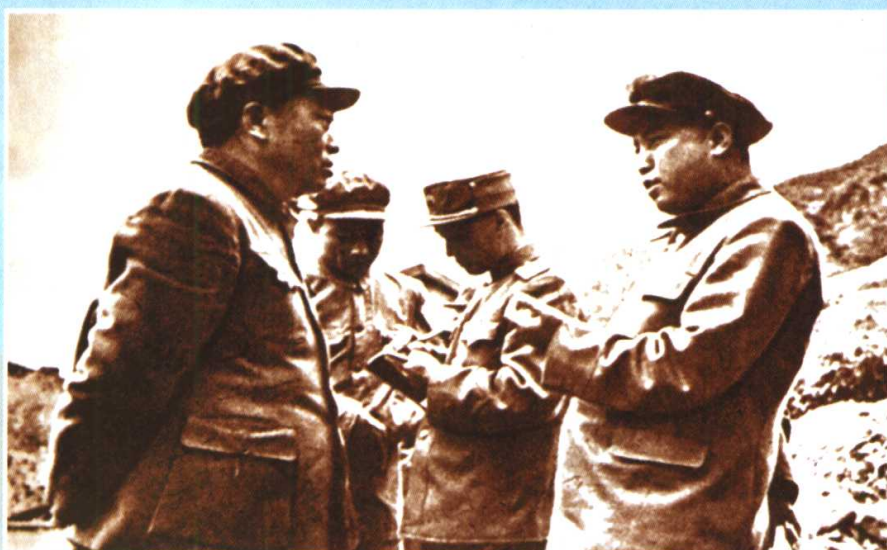
彭德怀 与金日成商 议作战事宜