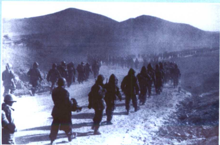
美军部队越过清川江，向中朝边境地区推进