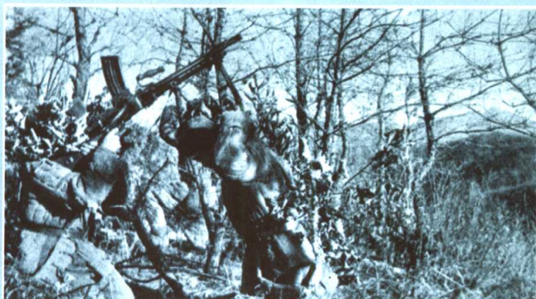
向敌机射击中的志愿军轻机枪手