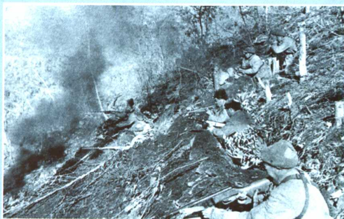
实施机动防御的志愿军部队正在阻击进攻之敌