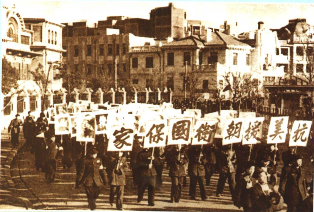
中国人民支持“抗美援朝，保家卫国”