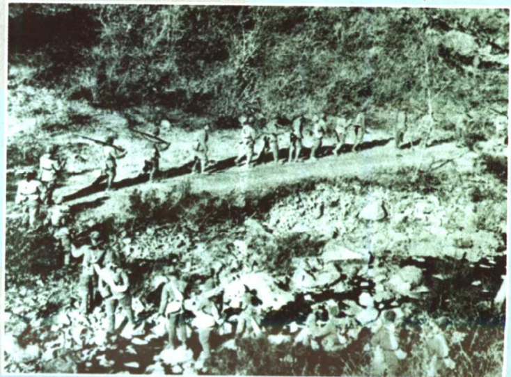
担负迂回任务的志愿军部队， 正向敌后开进