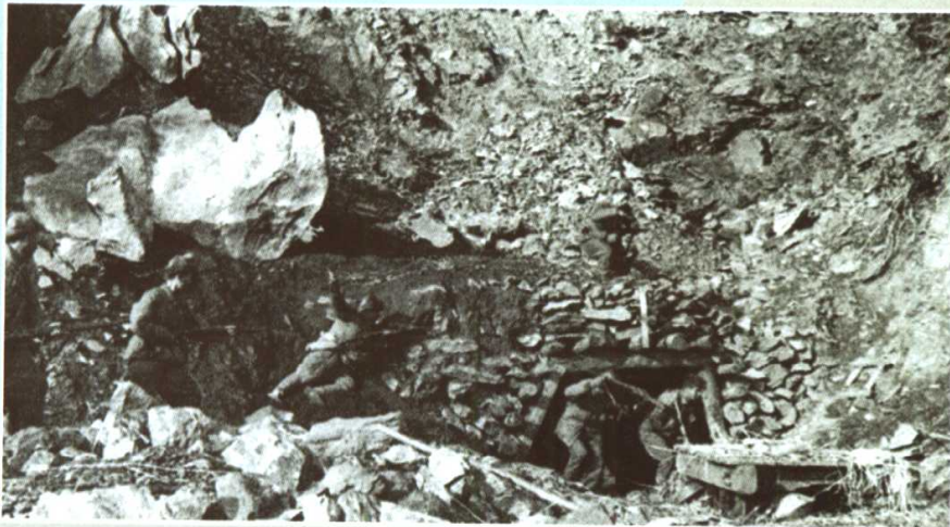
德川战斗中，志愿军官兵攻占 南朝鲜军阵地