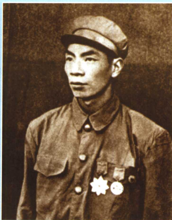
志愿军特级英雄、特等功臣杨根思