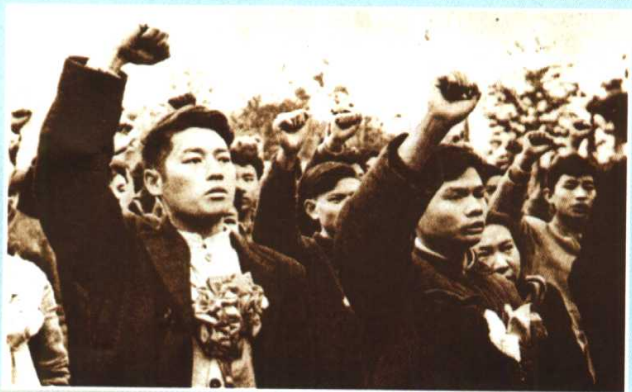
中国青年学生踊跃报名参军