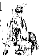
花果山美猴王出世

猴王整整衣服，进入洞府，见须菩提祖师端坐在瑶(yáo)台上，果然是位仙风道骨的大法师，忙倒身下拜。祖师知他不是俗骨凡胎，就收他为徒。又知他无名无姓，便说：“你是个天地生成的石猴，走起路来拐呀拐的像个猢猻(hú sūn)。就把猠字去了兽旁，教你姓孙吧！”猴王高兴地说：“好，好，从今有了姓了，万望师父再赐个名字才好。”祖师根据门下弟子辈分排名，给他取了法名，唤做“孙悟(wù)空”。