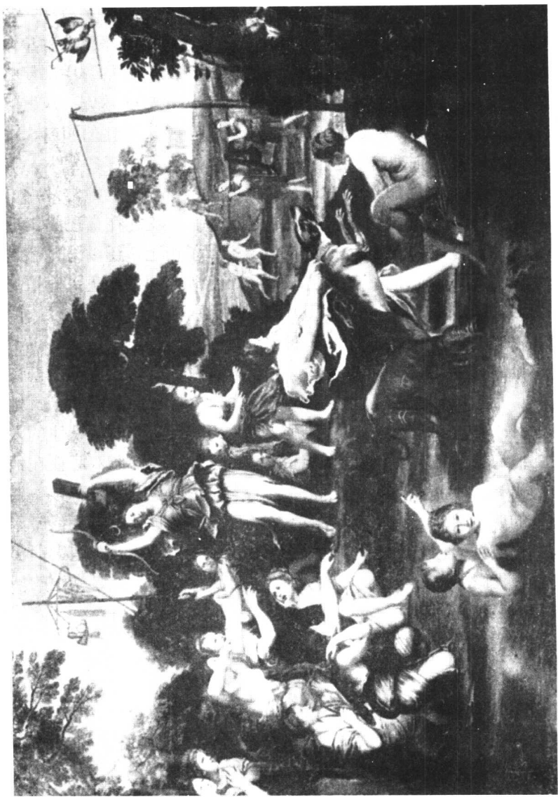
狄愛娜的出猎 Domenico Tiepolo 作