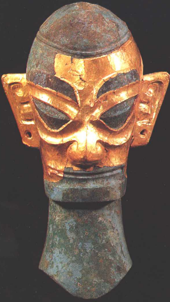
11 10 青铜跪坐人像 金面罩青铜人头像