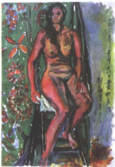
油画《巴黎少女》，刘海粟1981年画于香港