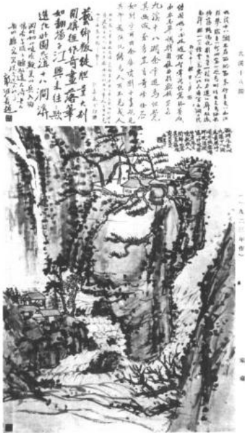
收入《海粟近作》的《九溪十八涧》，上有蔡元培、郭沫若等人的题字