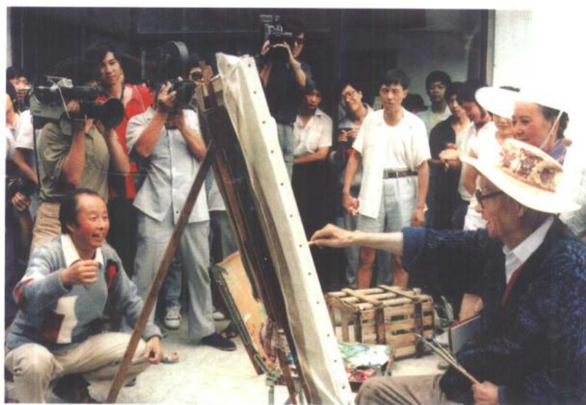
刘海粟十上黄山的艺术活动，带有浓厚的表演成分