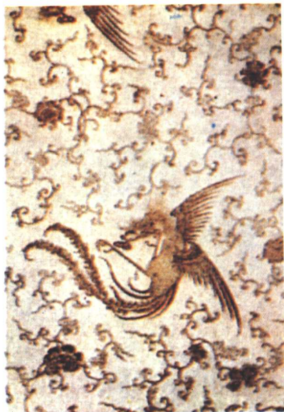
清代描金龙凤蜡笺