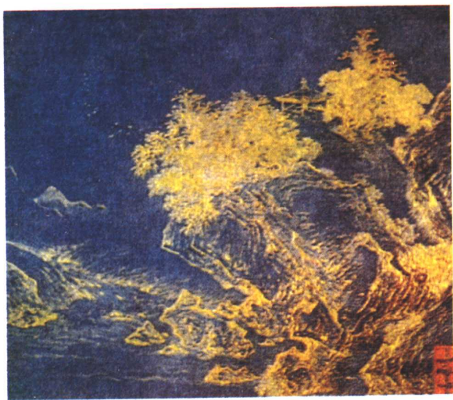
18世纪仿澄心堂纸描金山水蜡笺